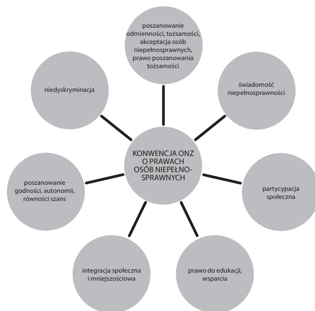
SCHEMAT 1. Najważniejsze zasady Konwencji ONZ obowiązujące w edukacji i terapii osób niepełnosprawnych