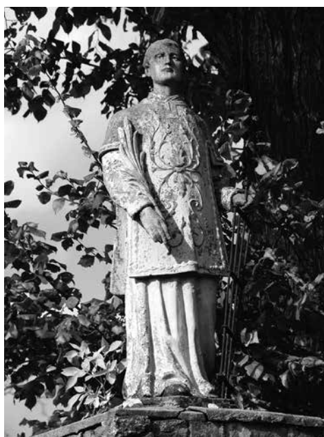
Il. 68. Goraj. Rzeźba św. Wawrzyńca.