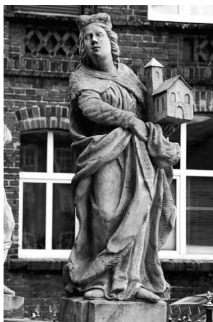
Il. 36. Żagań. Rzeźba św. Jadwigi Śląskiej.