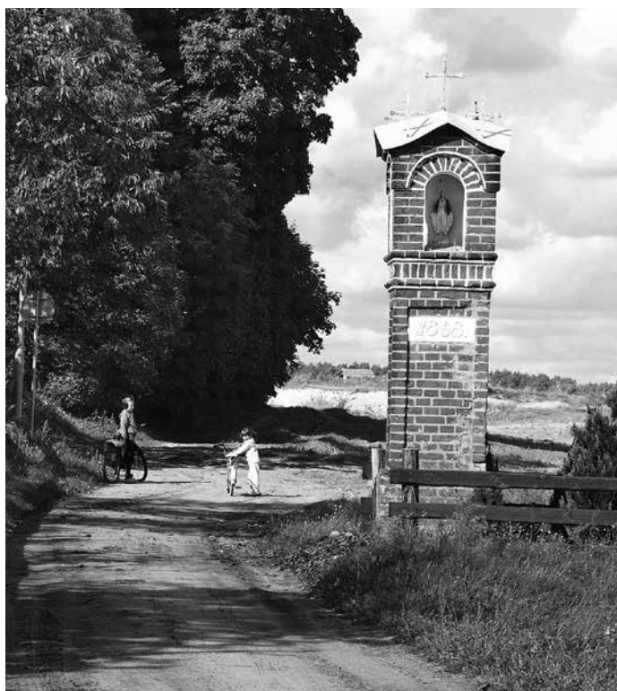
Il. 5. Kalsko. Kapliczka przydrożna z 1868 r.