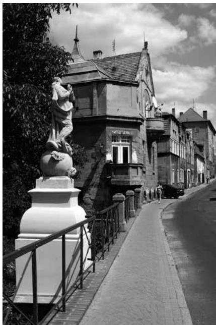
Il. 30. Koźuchów. Figura Matki Boskiej Niepokalanie Poczętej z XVIII w., ustawiona na moście.