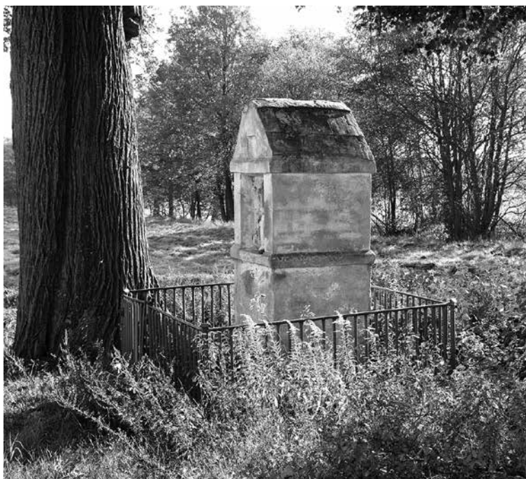
Il. 11. Ługi. Kapliczka przydrożna.