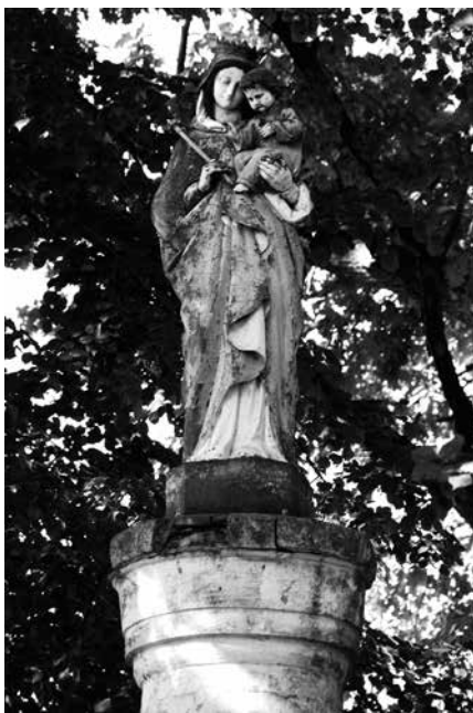
Il. 29. Zemsko. Przydrożna figura Matki Boskiej z Dzieciątkiem.