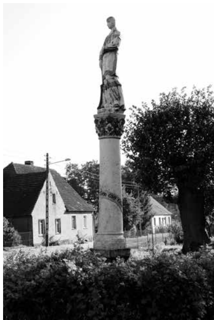
Il. 69. Łagowiec. Przydrożna figura św. Wawrzyńca z 1743 r., stojąca na wysokiej kolumnie.