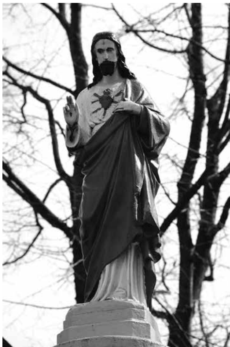
Il. 21. Nowe Kramsko. Przydrożna figura Chrystusa.