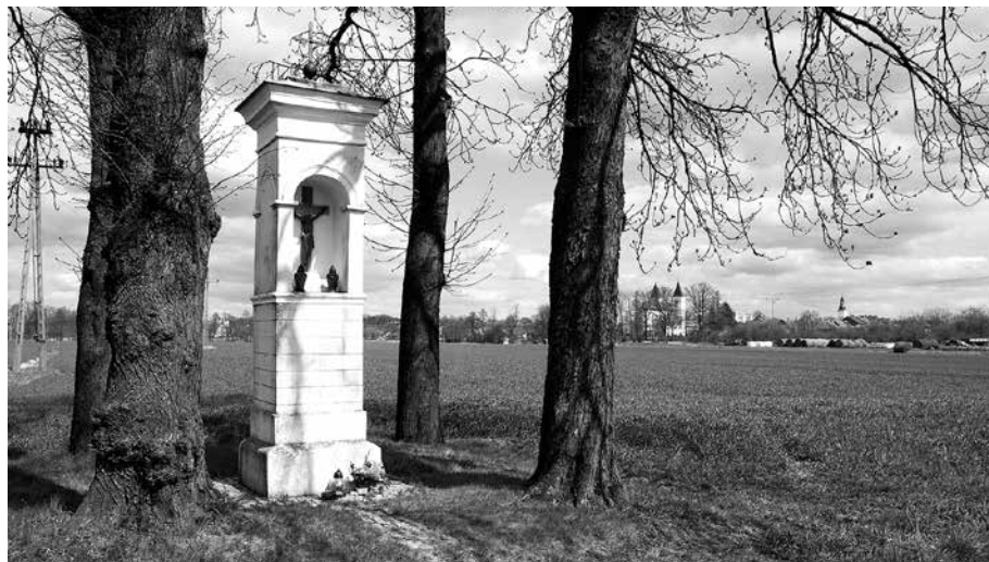
Il. 4. Babimost – okolica. Kapliczka przydrożna.