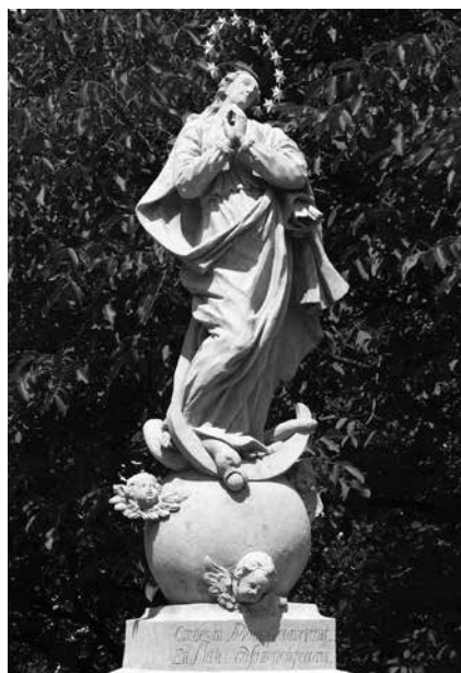
Il. 31. Koźuchów. Figura Matki Boskiej Niepokalanie Poczętej.