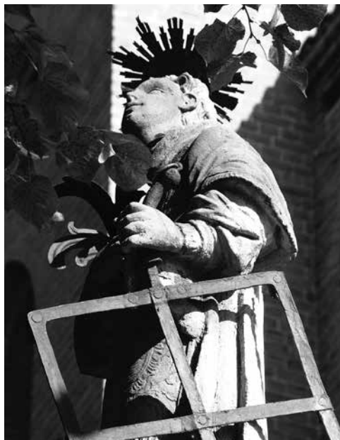
Il. 73. Popowo. Rzeźba św. Wawrzyńca.