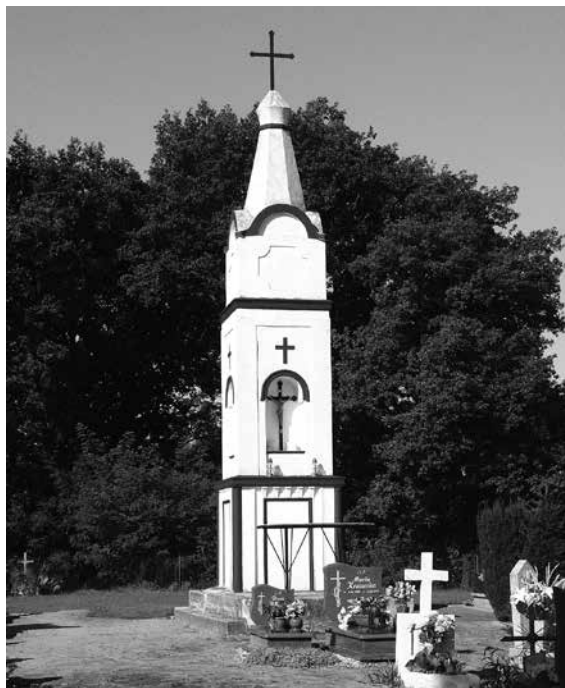
Il. 8. Popowo. Kapliczna na cmentarzu.