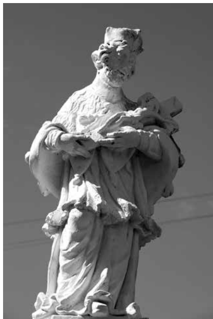
Il. 47. Grotów. Rzeźba św. Jana Nepomucena.