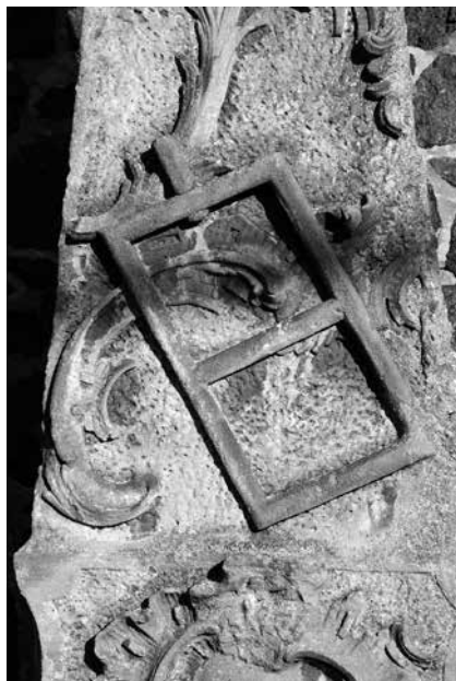
Il. 71. Ługi. Fragment pomnika poświęconego św. Wawrzyńcowi.