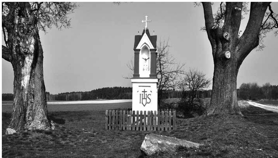
Il. 6. Osiecko. Kapliczka przydrożna.