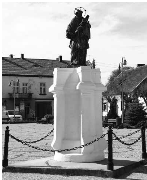
Il. 43. Bledzew. Figura św. Jana Nepomucena, stojąca na rynku.