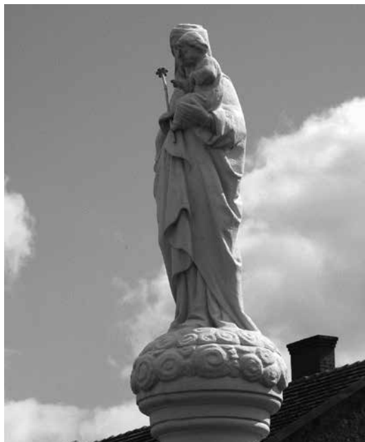
Il. 24. Babimost. Rzeźba Matki Boskiej z Dzieciątkiem.