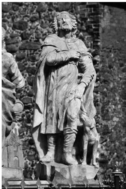
Il. 38. Żagań. Rzeźba św. Rocha.