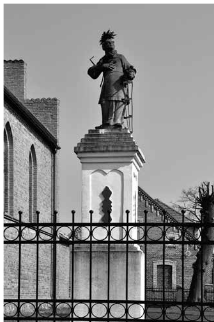
Il. 72. Popowo. Figura św. Wawrzyńca ustawiona na postumencie z XIX w. obok kościoła filialnego pw. św. Jana Chrzciciela.