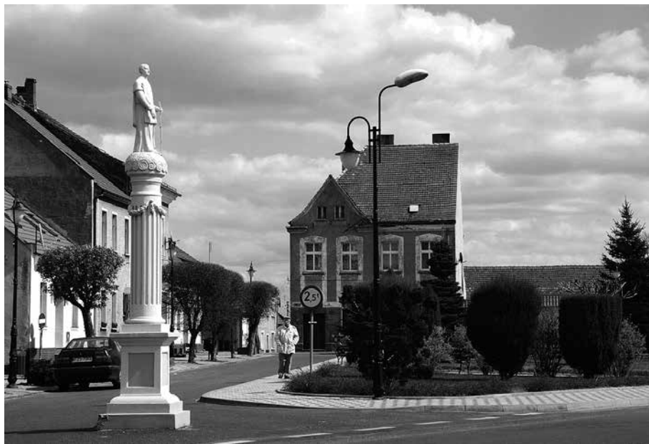
Il. 65. Babimost. Figura św. Wawrzyńca na wysokiej kolumnie, ustawiona na rynku.