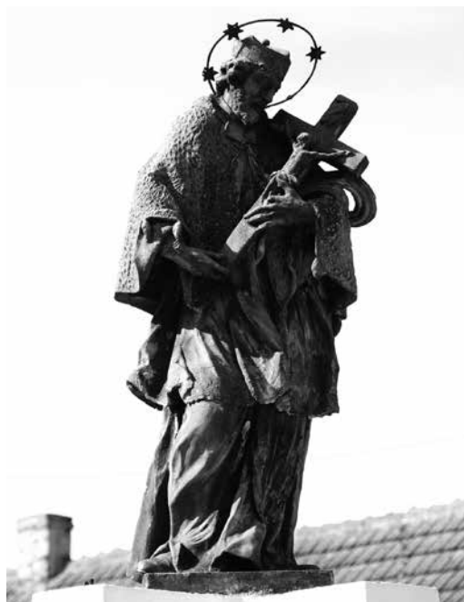
Il. 44. Bledzew. Barokowa rzeźba św. Jana Nepomucena.