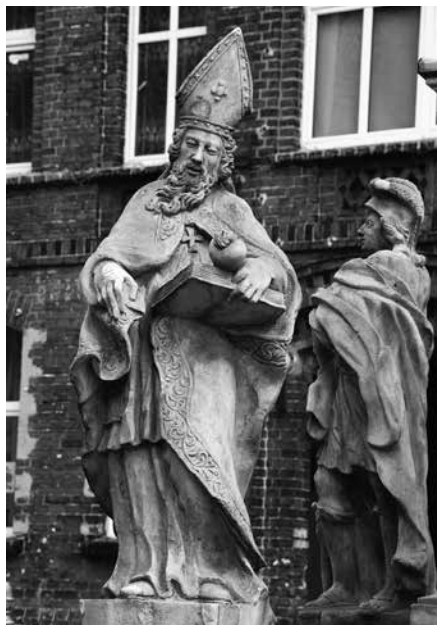
Il. 37. Żagań. Rzeźba św. Augustyna.