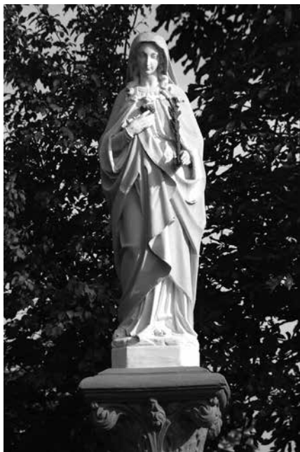
Il. 28. Nowa Wieś. Rzeźba Matki Boskiej.