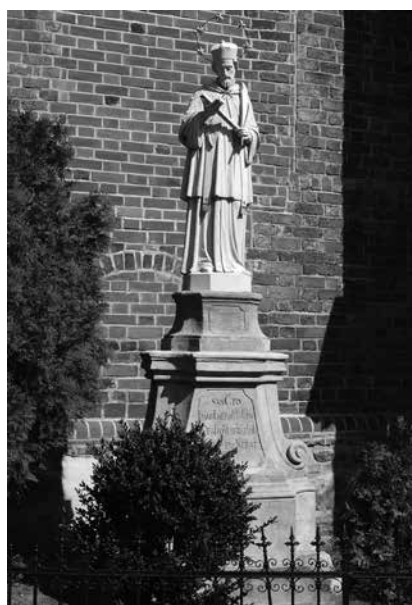
Il. 64. Zielona Góra. Figura św. Jana Nepomucena z 1900 r., stojąca na barokowym postumencie przed kościołem parafialnym pw. św. Jadwigi Śląskiej.