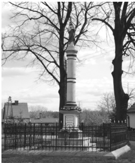
Il. 20. Nowe Kramsko. Kolumna z figurą Chrystusa.