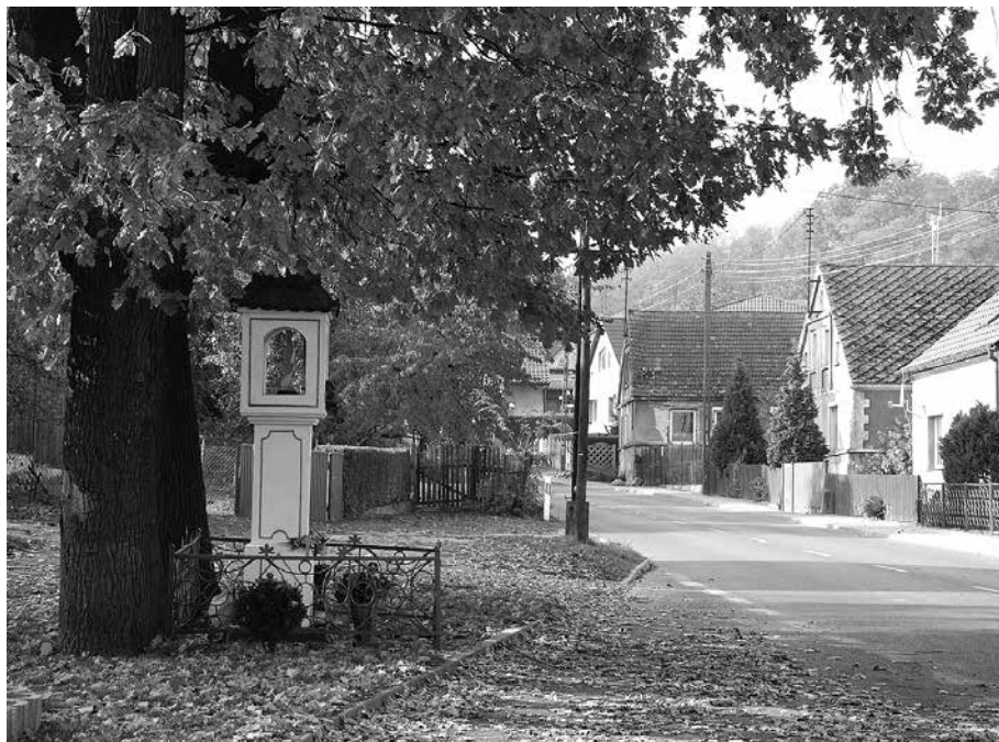
Il. 13. Łaz. Kapliczka przydrożna.