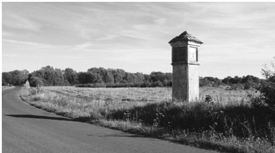
Il. 2. Miocin Dolny – Kozuchów. Jedna z kapliczek z drugiej połowy XVII w.