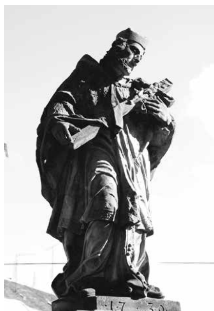
Il. 52. Nowa Sól. Rzeźba św. Jana Nepomucena z 1736 r., ustawiona przed kościołem parafialnym pw. św. Michała Archanioła.