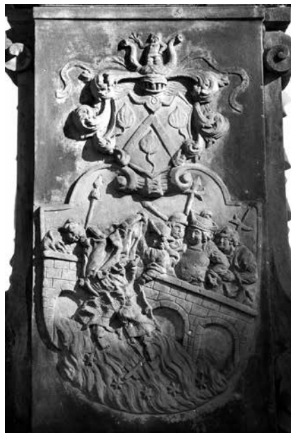
Il. 53. Nowa Sól. Frontowa ściana postumentu – płaskorzeźba przedstawiająca moment wrzucenia św. Jana do Wełtawy.