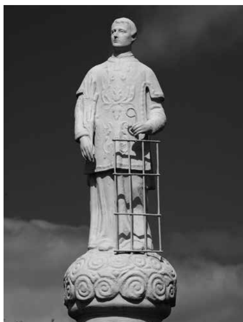
Il. 66. Babimost. Rzeźba św. Wawrzyńca.