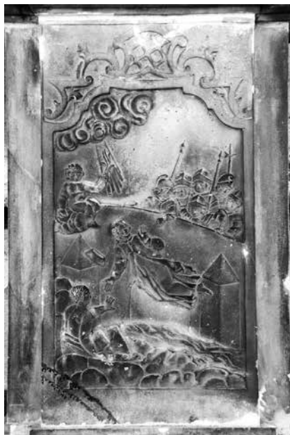
Il. 57. Otyń. Frontowa ściana postumentu – płaskorzeźba przedstawiająca moment wrzucenia św. Jana do Wełtawy.