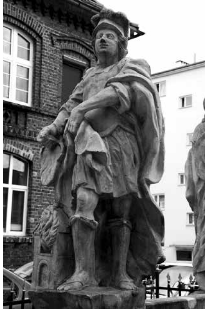
Il. 39. Żagań. Rzeźba św. Floriana.