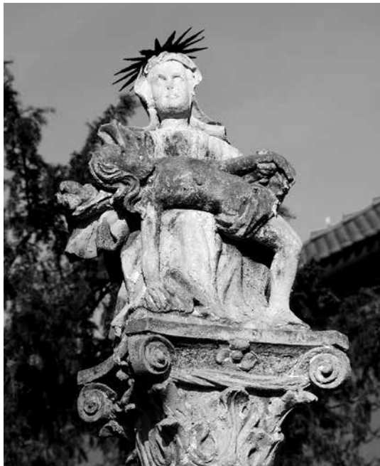
Il. 19. Jabłonów. Pieta z 1694 r. na zwieńczeniu kolumny.