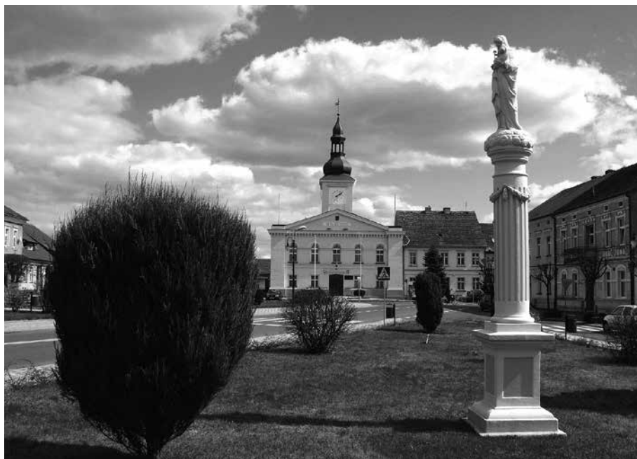
Il. 23. Babimost. Fragment rynku z figurą Matki Boskiej z Dzieciątkiem.