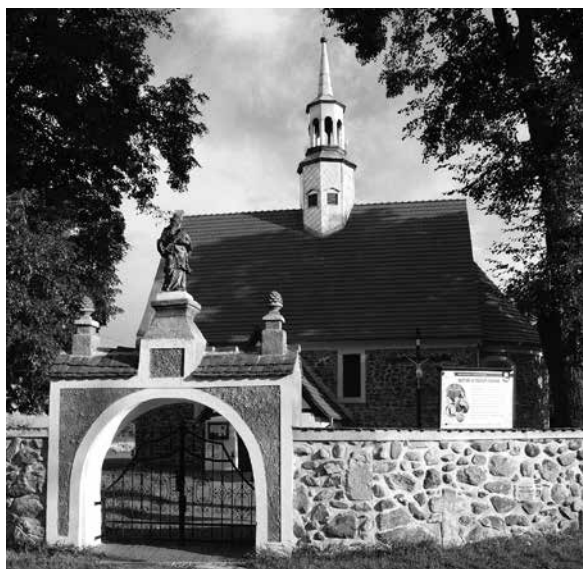
Il. 60. Stary Żagań. Figura św. Jana Nepomucena prawdopodobnie z 1715 r., wieńcząca bramę przed kościołem filialnym pw. Najświętszej Maryi Panny Królowej Polski.