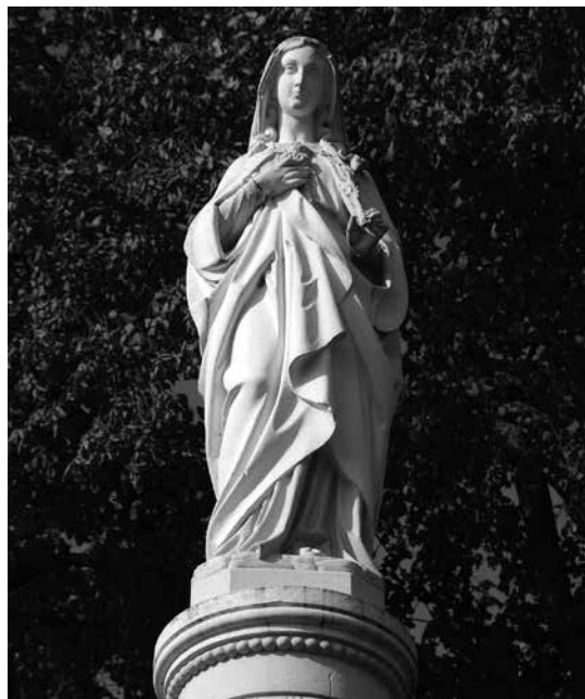
Il. 26. Kaława. Rzeźba Matki Boskiej.