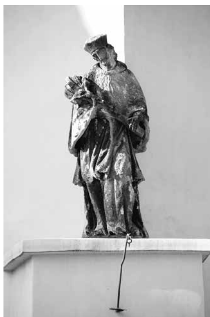
Il. 54. Nowe Miasteczko. Barokowa figura św. Jana Nepomucena.