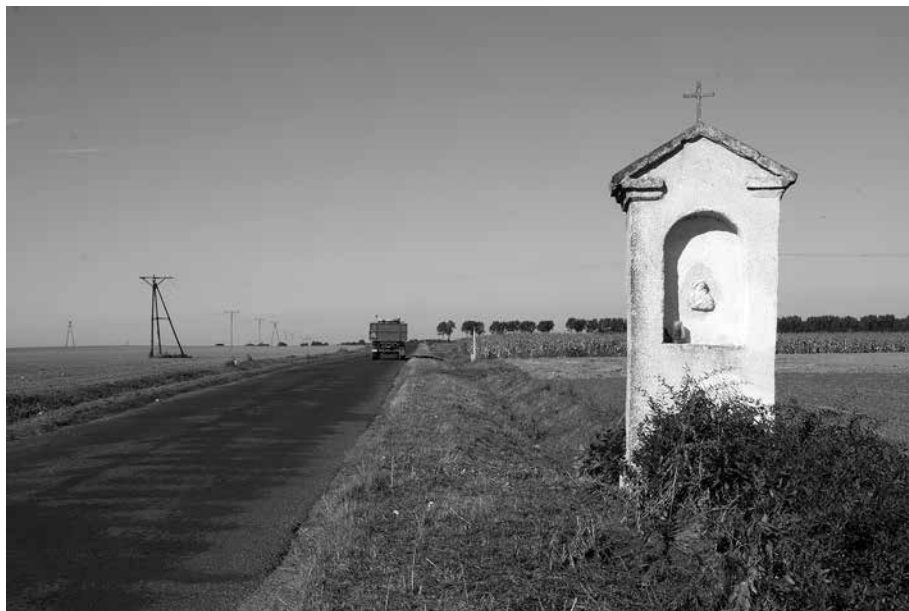
Il. 12. Zamysłów. Kapliczka przydrożna.