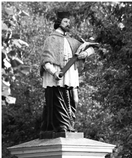
Il. 49. Klenica. Rzeźba św. Jana Nepomucena. Fot. K. Garbacz