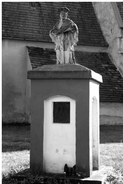
Il. 59. Stara Kopernia. Barokowa figura św. Jana Nepomucena, ustawiona przed kościołem filialnym pw. św. Jadwigi.