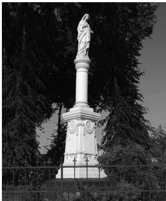
Il. 25. Kaława. Przydrożna figura Matki Boskiej na kolumnie.