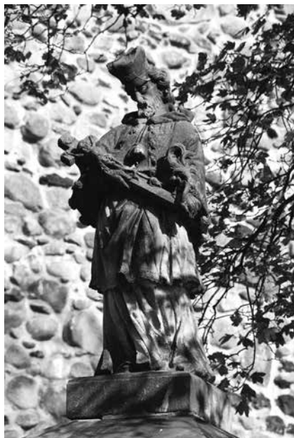
Il. 63. Świdnica. Barokowa rzeźba św. Jana Nepomucena, ustawiona na filarze bramy przed kościołem parafialnym pw. św. Marcina.