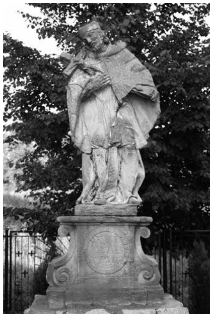
Il. 55. Nowogród Bobrzański. Figura św. Jana Nepomucena z 1739 r., stojąca obok kościoła parafialnego pw. Wniebowzięcia NMP.