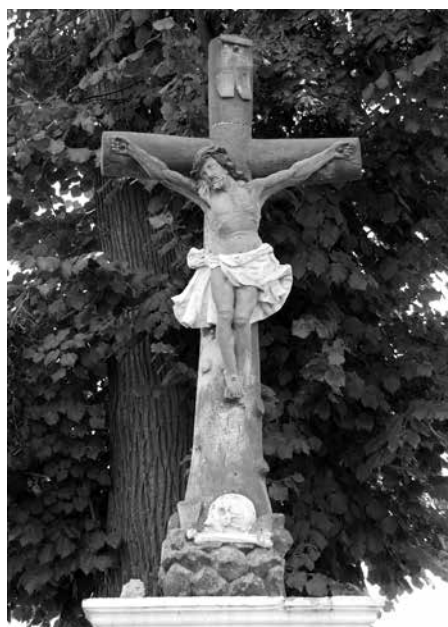
Il. 17. Niegosławice. Figura Chrystusa ukrzyżowanego z XIX w.