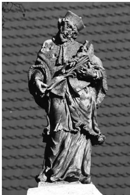
Il. 61. Stary Żagań. Rzeźba św. Jana Nepomucena.