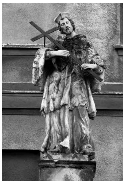
Il. 56. Otyń. Rzeźba św. Jana Nepomucena z 1770 r., stojąca obok kościoła pw. Podwyższenia Krzyża Świętego.