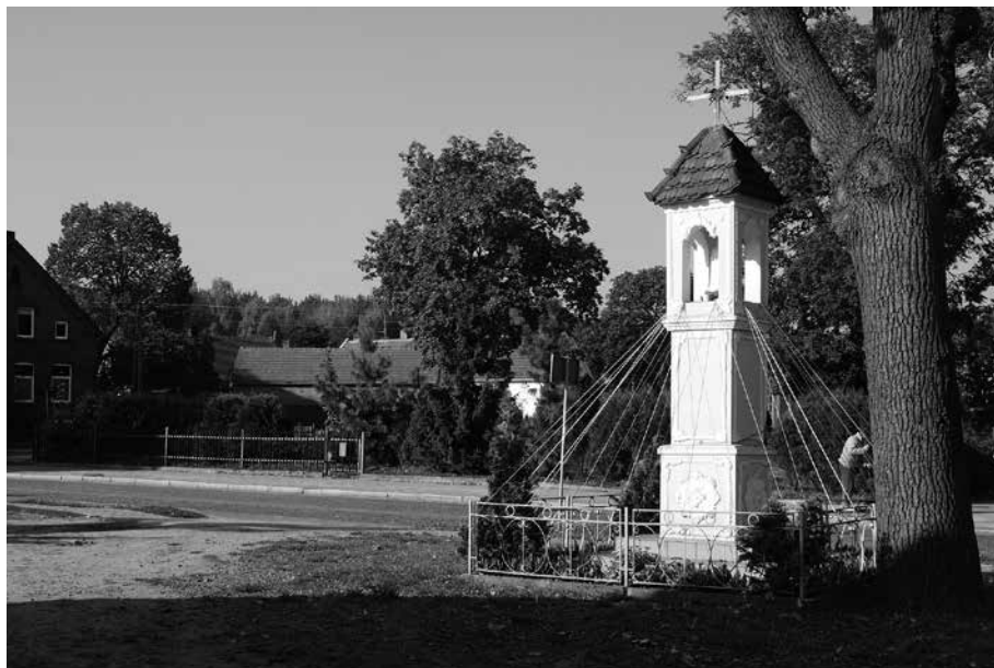
Il. 14. Zawada. Kapliczka przydrożna.