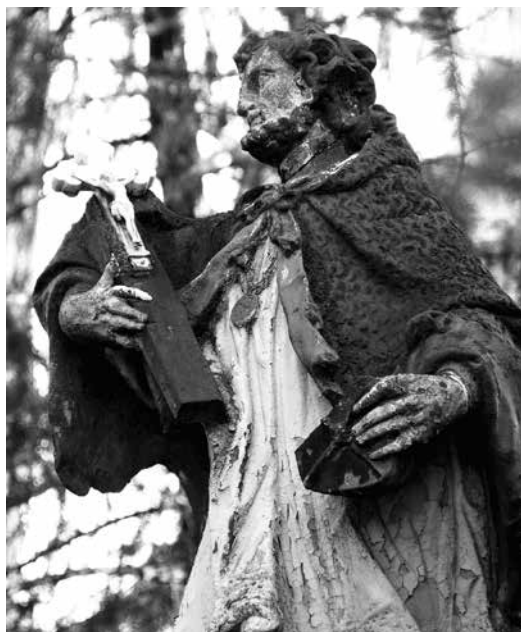
Il. 50. Kolsko. Barokowa figura św. Jana Nepomucena, stojąca przed kościołem parafialnym pw. Narodzenia św. Jana Chrzciciela. Fot. K. Garbacz