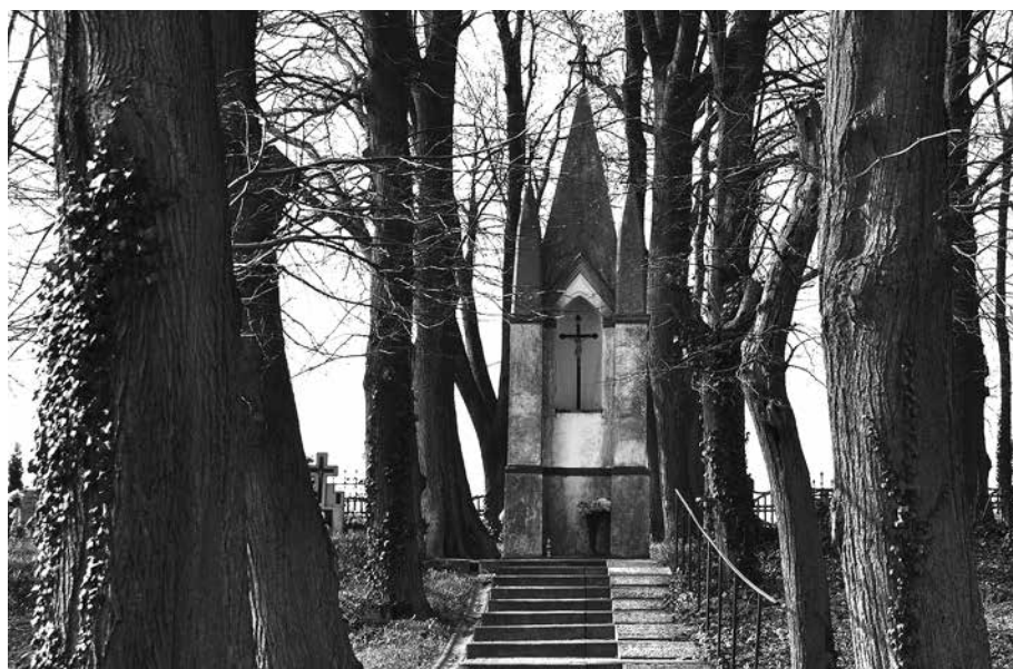
Il. 9. Sokola Dąbrowa. Kapliczka na cmentarzu.