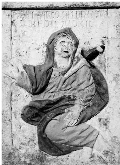
Il. 16. Łagowiec. Figura Chrystusa ukrzyżowanego z XVIII w. Matka Boska Bolesna przedstawiona na postumencie.