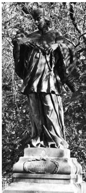
Il. 62. Szprotawa. Figura św. Jana Nepomucena, ustawiona przy moście na Bobrze.