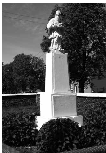
Il. 46. Grotów. Barokowa figura św. Jana Nepomucena na postumencie z początków XX w., ustawiona obok kościoła parafialnego pw. Narodzenia NMP.