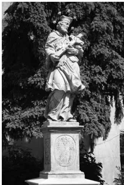
Il. 51. Koźuchów. Figura św. Jana Nepomucena z 1715 r., stojąca w pobliżu Bramy Krośnieńskiej.