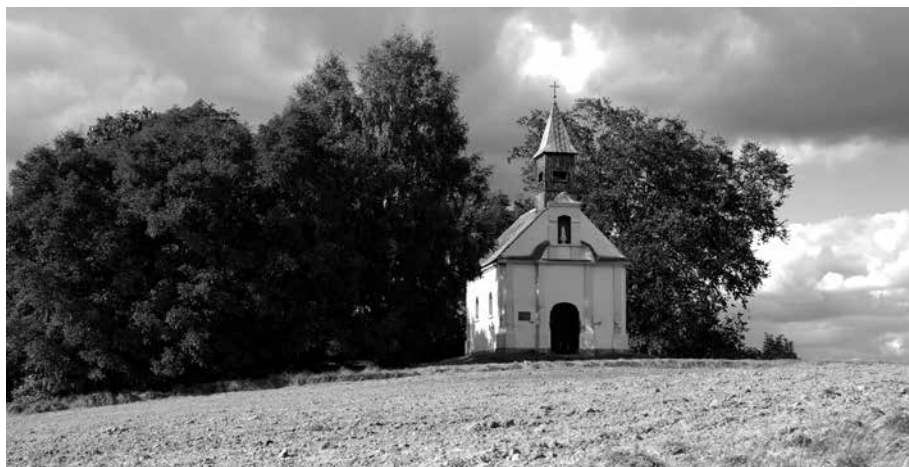
Il. 1. Rokitno – okolica. Kapliczka z 1758 r.

Główny specjalista w Oddziale Terenowym Narodowego Instytut Dziedzictwa w Zielonej Górze