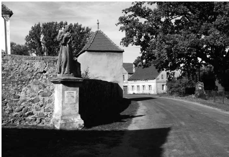
Il. 41. Broniszów. Figura św. Antoniego, stojąca przy kościele parafialnym pw. św. Anny.