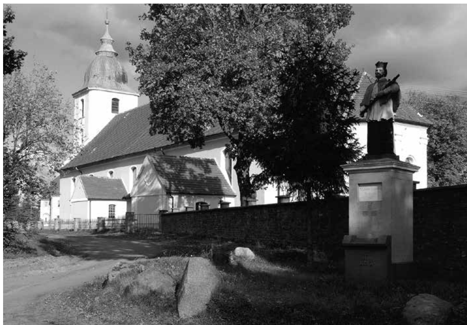
Il. 48. Klenica. Figura św. Jana Nepomucena. W tle kościół parafialny pw. Narodzenia NMP.