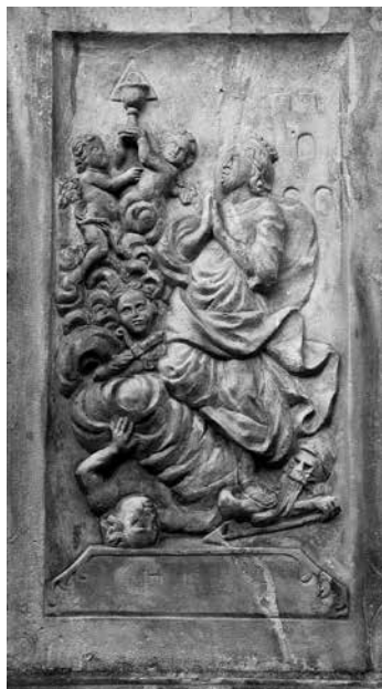
Il. 34-35. Żagań. Płaskorzeźby umieszczone na postumencie pod figurą Matki Boskiej Niepokalanie Poczętej.