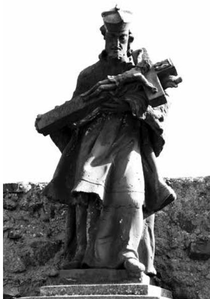
Il. 45. Broniszów. Rzeźba św. Jana Nepomucena, ustawiona przed kościołem parafialnym pw. św. Anny.