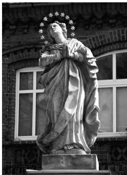
Il. 33. Żagań. Rzeźba Matki Boskiej Niepokalanie Poczętej.