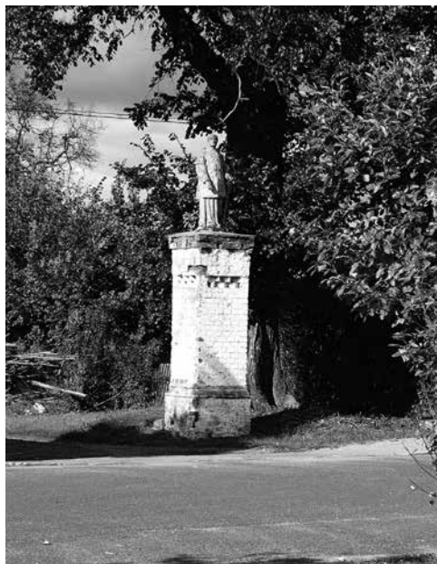
Il. 67. Goraj. Figura św. Wawrzyńca, stojąca obok kościoła parafialnego pw. Trójcy Świętej.