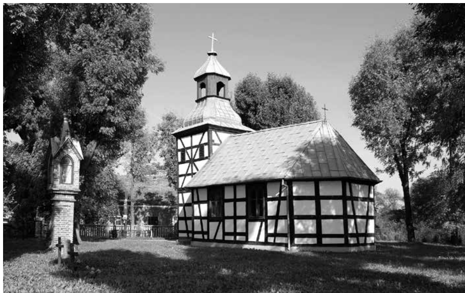
Il. 10. Święty Wojciech. Kapliczka przy kościele filialnym pw. św. Wojciecha.