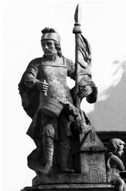
Il. 40. Nowa Sól. Barokowa figura św. Floriana, obecnie stojąca na pl. Floriana.