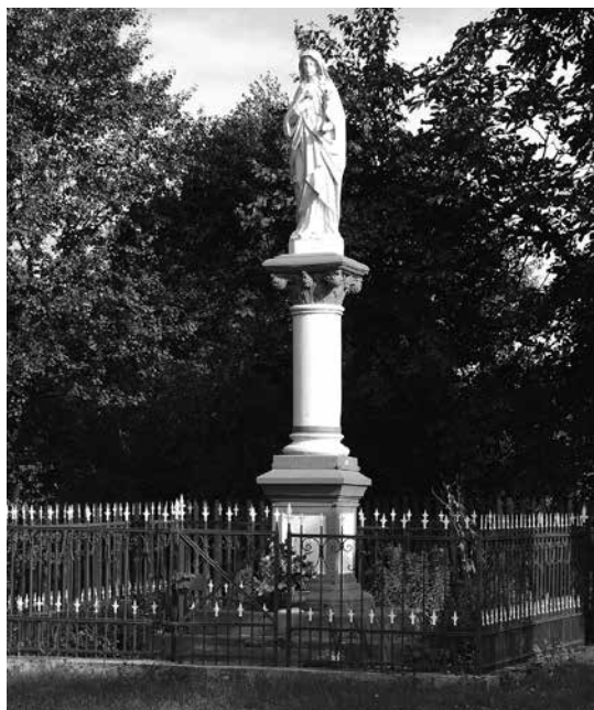
Il. 27. Nowa Wieś. Przydrożna figura Matki Boskiej na kolumnie.