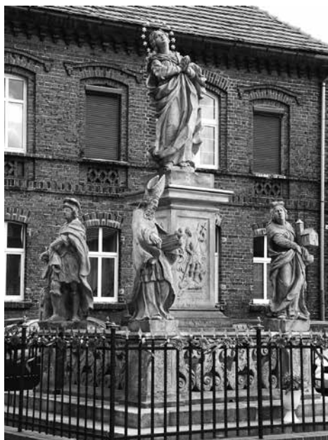
Il. 32. Żagań. Pomnik z lat 1709-1710, z centralną figurą Matki Boskiej Niepokalanie Poczętej, stojący przy kościele parafialnym pw. Wniebowzięcia NMP.