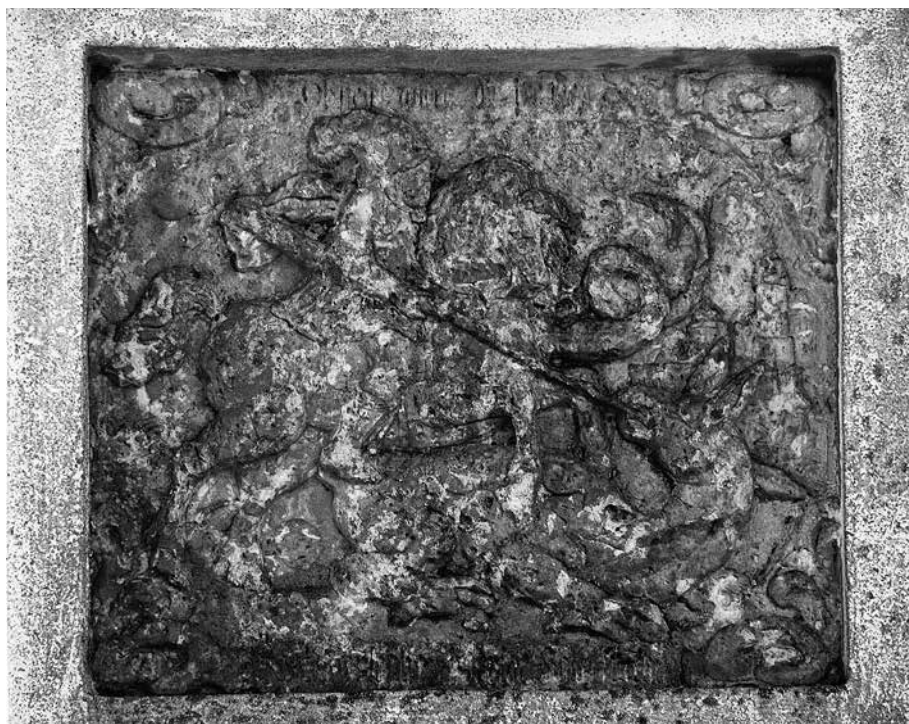
Il. 3. Miocin Dolny – Kozuchów. W płycinie scena przedstawiająca zabijanie smoka przez św. Jerzego.