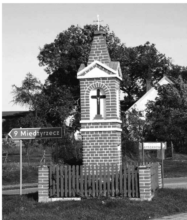
Il. 7. Wyszanowo. Kapliczka przydrożna.