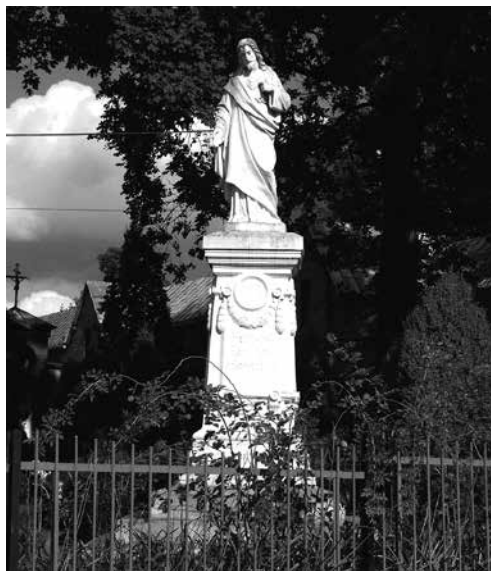
Il. 22. Rokitno. Figura Chrystusa z 1915 r. stojąca przed sanktuarium Matki Bożej Rokitniańskiej.