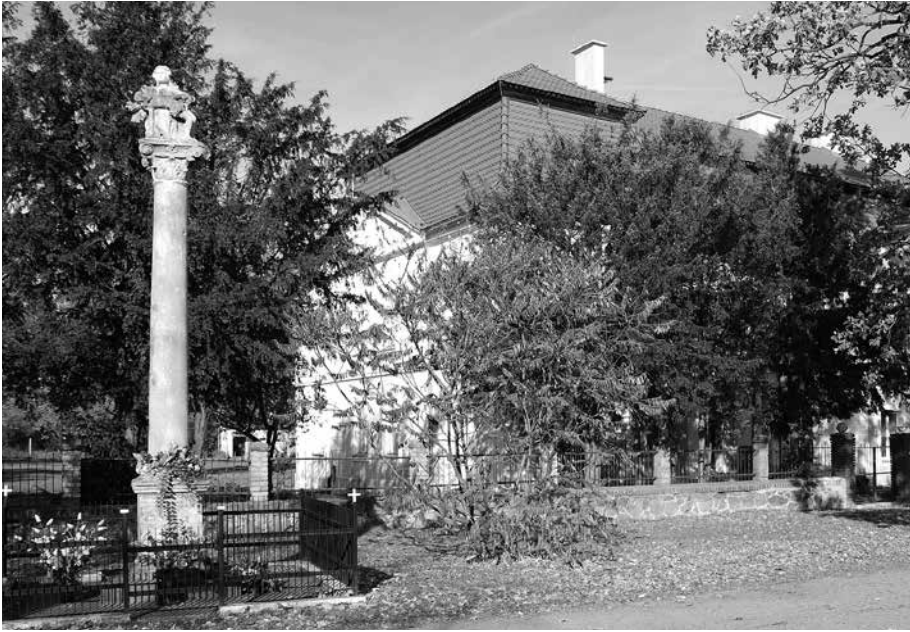
Il. 18. Jabłonów. Pieta z 1694 r. W tle dawny dwór augustianów.