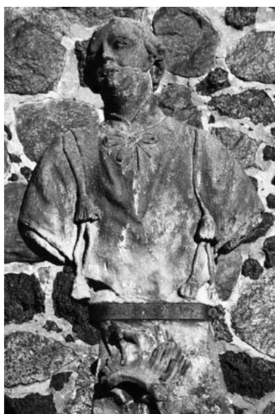
Il. 70. Ługi. Pomnik z 1784 r. poświęcony św. Wawrzyńcowi, stojący obok kościoła parafialnego pod wezwaniem świętego.