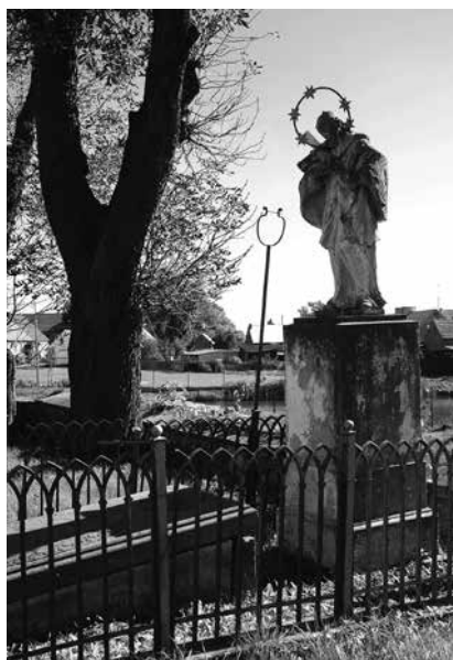
Il. 58. Sokola Dąbrowa. Figura św. Jana Nepomucena z 1867 r., ustawiona na cmentarzu przy kościele parafialnym pw. Wniebowzięcia NMP.