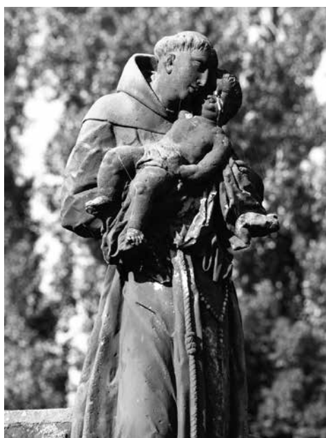
Il. 42. Broniszów. Rzeźba św. Antoniego z Dzieciątkiem.