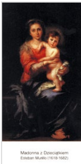
Madonna z Dzieciątkiem Esteban Murillo (1618-1682)