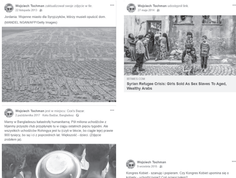
Rycina 4. Przykłady postów zamieszczanych przez Wojciecha Tochmana

uchodźców lub apel do sumień, co stwierdzono zwłaszcza w przypadku publikacji postów ze zdjęciami ofiar katastrof łodzi, którymi podróżowali migranci. Zdarzają się również komentarze konfrontacyjne, oceniające i oskarżające odnoszące się do działań różnych podmiotów, zwykle są to rządzący politycy – bez względu na przynależność partyjną.