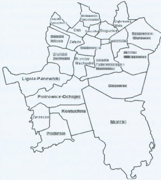
Rys. 1. Dzielnice Katowic