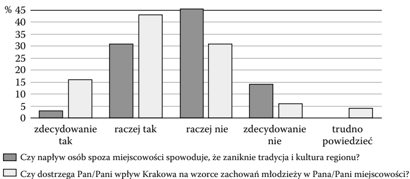
Rys. 3. Ocena wpływu wzorców miejskich na zachowanie tradycji regionu oraz na postawy młodzieży