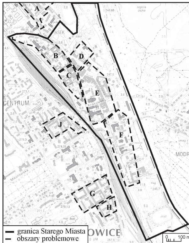
Rys. 2. Obszary problemowe w obrębie Starego Miasta

Ponadto ku końcowi zmierzają prace nad aktualizacją wspomnianego już uprzednio Miejskiego Programu Rewitalizacji, podczas których wyznaczono 11 obszarów problemowych w całym Mysłowicach. Spośród nich aż 5 znalazło się w granicach Starego Miasta ( Prace nad aktualizacją... 2014). W pierwszej kolejności do działań rewitalizacyjnych zakwalifikowano obszary B, C i F (rysunek 2), co również potwierdził przeprowadzony w ramach niniejszych badań audyt miejski. Uzyskane wyniki jednoznacznie wskazały, iż to właśnie rejon ul. Wałowej jest zdegradowany w najsilniejszym stopniu (obszary problemowe B i C). Swoistym uzupełnieniem prac nad aktualizacją Miejskie-