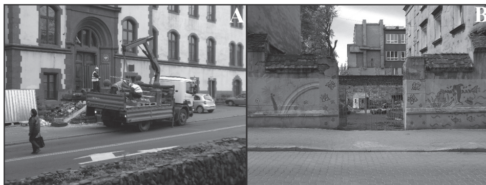
Fot. 3. Remont wejścia do Sądu Rejonowego (A) oraz odnowiony plac zabaw (B)

Ważną kwestię historycznych dzielnic stanowią zabytki, które również wpływają na odbiór przestrzeni, a w konsekwencji – ocenę jej jakości. W obrębie Starego Miasta zlokalizowanych jest 19 obiektów zabytkowych wpisanych do Rejestru Śląskiego Wo-