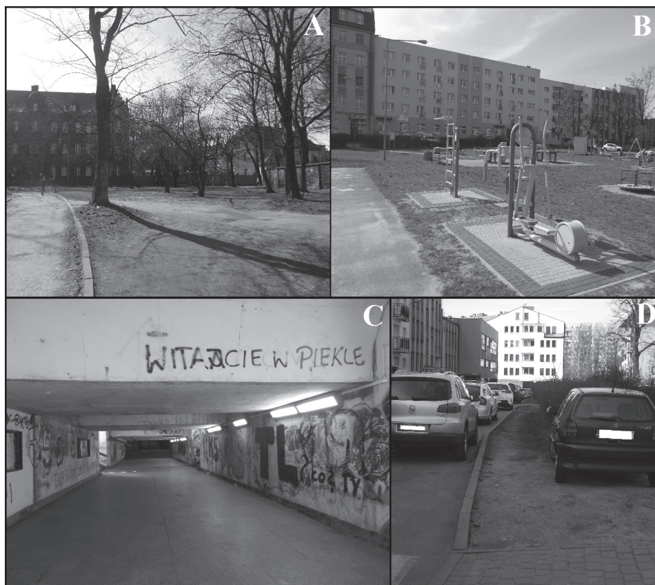
Fot. 2. Zaniedbany skwer (A), odnowiony plac zabaw (B), przejście podziemne (C) oraz wydeptana ścieżka (D)

Istotnych informacji o przestrzeni Starego Miasta dostarcza sporządzona mapa przedstawiająca syntetyczne wyniki zrealizowanego audytu miejskiego (rysunek 1A).