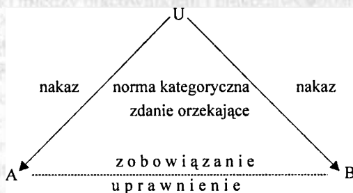
Rys. 1. Komunikowanie przekazu zawartego w przepisach normujących stosunki zobowiązaniowe

W tekst Kodeksu pracy wpisana jest intencja stanowienia i obowiązywania norm prawnych w zakresie stosunków zobowiązaniowych 5 . Akt stanowienia ma moc illokucyjną nakłaniania do posłuchu wobec ustanowionych norm, a zarazem moc perlokucyjną obowiązywania tych norm. Moc illokucyjna ustawy mieści się między prośbą a rozkazem; jako moc oddziaływania stanowczego jest bliższa rozkazowi. Przepisy kodeksu wiążą prawodawcę i pracownika w sposób stanowczy, toteż należy traktować je jako nakazy i argumenty na rzecz realizowania tych nakazów 6 . Zwroty dyspozycyjne ustawodawcy (U) zawierają atrybuty powinnościowe aktu stanowienia, których spełnienie jest obowiązkiem adresatów norm (A i B), zob. Rys. 1.: