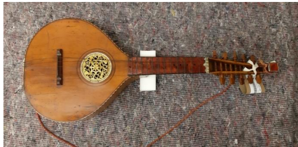
Fig. 1. An English guitar from the collection of the Victoria & Albert Museum in London.

It was a relatively small instrument with an average scale length of 42 cm, similar in appearance to the cittern and resembling the mandolin. It existed in many varieties – the most popular one had ten metal strings in six courses with tuning to open C 1 and, less frequently, A or G (which was more common in Poland). The range of the instrument was usually 2,5 octaves. Its neck was fitted with 12 to 19 brass frets, and the flat or convex body could be shaped like a pear, tear, fig, egg, cloud or bell. Holes for attaching the capo were often drilled in the neck of a guitar so that performers could easily change the key of pieces, for instance while accompanying a vocalist. More expensive instruments had numerous decorative elements in the form of veneers and inlays, and they were adorned with lavish materials such as ebony, mother-of-pearl or ivory. They also came with more precise tuning mechanisms and a range of additional accessories as well as labels or engraved trademarks of prominent workshops and luthiers.