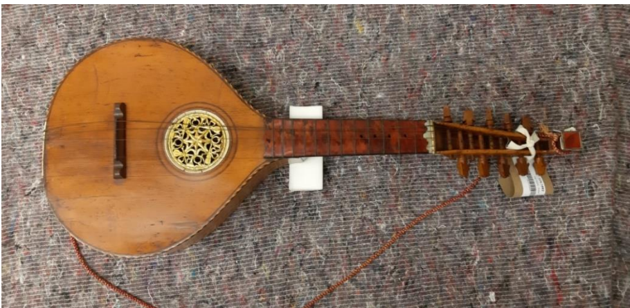
Ryc. 1. Gitara angielska ze zbiorów Victoria & Albert Museum w Londynie.

Był to instrument stosunkowo niewielkich rozmiarów, o średniej menzurze 42 cm, zbliżony wyglądem do cittern , przypominający mandolinę. Istniał w wielu odmianach – najpopularniejsza posiadała 10 metalowych strun, w sześciu chórach, o tzw. stroju otwartym C 1 , rzadziej występował też A i G (taki strój był zazwyczaj stosowany na terenach Polski). Skala obejmowała najczęściej 2,5 oktawy. Na szyjkę nabitych było od 12 do 19 mosiężnych progów, a płaskie lub wypukłe pudło rezonansowe mogło przyjmować kształty nawiązujące do gruszki, tzy, figi, jajka, chmury lub dzwonu. W szyjce często wiercono otwory służące do mocowania kapodastra, co pozwalało wykonawcom w łatwy sposób zmienić tonacje utworów, choćby podczas akompaniowania do śpiewu. Droższe instrumenty posiadały liczne elementy dekoracyjne w postaci fornirów i inkrustacji, ozdabiano je kosztownymi materiałami, jak heban, masa perłowa czy kość słoniowa. Miały też bardziej precyzyjne mechanizmy do strojenia, szereg dodatkowych akcesoriów oraz etykiety lub grawerowane znaki firmowe liczących się warsztatów i lutników.