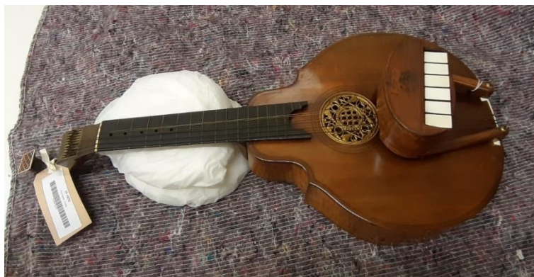
Fig. 2. An English guitar with a key box from the collection of the Victoria & Albert Museum in London.

The fierce competition on the market and the constant need to satisfy the consumerism-oriented society meant that the design of the guittar was undergoing rapid changes. Many improvements and innovations were introduced, for instance complex tuning mechanisms and even ... keys! The latter solution generated widespread enthusiasm among noble ladies, as the keys not only protected nails from being damaged by the metal strings, but also produced a slightly stronger sound, similar in timbre to the more and more popular pianoforte .