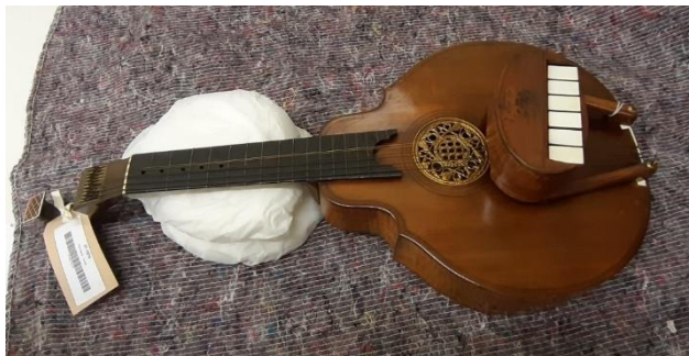
Ryc. 2. Gitara angielska z mechanizmem klawiszowym keybox , zbiory Victoria & Albert Museum w Londynie.

Ogromna konkurencja na rynku oraz ciągła potrzeba zaspokajania konsumpcyjnie nastawionego społeczeństwa sprawiły, że konstrukcja guittar ulegała dynamicznym zmianom. Stosowano wiele udogodnień i innowacji, jak skomplikowane mechanizmy do strojenia, a nawet... klawisze! To ostatnie rozwiązanie wywoływało powszechny entuzjazm wśród dam z arystokratycznych rodzin, gdyż klawisze nie tylko chroniły paznokcie przed uszkodzeniem przez metalowe struny, ale też dawały nieco mocniejszy dźwięk, zbliżony barwowo do zyskującego coraz większe zainteresowanie pianoforte .