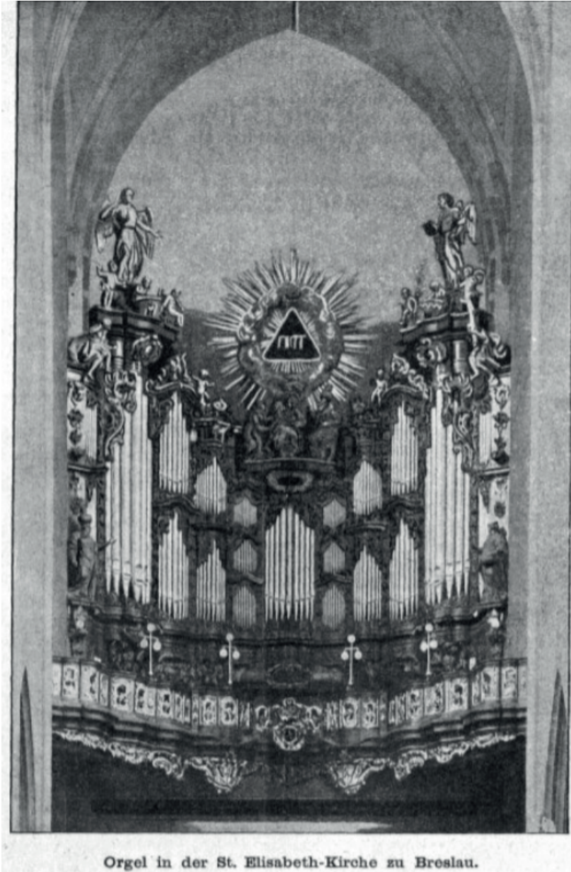
Orgel in der St. Elisabeth-Kirche zu Breslau.

Notka ta, także autorstwa pastora Herdtmanna, stanowi uzupełnienie poprzedniej, zwłaszcza w odniesieniu do podanej dyspozycji instrumentu. Zawiera ona ponadto najnowszą ilustrację prezentującą empore organową (fot. 2).