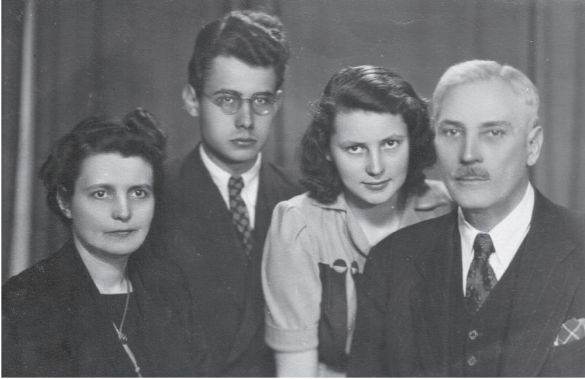
Z rodzicami i siostrą, Łódź 1948

tyniu. Moja Matka zdołała pod koniec grudnia 1939 r., po pierwszym ujęciu przy próbie nielegalnego przekroczenia granicy i jakimś „cudownym” zwolnieniu, przedostać się z dziećmi do Warszawy, gdzie rodzina się połączyła.