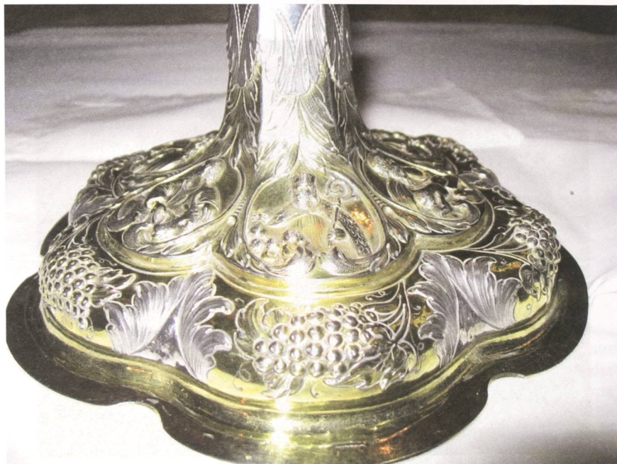
Il. 3. Stopa puszki z 1688 r. – w medalionie widoczna postać św. Mikołaja. Kościół parafialny w Kopernikach