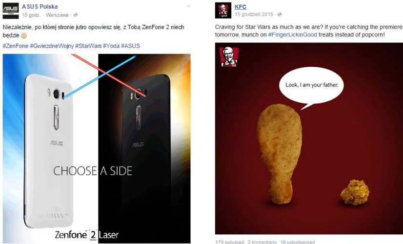
Rys. 2. Reakcje firmy ASUS oraz KFC na premierę kultowego filmu Star Wars