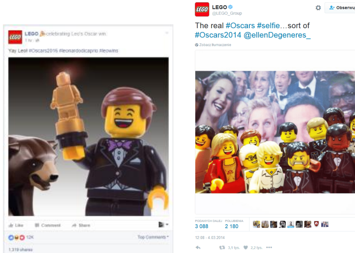
Rys. 1. Odpowiedź LEGO na zdobycie Oscara przez Leonardo DiCaprio oraz słynne selfie

tego typu wydarzenia jako bazę do tworzenia przekazów w real-time marketingu i budowania zainteresowania swoją marką. Przykładami może tu być gala rozdania Oscarów, na kanwie której stworzyła przekaz firma LEGO, czy też premiera filmu Star Wars , wykorzystana np. przez firmę ASUS czy KFC (por. rys. 1 i 2).