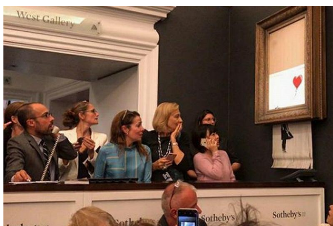
Rys. 3. Aukcja Dziewczynki z balonikiem ; obraz Banksy'ego zniszczony po licytacji

Za kopię muralu legendarnego twórcy anonimowa kobieta z Europy zapłaciła kwotę 1,04 mln funtów. Tuż po licytacji jednak uruchomiła się wprawiona w ramę niszcarka i dzieło uległo samozniszczeniu na oczach kupujących i koneserów sztuki (rys. 3).