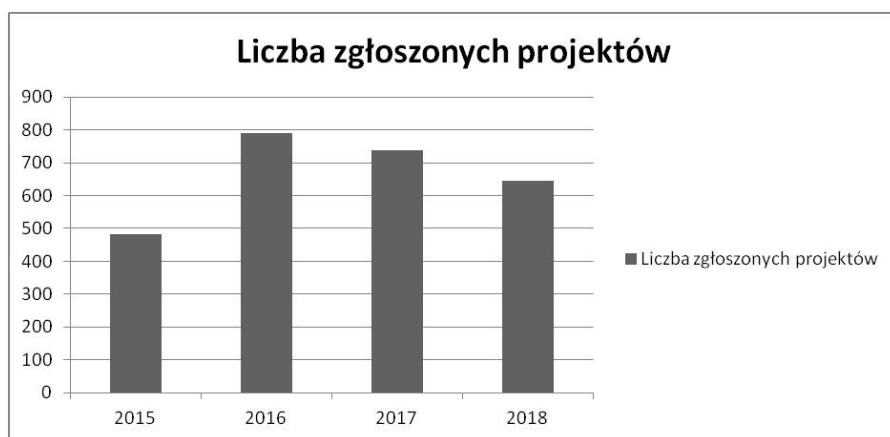
Rys. 2. Liczba zgłoszonych projektów w latach 2015-2018

Mimo rosnącej roli partycypacji społecznej w planowaniu miast zainteresowanie Wrocławskiem Budżetem Obywatelskim spada, co wynika z liczby zgłoszonych projektów (por. rys. 2) oraz liczby oddanych głosów (por. rys. 3).