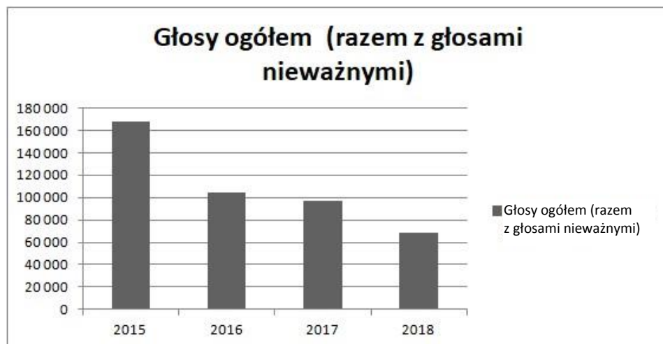
Rys. 3. Liczba oddanych głosów w latach 2015-2018

sów (z tym, że jeden musiał zostać oddany na projekt z kategorii „zabytki”) i mogły głosować osoby od 16. roku życia [www 12].