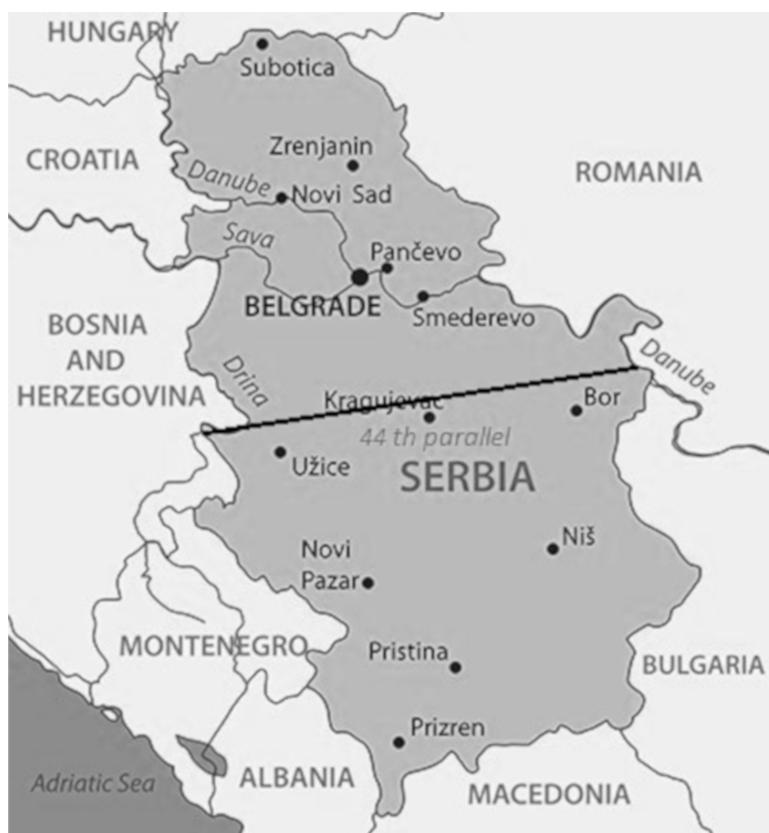
RYC. 1. OBSZAR PROWADZENIA OPERACJI „ALLIED FORCE” WZGLĘDEM 44 RÓWNOLEŻNIKA.