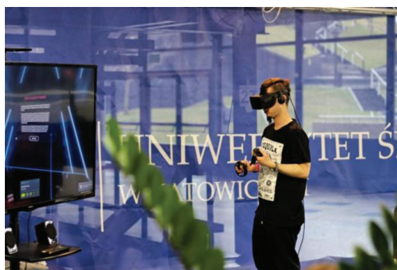
Fot. 2. Stanowisko Uniwersytetu Śląskiego

Drugą imprezą towarzyszącą był XI Salon Funduszy Europejskich (XXI), na którym prezentowano informacje na temat możliwości, jakie daje Unia Europejska; programu Erasmus+; jak odbyć staż lub praktyki w jednej z unijnych instytucji; jak napisać europejskie CV. Dodatkową atrakcją były warsztaty „Bezpieczeństwo w sieci. Jak skutecznie chronić się w Internecie?”.