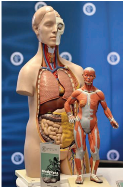
Fot. 4. Model anatomii człowieka, stanowisko Śląskiego Uniwersytetu Medycznego

W czasie Targów na pytania zwiedzających odpowiadali także przedstawiciele Wojewódzkiego Urzędu Pracy w Katowicach oraz Punktu Informacyjnego Funduszy Europejskich w Katowicach. Bardzo istotna była obecność przedstawicieli Projektu Przeciwdziałania Handlowi Ludźmi, dzięki któremu młodzi ludzie mogli dowiedzieć się więcej o tym przerażającym procederze oraz jak się przed nim ustrzec podczas przeglądania ofert pracy wakacyjnej za granicą.