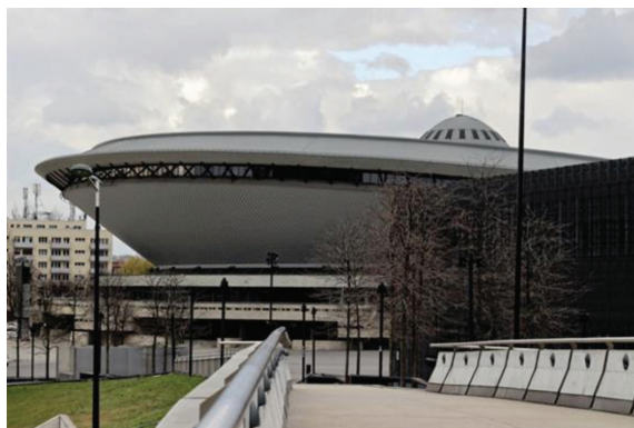
Fot. 1. Hala Widowiskowo-Sportowa Spodek