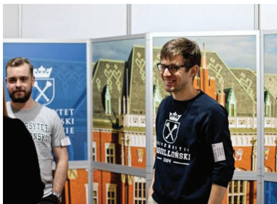
Fot. 3. Stanowisko Uniwersytetu Jagiellońskiego