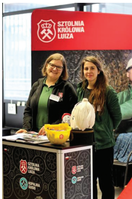
Fot. 5. Przedstawicielki Sztolni Królowa Luiza

W ofercie Targów nie zabrakło również propozycji dla młodszych uczestników – wśród wystawców pojawili się przedstawiciele Śląskiego Ogrodu Zoologicznego, Muzeum Górnictwa Węglowego w Zabrze i Energylandii. Wszystkie te miejsca, kojarzone w pierwszej kolejności z rozrywką, mają w swojej ofercie także elementy edukacyjne, których zakres jest dostosowany do potrzeb zwiedzających.