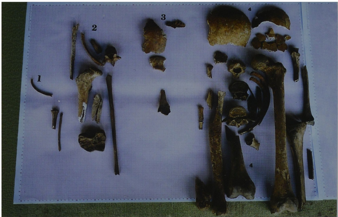
Fot. 1 Kości ludzkie zabezpieczone 20 września 2006 roku

Photo 1. Die am 20. September 2006 gesicherten, menschlichen Knochen