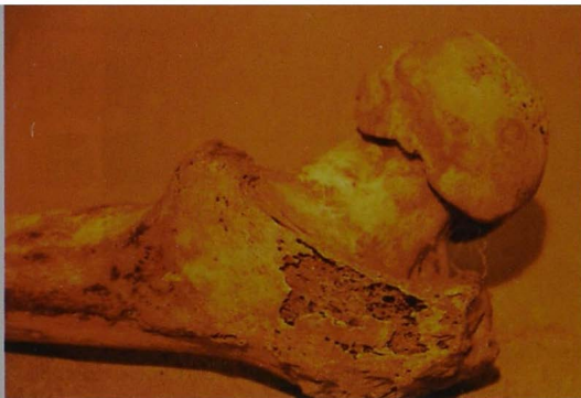
Ryc.3 Koniec bliższy prawej kości udowej, porowaty, i zniekształcony grzybowatymi wyrostkami Abb. 3. Das dem rechten Oberschenkelbein nähere Ende, porig und deformiert durch pilzförmigen Auswuchs