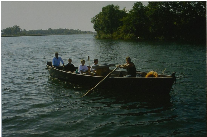
Ryc. 3 Chrzcielnica w drodze na "Pola Lednickie"