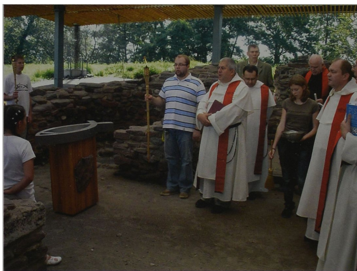
Ryc. 2 Uroczystości w lednickim baptyserium Abb. 2. Die Feierlichkeiten im Lednizer Baptisterium