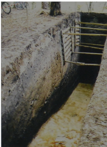
Ryc. 3 Wykop IA i IB. Zewnętrzny skłón wału obronnego grodu po eksploracji