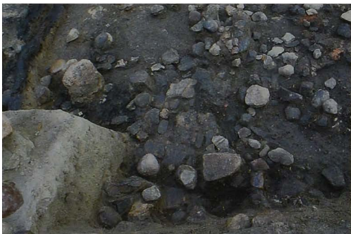
Ryc. 6 Wykop IIA . Południowo zachodnie naroże budynku 2. Pozostałości pieca kopułowego