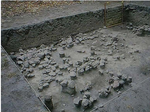
Ryc. 4 Wykop II D. Kamienne rumowisko - budynek 1.