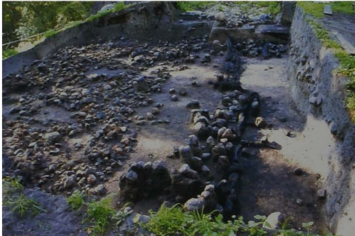
Ryc. 5 Wykop IIA i IIB. Relikty budynku 2. Widok od północy