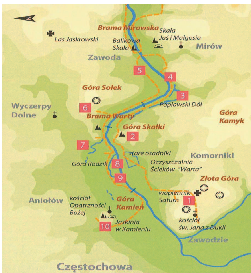
Ryc. 2. Plan ścieżki w dolinie Warty na odcinku Częstochowa – Mirów

Kilka słów należy poświęcić także drugiemu odcinkowi: Mirów – Jaskrów, ponieważ swój początek ma jeszcze w granicach Częstochowy. Na uwagę zasługuje Brama Mirowska i ośrodek jezdziecki TKKF „Pegaz”, w okolicy którego mieści się uroczysko Gąszczyk. Wchodzi ono w skład wzgórze, które określa się nazwą Przeprośna Górka 13 (zob. ryc. 2).