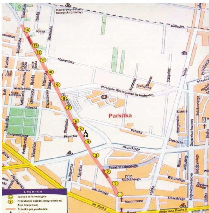
Ryc. 1. Aleja Brzozowa – plan przyrodniczej ścieżki dydaktycznej

Kolejną przyrodniczą ścieżką dydaktyczną w Częstochowie, znajdującą się w dzielnicy Parkitka (przy ul. Białskiej), jest Aleja Brzozowa. Ścieżka ma ok. 2,5 km długości. Jej początek znajduje się u zbiegu ul. Białskiej i ul. Sikorskiego (początek wyznacza tablica informacyjna). Ostatnia z tablic edukacyjnych – 14 – mieści się przy skrzyżowaniu ul. Białskiej z ul. Zakopiańską. Ścieżkę zaprojektowano w celu rozpropagowania wśród dzieci, młodzieży, ale również i dorosłych, walorów przyrodniczych i krajobrazowych ww. Alei Brzozowej.