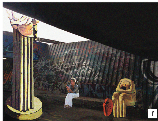
II. 2. Wrocław w kolażach autorstwa:

a) Oskara Będkowskiego, b) Natalii Śmiady, c) Krzysztofa Gorczakowskiego, d) Natalii Śmiady, e) Margarety Szejtkowskiej, f) Pawła Floryna