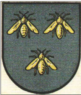
Ryc. 5. Herb Zduńskiej Woli

w podobnej sprawie (herb Konstątnowa Łódzkiego 31 ) można wnioskować, iż eksperci z Warszawy mogli zasugerować radnym Zduńskiej Woli, aby ci zgodzili się zredukować znak miasta do jednego herbu (Prawdzic Złotnickich) lub – co z uwagi na fascynację ówczesnych ekspertów heraldycznych XIX-wiecznym Albumem herbów miast Królestwa Polskiego 32 – mogli postulować wykorzystanie trzech pszczoł do zbudowania godła miejskiego Zduńskiej Woli. Hipotezę na temat ewentualnego promowania już w latach 30. XX w. trzech pszczoł na błękitnym polu, jako poprawnego herbu Zduńskiej Woli, wzmacnia dowód w postaci ustaleń Mariana Gumowskiego, spopularyzowanych w 1930–1932 r. na kartach Herbarza Polski 33 . Gumowski utrzymywał, że herbem Zduńskiej Woli powinny być pszczoły z Albumu herbów miast Królestwa Polskiego z połowy XIX w.