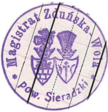
Ryc. 2. Pieczęć Magistratu Zduńskiej Woli (okres II Rzeczypospolitej)

herbu Ostoja 17 . Współczesny herb miejski opracowany został na wzór wyobrażenia z pieczęci magistrackich Zduńskiej Woli z okresu poprzedzającego odzyskanie II Niepodległości (1915–1918) 18 oraz z lat II Rzeczypospolitej (1918–1939) 19 (ryc. 2). Symbol międzywojennego samorządu Zduńskiej Woli występował także na pieczęciach urzędów i instytucji związanych z miastem. Na przykład z 1920 r. pochodzi odcisk pieczęci Urzędnika Stanu Cywilnego przy Magistracie Zduńskiej Woli 20 . Herb miasta (ukształtowany w okresie I wojny światowej) wykorzystywany był w Zduńskiej Woli także w pierwszych latach po zakończeniu II wojny światowej (np. w 1946 r.). Przypuszczam, że do 1947 r. w kancelarii miejskiej Zduńskiej Woli posługiwano się stemplami wykonanymi w okresie II Rzeczypospolitej, a nie nowymi tłokami przygotowanymi po styczniu 1945 r. Od 1947 r. dokumenty zduńskowolskie (np. Miejskiej Rady Narodowej w Zduńskiej Woli) pieczętowane były stemplami z wyobrażeniem niekoronowanego orła białego.