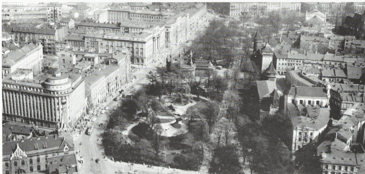
3. Widok w kierunku Barbakanu.

a od początku lat dwudziestych na szerszą skalę. W 1930 r. 2 Pułk Lotniczy w Krakowie wykonał „ prace foto dla celów kartograficznych, zyskując sobie pełne uznanie Wojskowego Instytutu Geograficznego ” 9 . Dość dużo zdjęć lotniczych opublikowano jeszcze przed wojną w czasopismach 10 , folderach 11 , książkach 12 , a także w formie kartek pocztowych (dochód ze sprzedaży niektórych z nich był przeznaczony w części lub całości na cele LOPP 13 . Niektóre natomiast były pu-