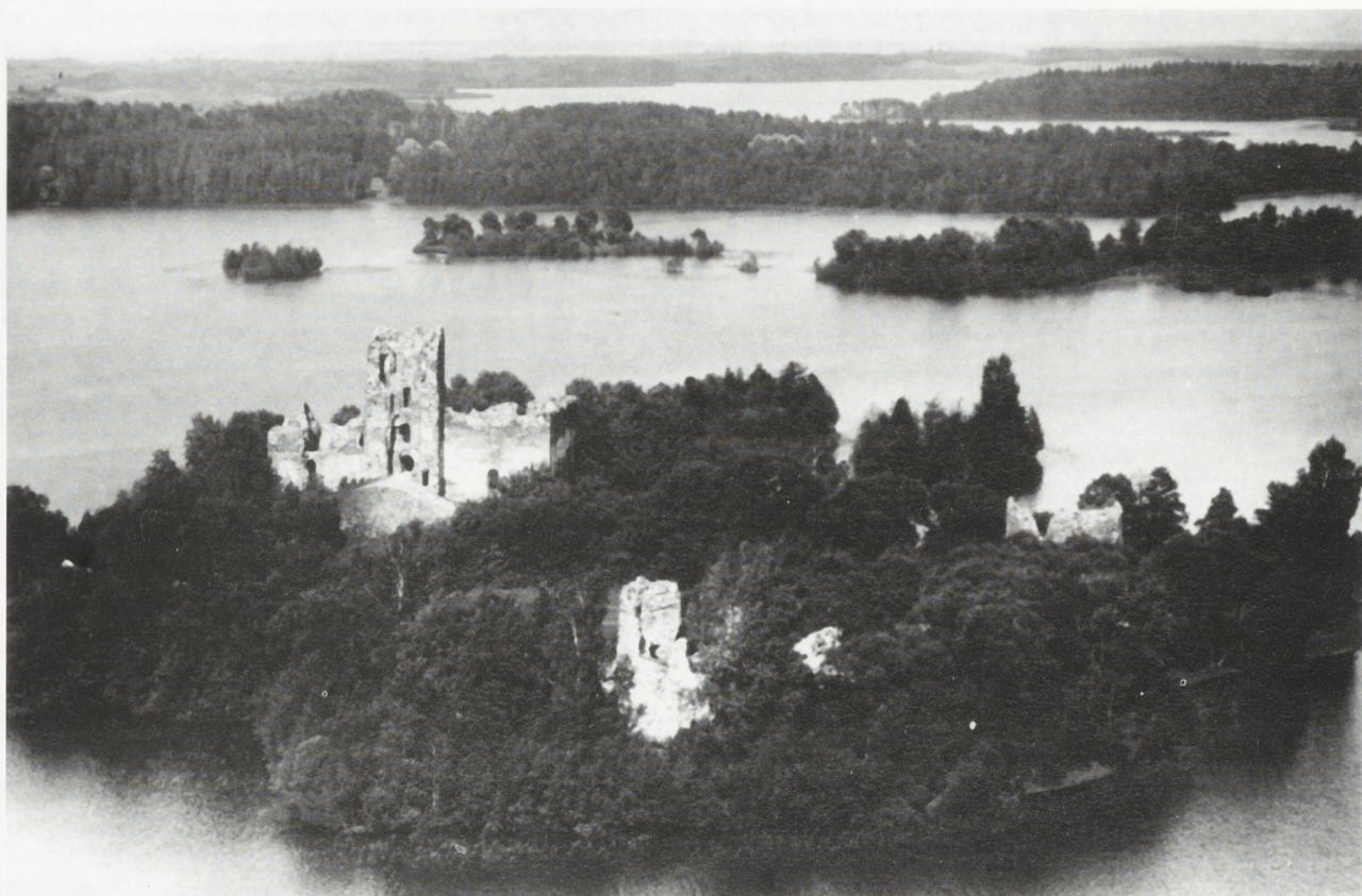
6. Troki, ruiny zamku.