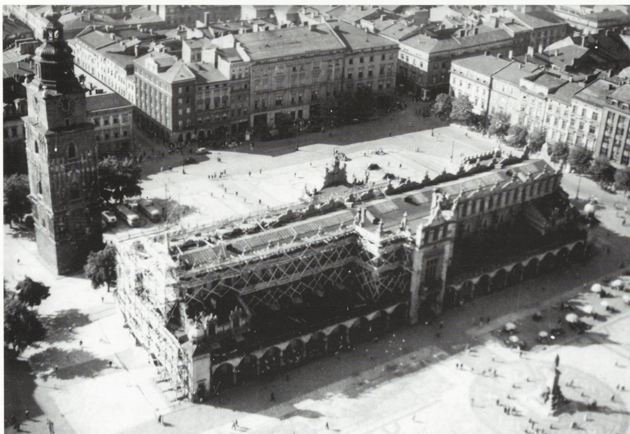
5. To samo miejsce już po II wojnie światowej. Odwach wyburzono, stoi budynek „Feniksa”, zniknęły tory tramwajowe, podobnie jak i pacholki wokół pomnika Mickiewicza i zieleni rynkowa, za to lepiej prezentuje się bruk Rynku Głównego. Sukiennice w trakcie prac konserwatorskich. Zbiory PSOZ w Krakowie. Fot. Z. Siemaszko dla ODZ w Warszawie