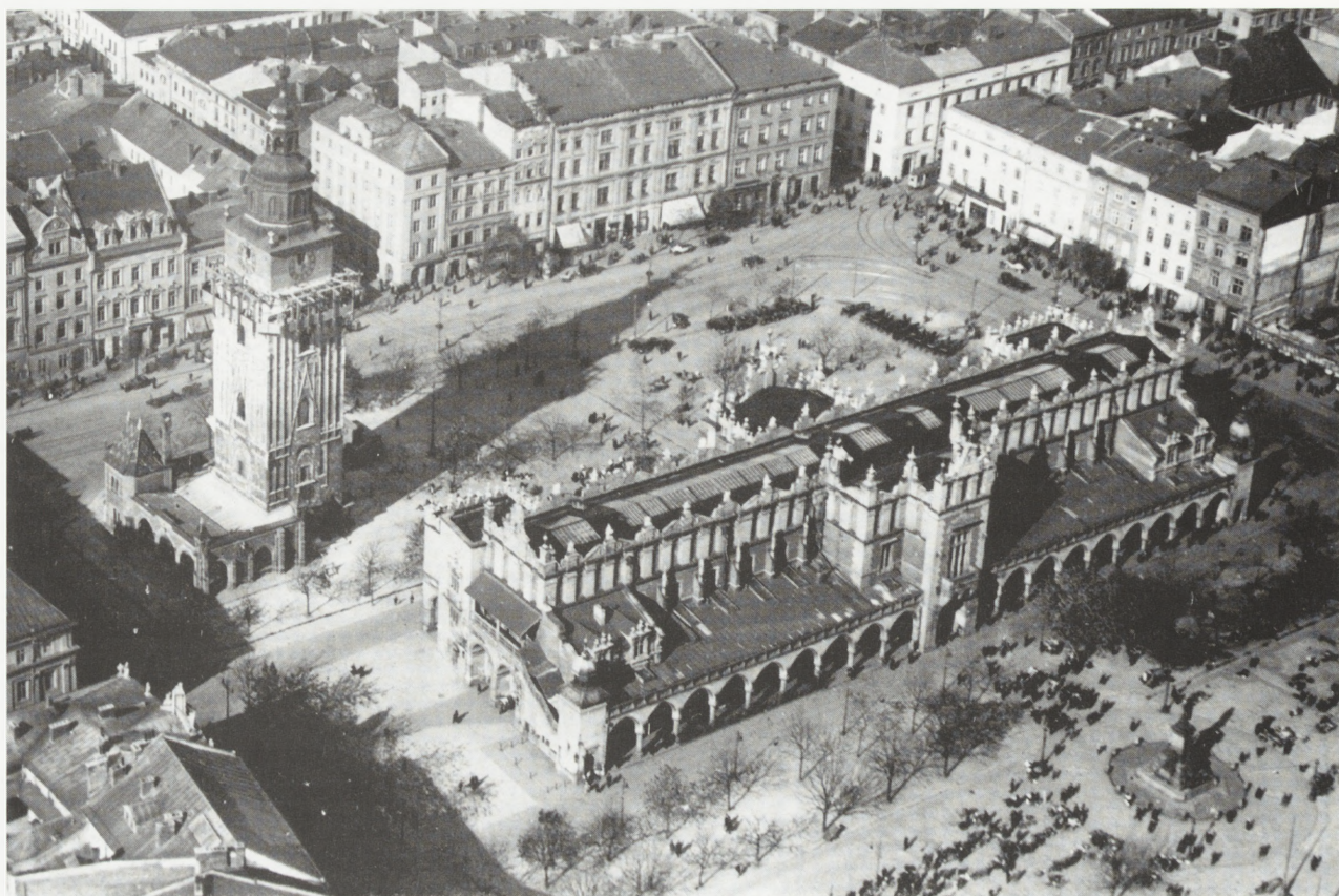
4. Kraków, Rynek Główny. Wieża Ratuszowa z dobudowanym neogotyckim odwachem, po prawej stronie ogrodzony teren po wyburzonej kamienicy — wkrótce stanie tutaj kontrowersyjny budynek „Feniksa”. Charakterystyczna zielen i układ torów tramwajowych, pomnik Mickiewicza ogrodzony „pacholkami”. Fotografię wykonał 2 Pułk Lotniczy w Krakowie przed 1929 r., fot. prawdopodobnie S. Meysenhälter; była wydana przed II wojną światową w formie pocztówki. Wł. P. Dobosz, repr. T. Kalarus