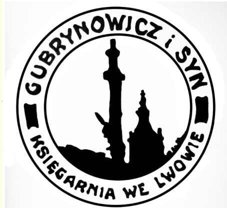
Il. 6. Odrys sygnetu Księgarni Gubrynowicz i Syn.