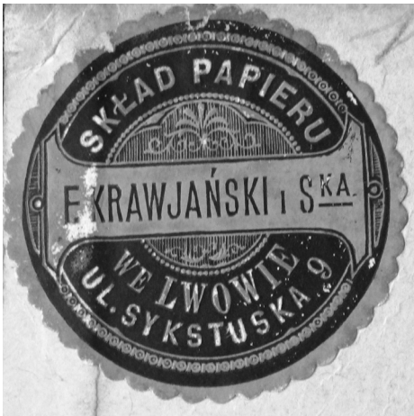
II. 1. Nalepka proveniencyjna z KK