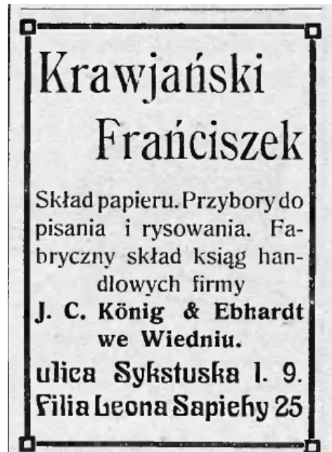
II. 2. [Reklama Krawjański Franciszek].