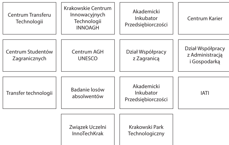
Rysunek 1. Ekonomiczne aspekty społecznej odpowiedzialności AGH

jący społeczną odpowiedzialność w aspekcie ekonomicznym przedstawiono na rysunku 1.