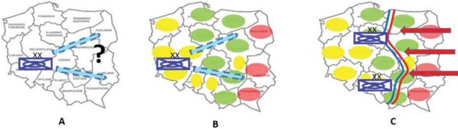
Ryc. 2. Działania wojsk operacyjnych