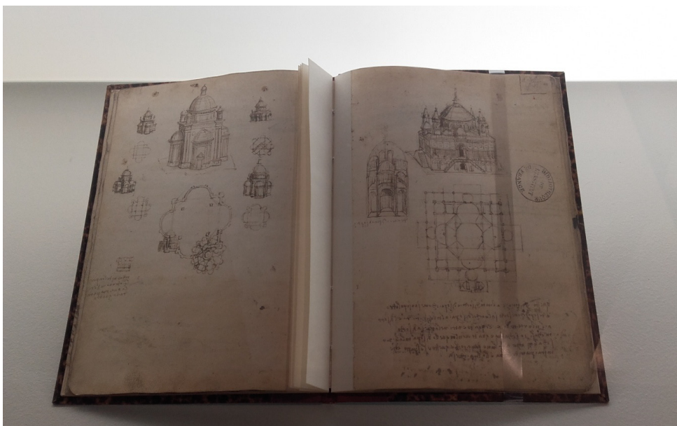
II. 6. Kodeks Ashburnham (ze zbiorów: Institute de France, Paryż). Fot. M. Kycler