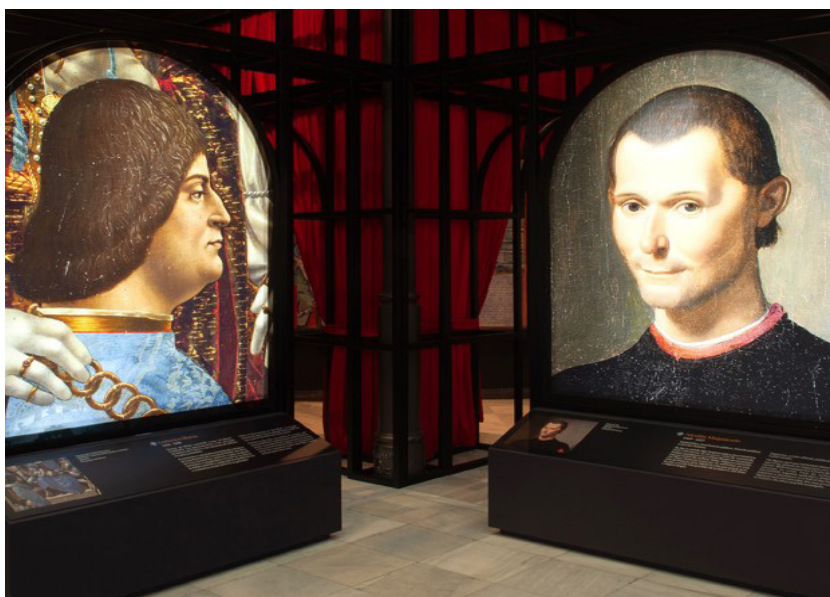
II. 3 i 4. Fragmenty ekspozycji w Pałacu Alhajas (parter).