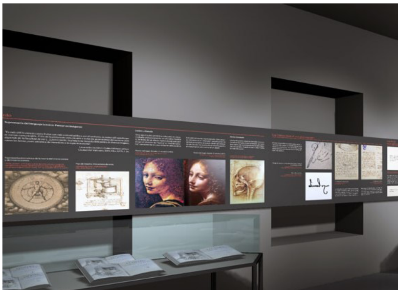
II. 1 i 2. Fragmenty ekspozycji w Bibliotece Narodowej.