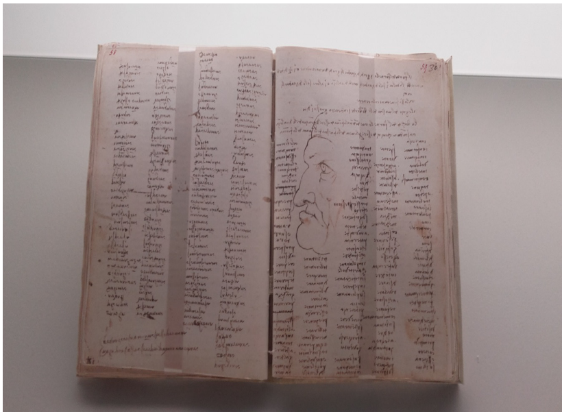
II. 5. Kodeks Trivulziów (ze zbiorów: Biblioteca Trivulziana, Mediolan).

Większość spośród eksponowanych szkiców to obliczenia, studia i projekty techniczne różnego rodzaju dźwigni, wsporników, korb i mechanizmów zębatkowych, a także innowacyjnych maszyn i urządzeń. Łączy je wspólna cecha – badanie wszelkich zjawisk natury oraz dążenie do zrozumienia zasady, która łączy rozwiązanie zagadki świata. Twórcy wystawy dołożyli starań, aby część z wynalazków „ożywić” poprzez zamontowanie instalacji audio-