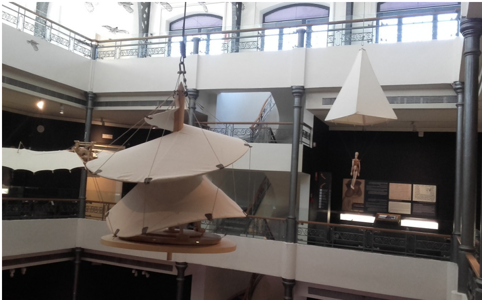
II. 7. Lotnia, helikopter i spadochron według projektu Leonarda.