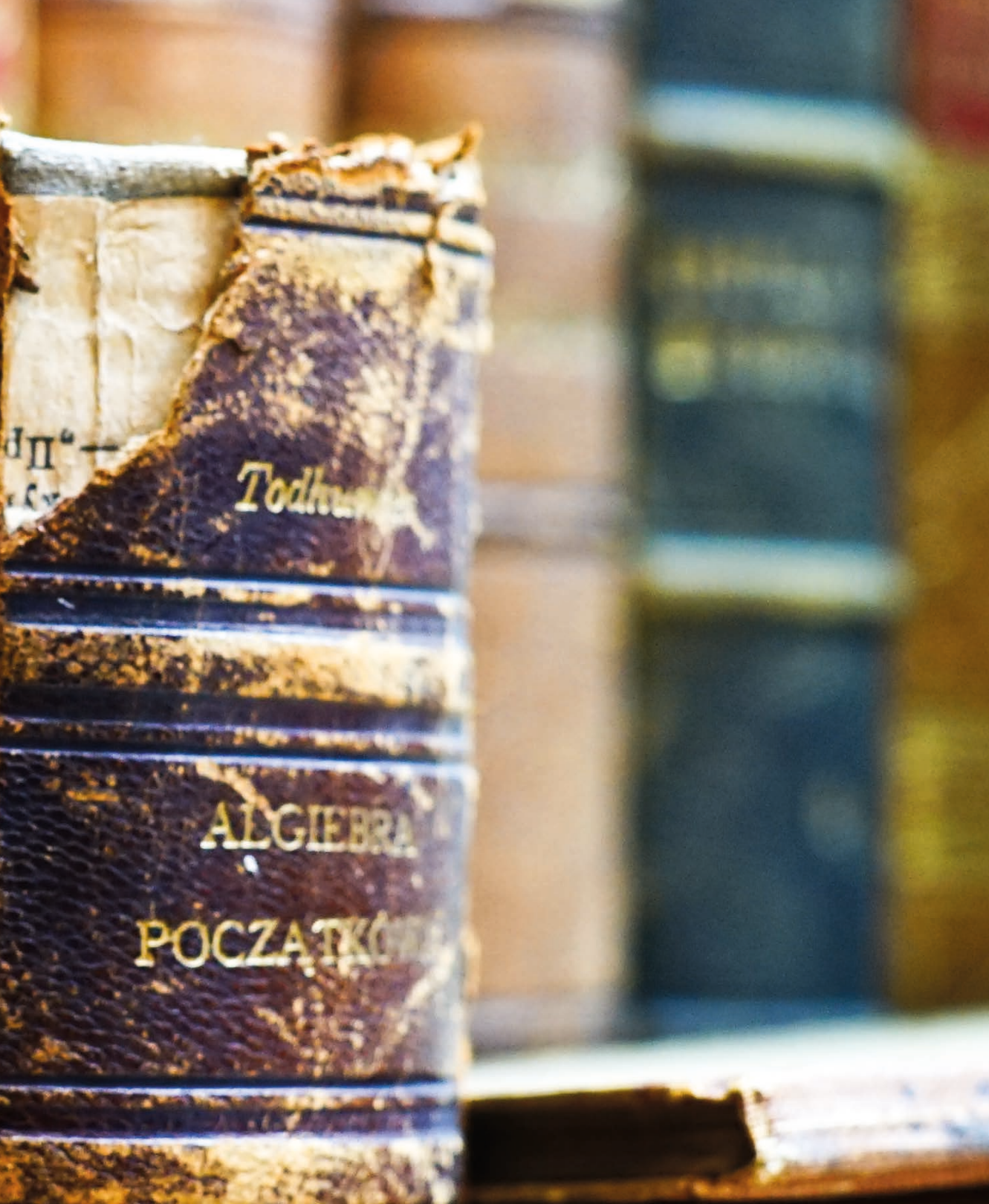
Zdj. 6. Fragment ekspozycji „Najstarsze zbiory Muzeum Podręcznika” — Algebra podług Lacroix na szkoły wojewodzkie , Warszawa, 1818; Isaac Todhunter, Algebra początkowa , Warszawa, 1890.