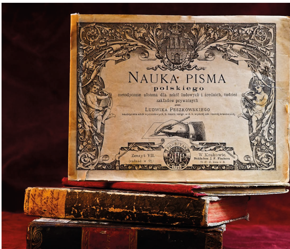
Zdj. 10. Nauka pisma polskiego: metodycznie ułożona dla szkół ludowych i średnich, tudzież zakładów prywatnych . Z. 7, [ułożona] przez Ludwika Peszkowskiego, Kraków, 1884.