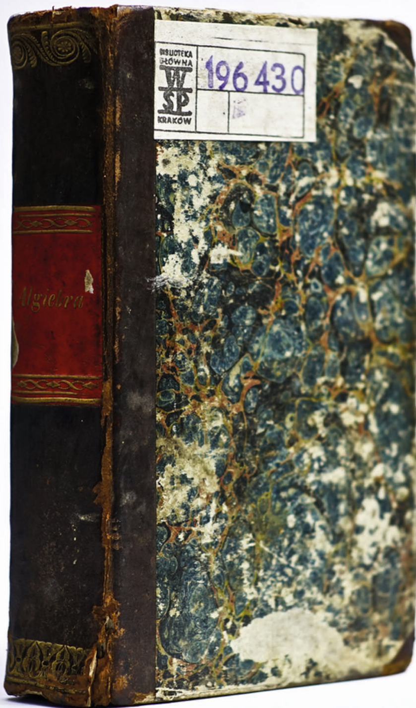
Zdj. 1. Algèbra podług Lacroix na szkoły woiewodzkie, Warszawa, 1818.