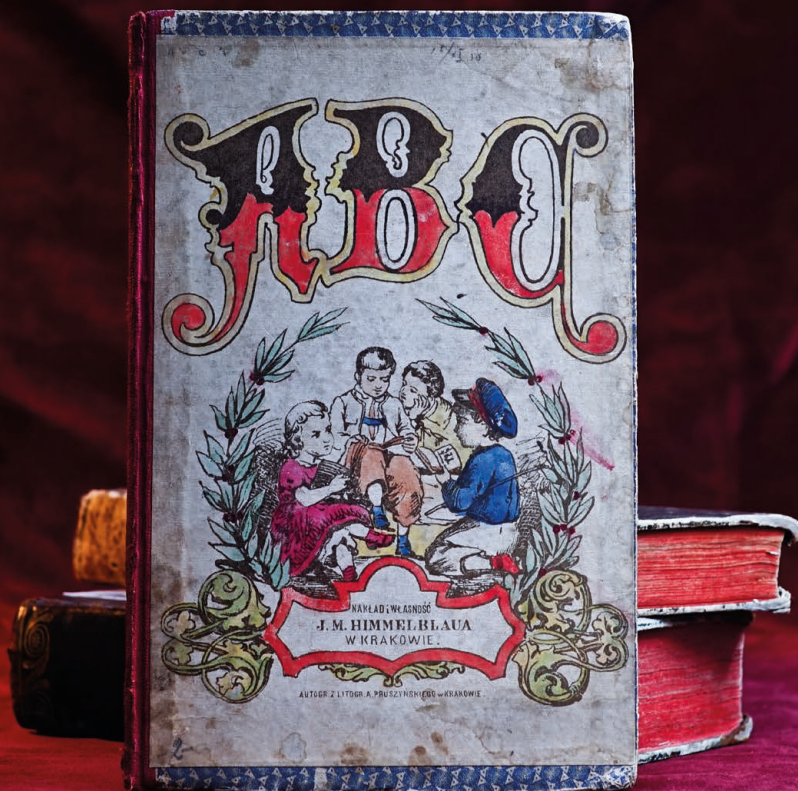
Zdj. 9. Fragment ekspozycji „Najstarsze zbiory Muzeum Podręcznika” — ABC w 24 kolorowanych obrazkach, królów polskich i sławnych ludzi , Kraków, 1878.