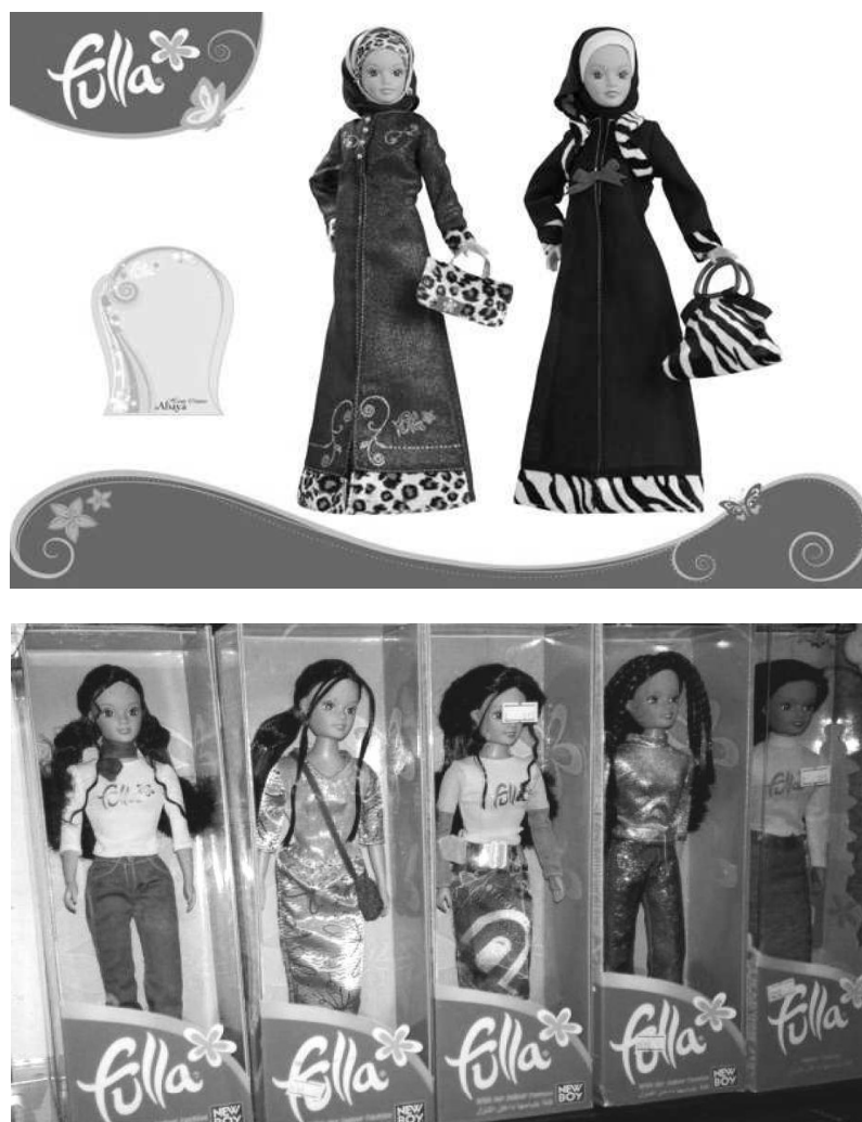
Fotografia 3,4. Lalki Fulla w różnych odsłonach

Źródło: https://www.alibaba.com/showroom/fulla-doll.html [dostęp: 27.01.2017].