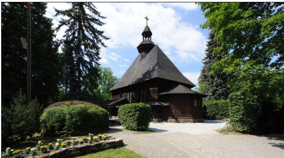
Ryc. 3. Kaplica prezydencka w Spale (stan obecny)

wojskowych generał Władysław Sikorski. Wówczas pałac myśliwski poddano niezbędnym remontom, wyburzono też częściowo budynki koszar kozackich i uporządkowano park.