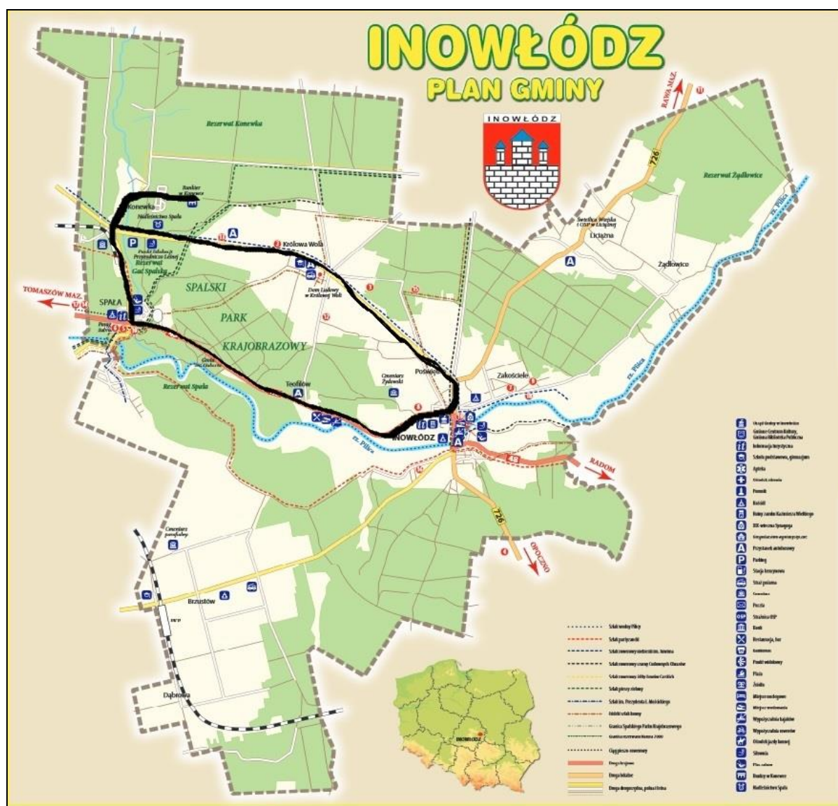
Ryc. 8. Schematyczny plan gminy Inowłódz z zaznaczoną planowaną trasą pieszo-rowerową Źródło: Opracowanie własne na planie z Informatora gminy Inowłódz (2014).

której początki sięgają wczesnego średniowiecza. Wśród wielu interesujących i historycznie cennych zabytków można wymienić m.in.: romański kościół pod wezwaniem św. Idziego ufundowany w 1086 r. przez Władysława Hermana, zrekonstruowany w ostatnich latach Zamek Kazimierza Wielkiego z XIV wieku, kościół parafialny pod wezwaniem św. Michała Archanioła z 1520 r., świetnie zachowaną synagogę z początku XIX wieku. Warto nadmienić, że w Inowłodzu wakacje spędzał młody Julian Tuwim, który opisy jego pięknej przyrody zawarł w Kwiatach Polskich .