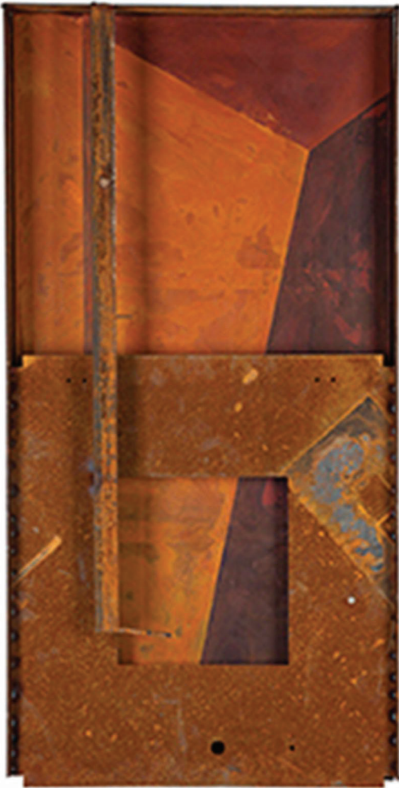
Il. 1. K. Słuchocka, Życie (akryl, stal, 130 × 60 cm, 2015)