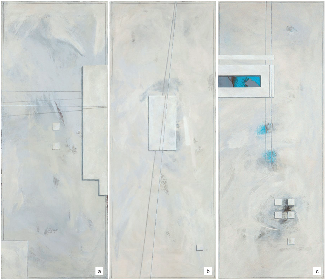
Il. 5. K. Słuchocka: a) Wyznaczone , b) Pozornie , c) Dwoistość materii (akryl, 130 × 50 cm, 2014)