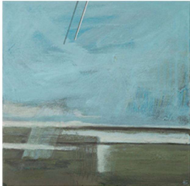
Il. 8. K. Słuchocka, W trakcie rozmowy (akryl, 40 × 40 cm, 2015)