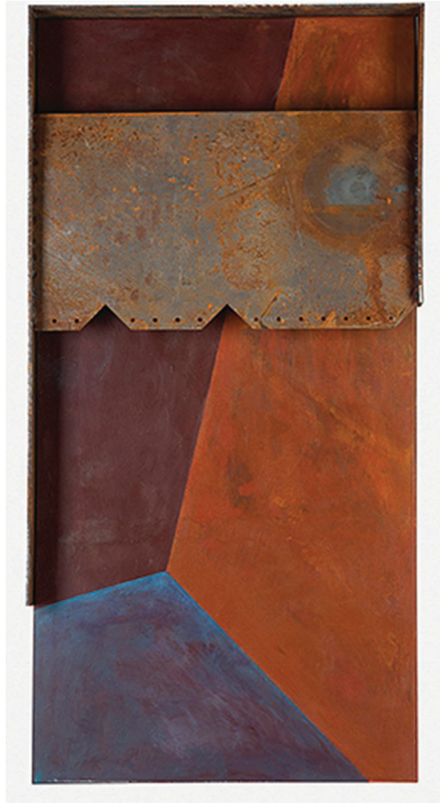
Il. 2. K. Słuchocka, Wartość podwójna (akryl, stal, 130 × 60 cm, 2015)