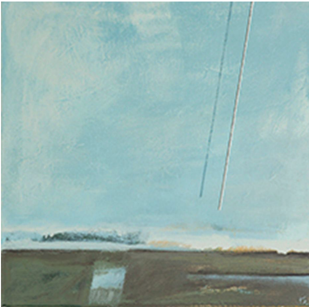
Il. 7. K. Słuchocka, To tam (akryl, 40 × 40 cm, 2015)