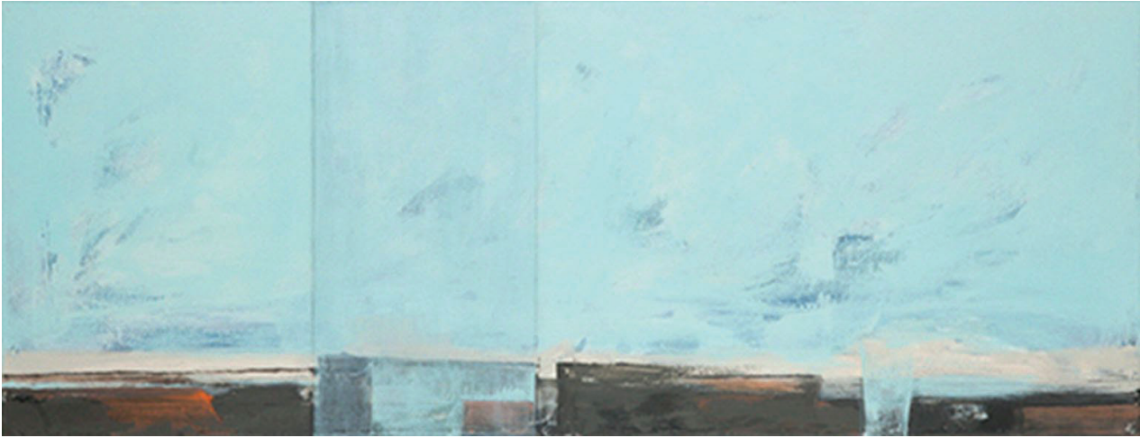
Il. 6. K. Słuchocka, Kadr osobisty (akryl, 130 × 80 cm, 2015)