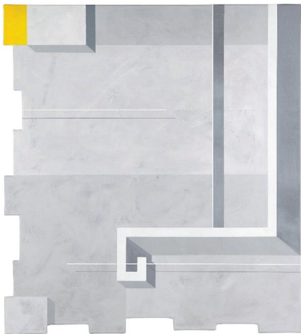
Il. 3. K. Słuchocka, Archidea Filharmonia Szczecińska Level +2 (akryl, krosno sosnowe nieregularne, 108 × 98 cm, 2016)