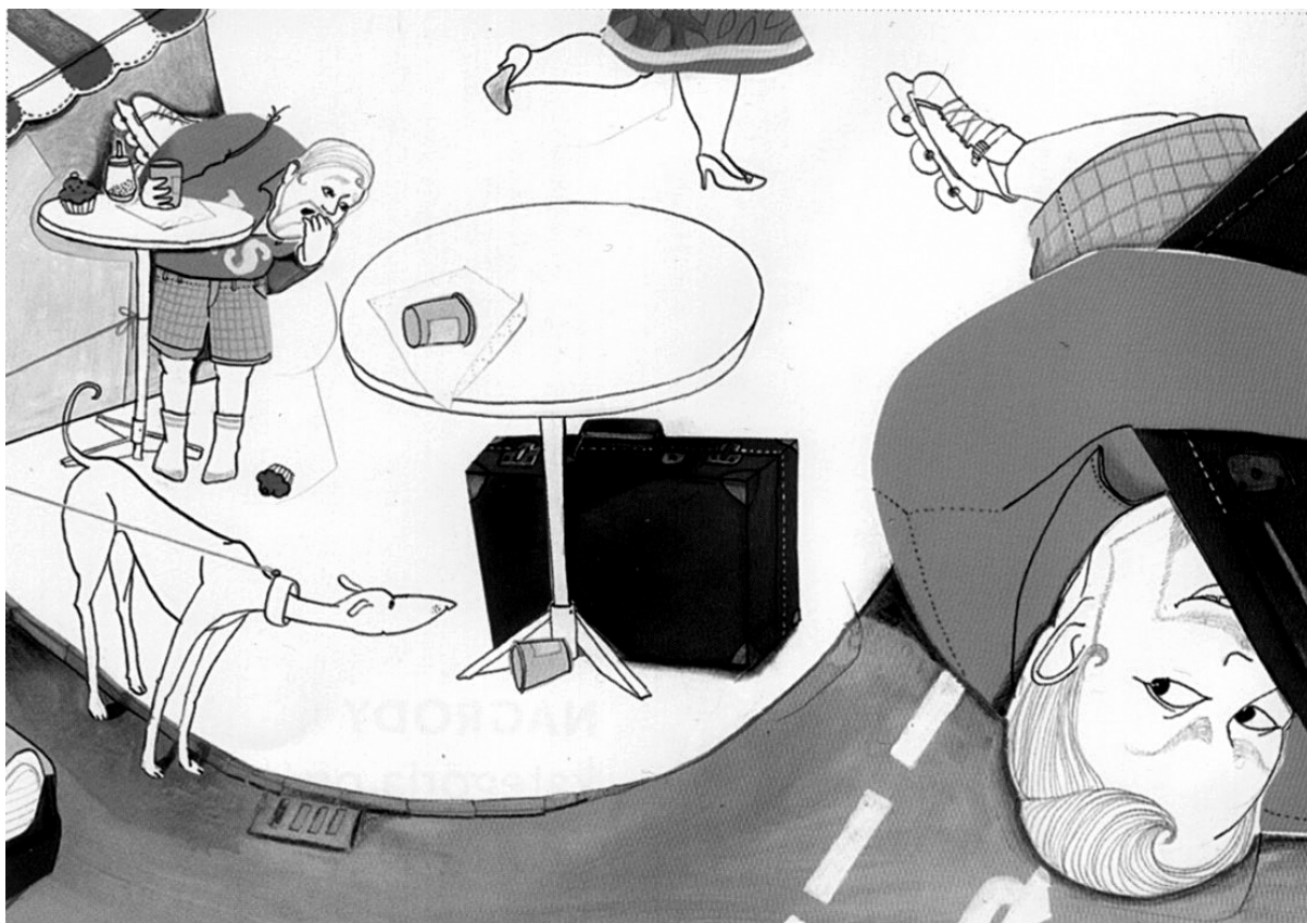
il. 1 Julia Kotulla. ilustracja do Alles wegen Blasmusik