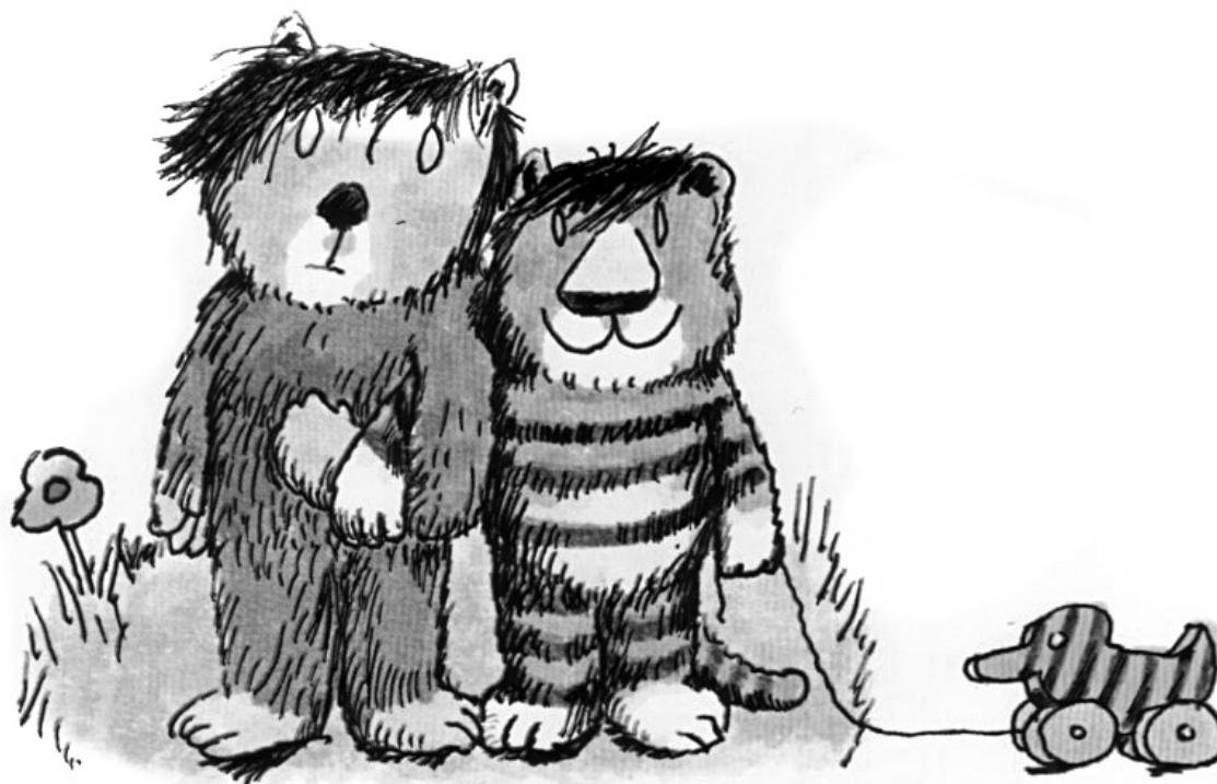
il. 4 Janosch, ilustracja do Ach, jak cudowna jest Panama , Kraków, Wyd. Znak, 2009