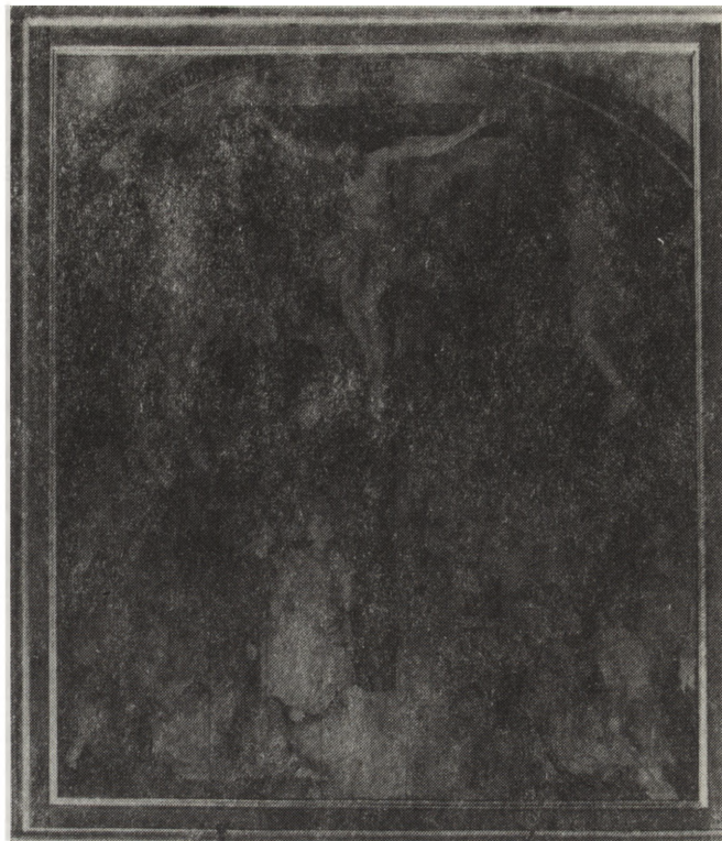
2. Korytnica, tryptyk z pierwszej ćwierci XVII w. — stan po konserwacji