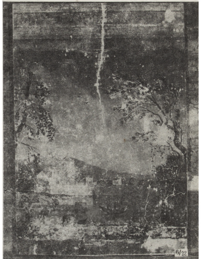
6. Mirogonowice, płat z malowidłem z pierwszej ćwierci XIX w. z salonu dworu — po zdjęciu i kitowaniu ubytków

usunięto chemicznie przemalowania, zakitowano ubytki, wypunktowano farbami olejnymi firmy Talens. Obraz Matki Boskiej z Dzieciątkiem naciągnięto na deskę zaimpregnowaną Osolanem KI w ksylenie, której ubytki uzupełniono kitem trocinowym. Po oczyszczeniu założono srebrną sukienkę. Natomiast sukienka z obrazu św. Michała ze względu na jego wartość artystyczną ekspozycyjna będzie na kopii.