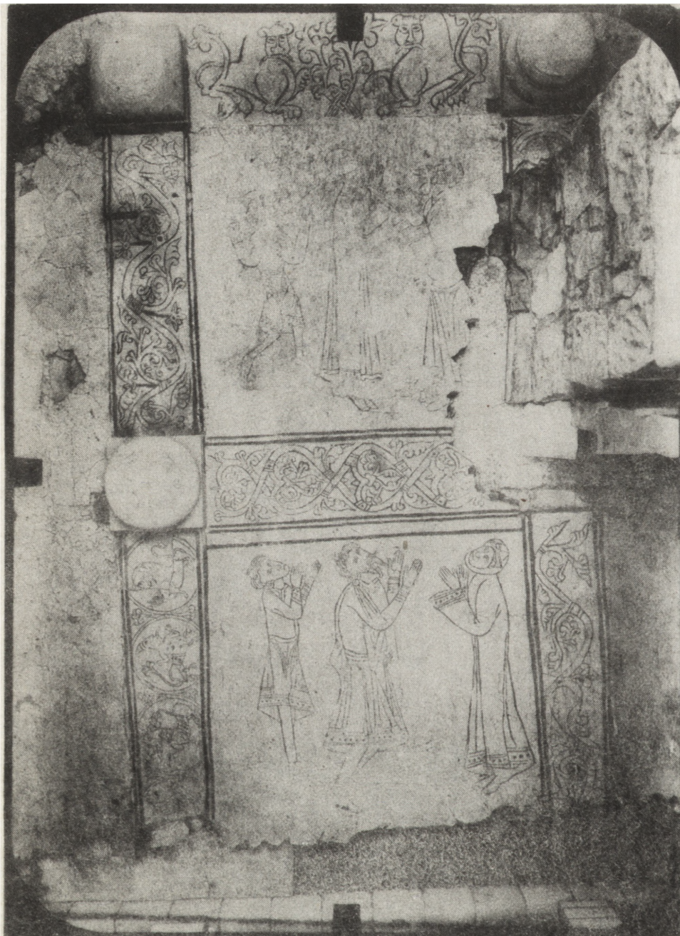
4. Wislica, romańska posadzka z podziemi kolegiaty — stan po konserwacji

nej. Podjęto decyzję o rekonstrukcji kolorystycznej. Zrekonstruowano również kwatery ze sceną Narodzenia w skrzydle. Punktowanie ubytków warstwy malarskiej wykonano w technice olejnej farbami odsączonymi. W 1987 r. zakończono prace wraz z rekonstrukcją ramy. Obiekt umieszczono na ścianie północnej prezbiterium kościoła parafialnego w Stopnicy. Wykonawca: „Plastyka” — Kraków, K. Gujda, H. Gujda, J. Strużyńska. Inwestor: WKZ.