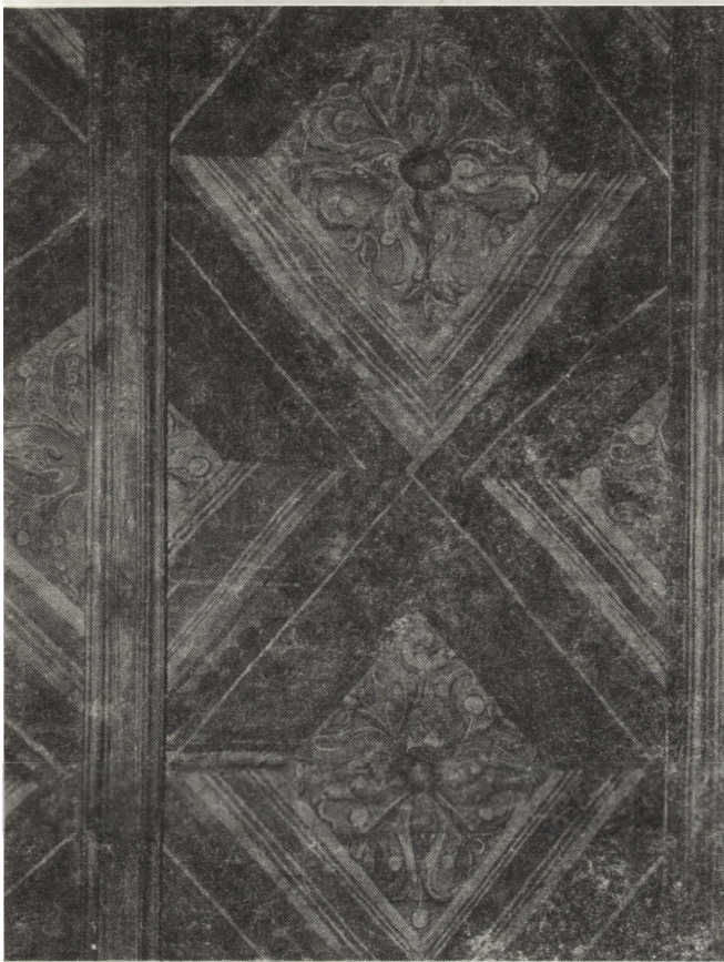
5. Chotelek Zielony, kościół filialny p.w. św. Stanisława Biskupa — malowidło ze stropu drewnianego z połowy XVI w. — stan po konserwacji