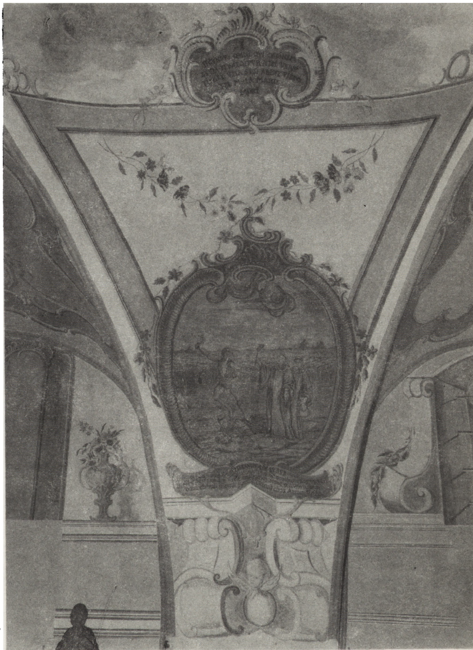
3. Święty Krzyż, zakrystia, malowidło ścienne z XVIII w. na sklepieniu — stan po konserwacji

z XX w. Wykonano oprawy oświetleniowe we wnętrzu, zwieszakowe i naścienne, latarnie zewnętrzne oraz trybowane okucia mosiężne nowych drzwi głównych i bocznych (F. Miecznikowski). Ponadto w latach 1985–1986 poddano konserwacji sześć obrazów K. Mołodzińskiego — wizerunków świętych — z XVIII w. Obrazy oczyszczono, sprasowano pęcherze, usunięto przemalowania, zdublowano masą woskowo-żywiczną, do kilku wykonano nowe krosna, ubytki wypunktowano olejno, zrekonstruowano ramy obrazów. Zawieszono zostały na ścianach nawy i i prezbiterium (M. Hapek, K. Horodziejewicz, E. Witkojc, J. Witkojc). W 1986 r. przeprowadzono konserwację drewnianej figury Chrystusa Ukrzyżowanego z XVIII w. — odczyszczono, usunięto przemalowanie, odkazono Antoksem, impregnowano Osakrylem w toluenie. Figurę umieszczono na zrekonstruowanym krzyżu