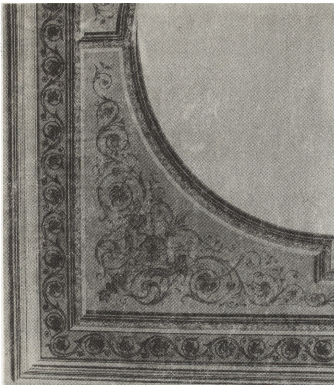
1. Bejsce, pałac, malowidło na suficie w sali frontowej, pierwsza połowa XIX w. — stan po konserwacji