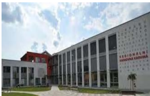
Zdj. 1. Biblioteka Regionalna w Karwinie.

Od 1969 roku Regionalna Biblioteka w Karwinie zaczęła pełnić funkcję koordynatora metodycznego i kuratora polskich oddziałów bibliotek publicznych na Zaolziu. Pomoc metodyczna obejmowała uzupełnianie zbiorów, opracowanie materiałów metodycznych przydatnych w pracy kulturalno-oświatowej, prowadzenie kursów i szkoleń dotyczących problematyki polskich oddziałów[5]. W roku 1974 w bibliotece w Karwinie został założony Dział Literatur Narodowych, a w jego ramach także Oddział Literatury Polskiej.