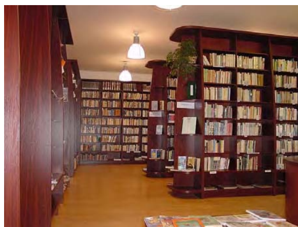
Zdj. 3. Oddział Literatury Polskiej Biblioteki Regionalnej w Karwinie, wewnątrz.