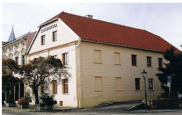
Zdj. 2. Oddział Literatury Polskiej Biblioteki Regionalnej w Karwinie.

W tym czasie w tym dziale znajdowało się ponad 20 tys. pozycji i kilkadziesiąt różnych czasopism[6]. Zbiory tworzyła przede wszystkim literatura dziecięca, młodzieżowa, popularno-naukowa, fachowa i naukowa, specjalne miejsce zajmował dział językoznawczy, literatury i historii polskiej. Regionalna Biblioteka w Karwinie ze swoim Oddziałem Literatury Polskiej pełni do dnia dzisiejszego funkcję centralnej biblioteki publicznej Zaolzia.