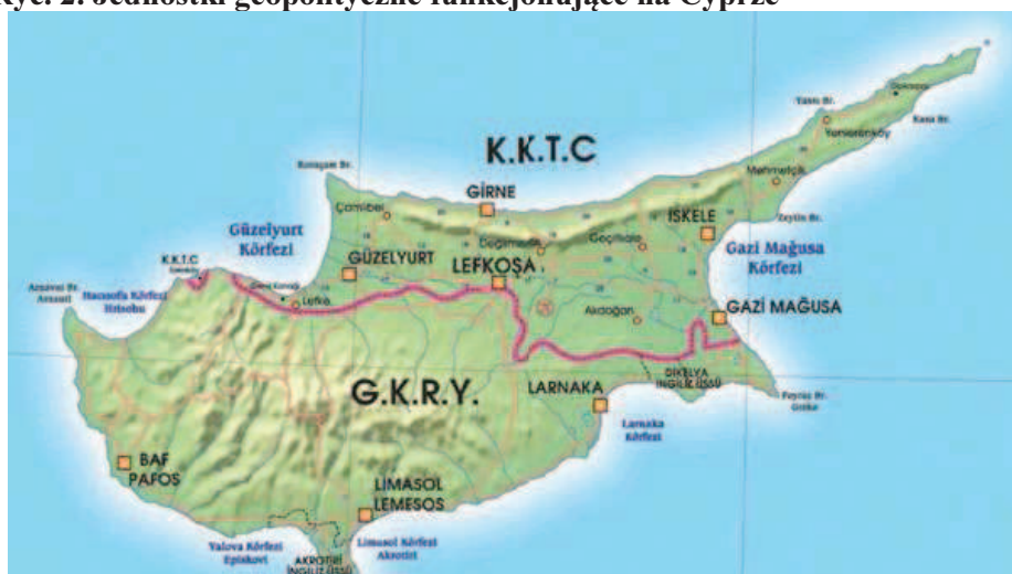
Ryc. 2. Jednostki geopolityczne funkcjonujące na Cyprze

Mapa zawiera nazwy w dwóch językach (greckim i tureckim). Skrót G.K.R.Y. (tur. Güney Kıbrıs Rum Yönetimi ) oznacza Grecką Administrację Cypru Południowego.