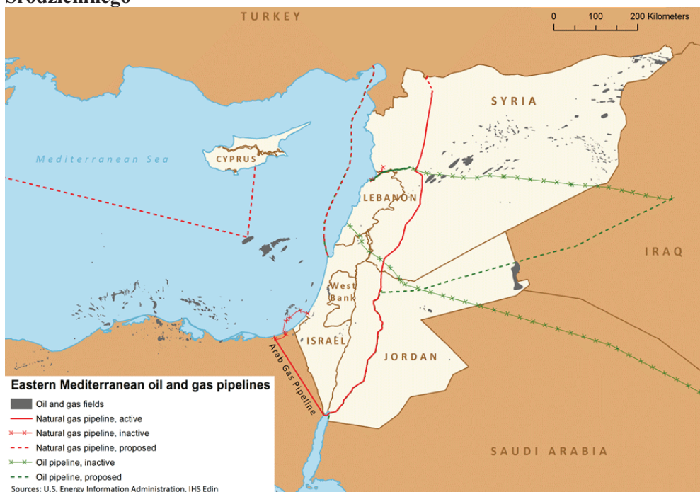
Ryc. 5. Odkryte złoża węglowodorów we wschodniej części Morza Śródziemnego