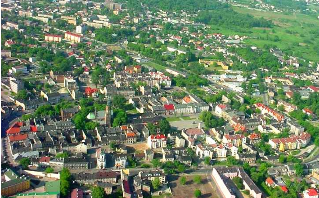
Fot. 1. Widok na Miasto Kazimierzowskie od strony północnej