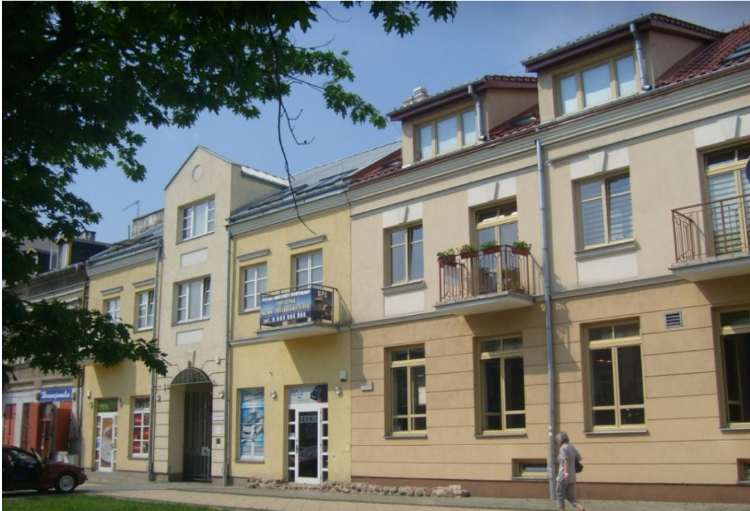
Fot. 2. Nowa zabudowa mieszkaniowa powstająca w obrębie historycznego zespołu architektoniczno-urbanistycznego