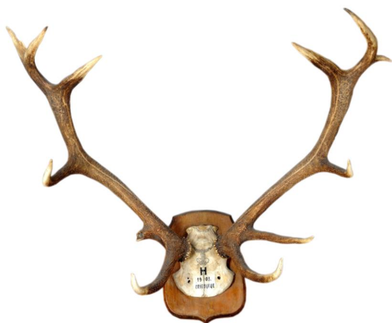
Ryc. 2. Poroże jelenia upolowanego w 1903r. przez Mikołaja II w Lasach Spalskich

Mikołaj II, tak jak jego ojciec, był bardzo mocno związany uczuciowo ze swoją żoną Aleksandrą Fiodorowną oraz dziećmi: czterema córkami i jedynym synem Aleksym. Niestety, następca tronu był dzieckiem nieuleczalnie chorym na hemofilię. Choroba ta przysparzała cesarskiej parze wielu trosk i niejednokrotnie była powodem rozpacz. Aleksy podczas pobytu w 1912 r. w Białowieży uległ wydawałoby się niegroźnemu wypadkowi. Uderzenie w okolicach pachwiny spowodowało wewnętrzny wylew. Po nieznacznej poprawie stanu zdrowia syna cała rodzina Romanowów przejechała tradycyjnie na kolejne polowanie do Spały. Tutaj nastąpiła straszliwa eskalacja choroby. Dramatyczny jej przebieg przez kilka tygodni elektryzował nie tylko społeczeństwo imperialnej Rosji. Aleksy otarł się o śmierć. Na szczęście nastąpiło cudowne ozdrowienie, które przypisywano mocy syberyjskiego mistyka Gieorgija Rasputina. Jego rola i wpływ na losy rodziny Romanowów i całej Rosji wzrosły wtedy w sposób niewyobrażalny, w pewnym stopniu przyczyniając się później do zguby całej rodziny.