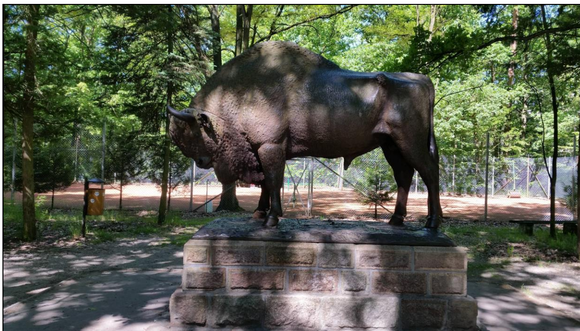
Ryc. 3. Posąg żubra z 1862 r. obecnie w Spale

Pobyt Aleksandra II w Puszczy Białowieskiej spowodował znaczny wzrost zainteresowania nią wśród członków rodziny Romanowów. Odbywało się w tam wiele tzw. wielkksiążęcych polowań. Pozyskiwane i odławiane żubry były przekazywane do różnego rodzaju ośrodków naukowych oraz europejskich ogrodów zoologicznych. Żubry z tych powodów zaczęto otaczać większą opieką i ograniczono liczbę polowań na te zwierzęta.