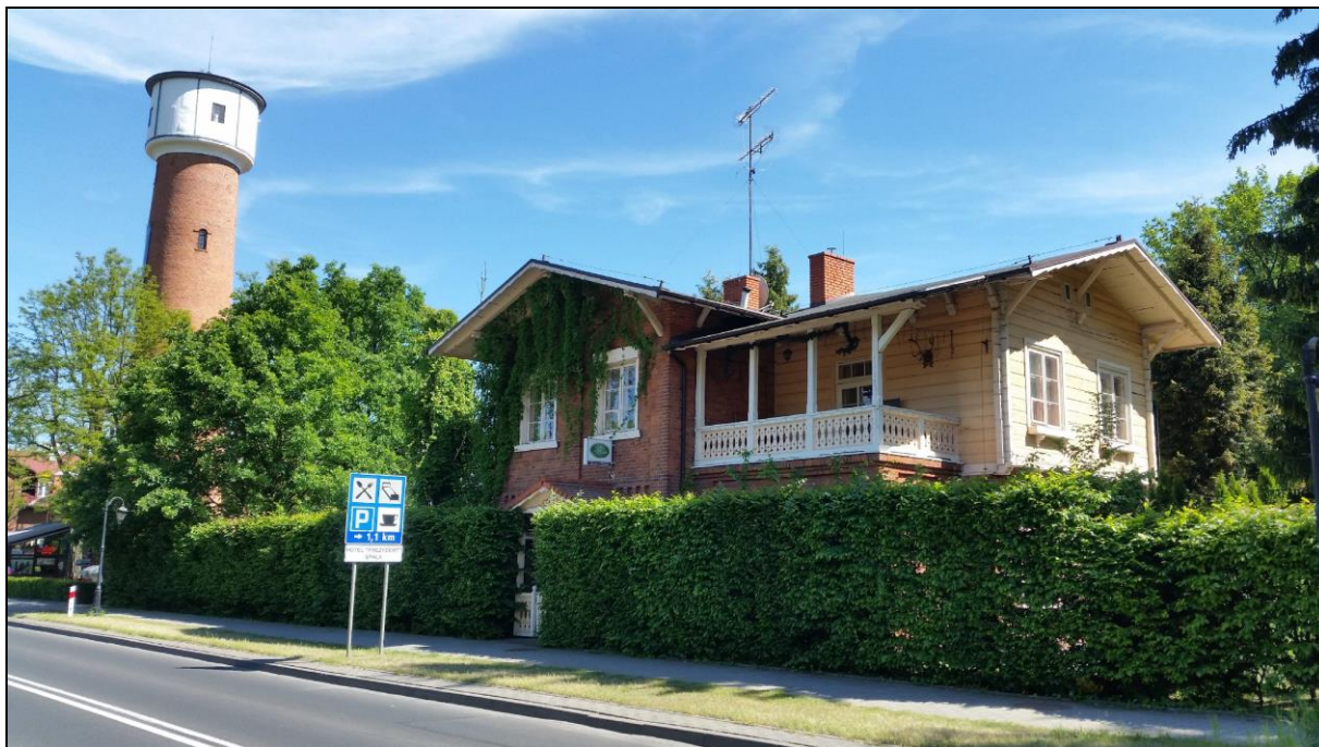
Ryc. 10. Szwajcarska willa i wieża ciśień w Spale z końca XIXw., obecnie pensjonat Willa Jelonek oraz kawiarnia Carska Wieża

W proponowanym pakiecie można zauważyć ścisłe relacje pomiędzy dziedzictwem kulturowym i przyrodniczym proponowanych miejsc, którego nie można traktować rozdzielnie. Elementy te, jak słusznie podkreślił P. Kociszewski [2016, s. 172-173], są dziedzictwem miejsca – konkretnej miejscowości bądź regionu i należy ujmować je łącznie. W tym przypadku wzajemnie się one przenikają i tworzą wspólne świadectwo długiej obecności Rosjan na ziemiach polskich w XIX i na początku XX wieku.