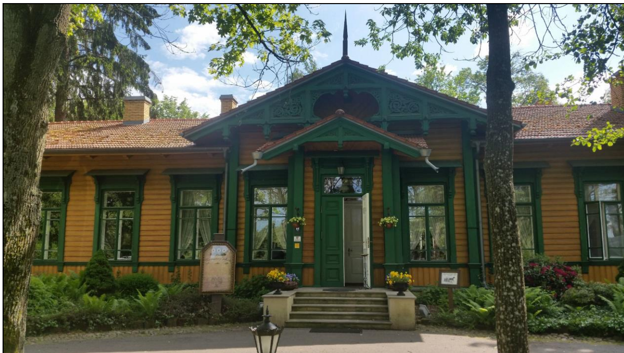
Ryc. 7. Stacja kolejowa Białowieża Towarowa – obecnie restauracja Carska