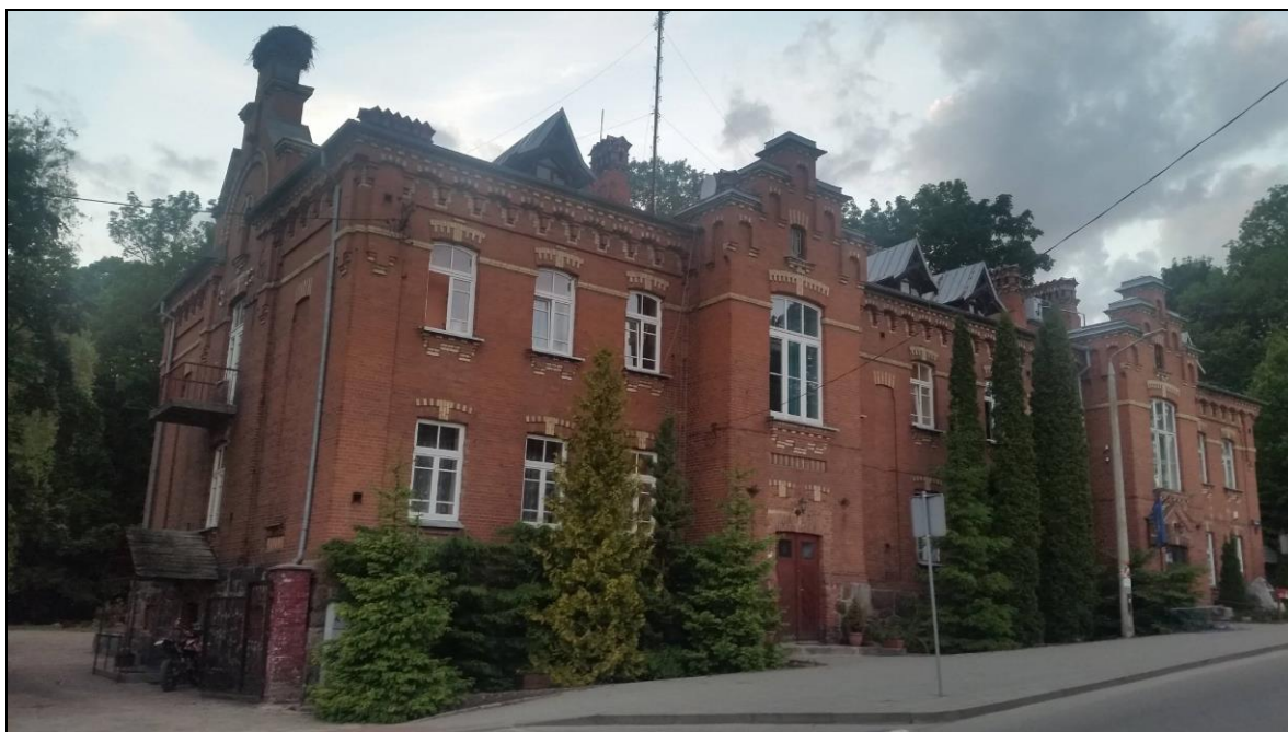
Ryc. 8. Dom jegierski z 1904 r. – stan obecny

W 1904 r. w Białowieży zbudowano dwa kolejne okazałe piętrowe budynki. Dom Marszałkowski (Dom Hofmarszałski) i Dom Jegierski. Oba wykonane są z czerwonej cegły i przypominają zabudowania powstałe w tym okresie w Spale. Aleksander III zdążył przed swoją śmiercią w 1894 r. odwiedzić Białowieżę tylko raz. Ze względu na zły stan zdrowia nie dane mu było nacieszyć się nowo powstałą rezydencją. Car zdążył jeszcze przejechać z Białowieży do Spały, a następnie do Liwadii na Krymie. Czuł się coraz gorzej i niebawem zmarł tam na ostrą niewydolność nerek [Боханов 2001, s. 458].