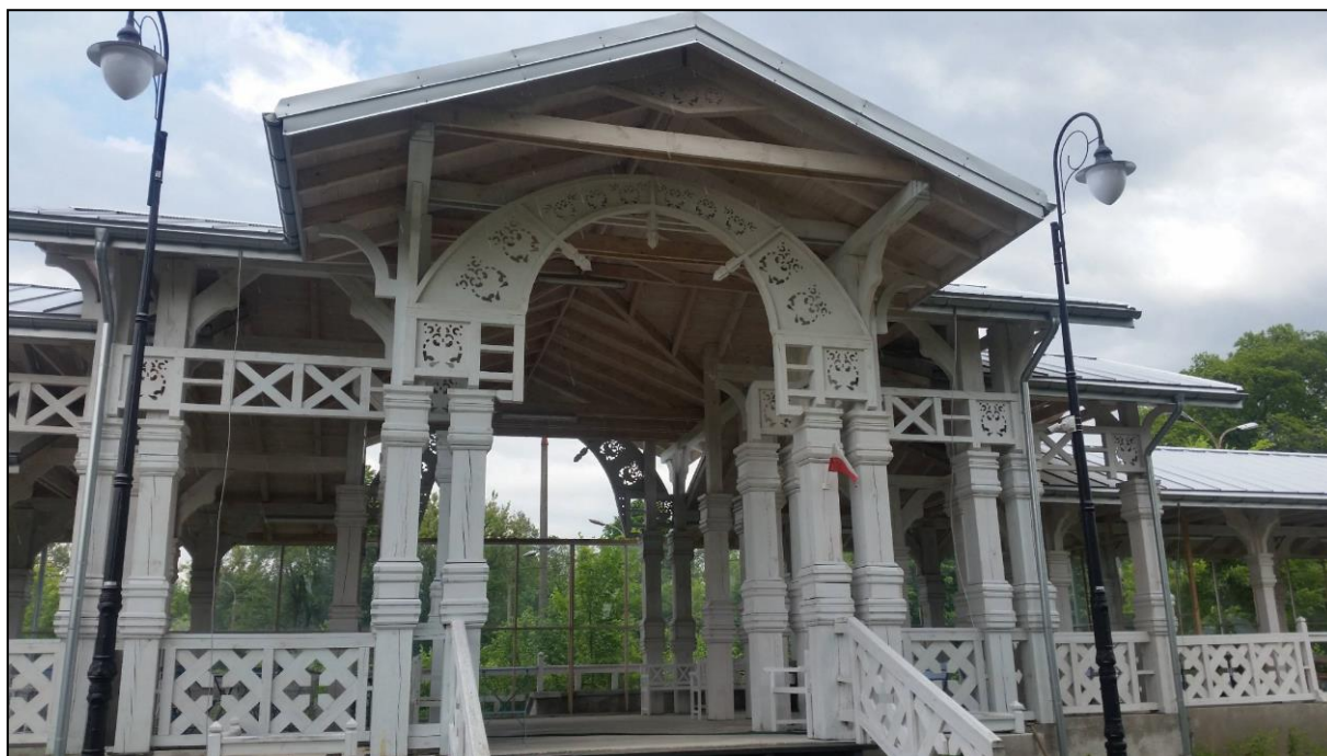
Ryc. 6. Rekonstrukcja rampy kolejowej w Białowieży z 1897 r. – stan obecny

W 1897 r. oddano do użytku ostatni odcinek linii kolejowej z Bielska Podlaskiego do Białowieży. Nieopodal pałacu została urządzona z wielkim przepychem rampa kolejowa, na którą przybywała i z której odjeżdżała cesarska rodzina. Drugą stacją kolejową była stacja Białowieża Towarowa. W 2015 r. rampę carską zrekonstruował lokalny inwestor, a w budynkach stacji Białowieża Towarowa znajduje się słynna w całej Polsce restauracja Carska, wagony sypialne i apartamenty gościnne.