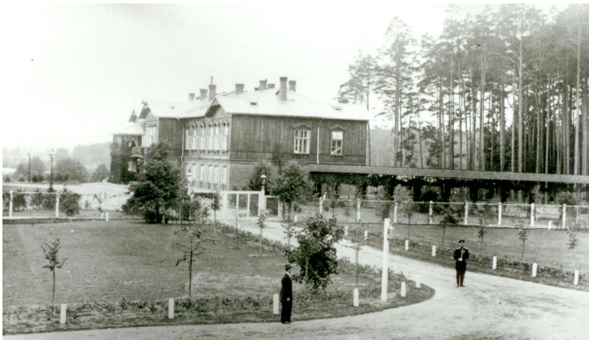
Ryc. 1. Pałacyk myśliwski w Spale, koniec XIX w.