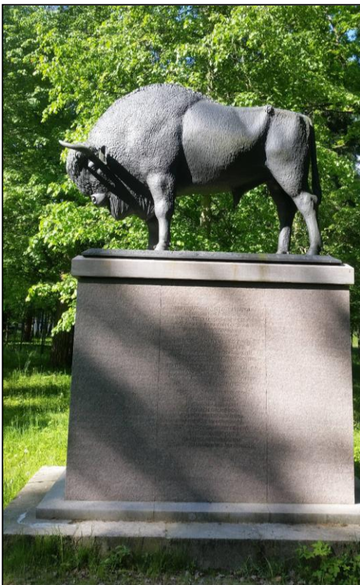
Ryc. 4. Replika posągu żubra posadowiona w 2015r. w Zwierzyńcu koło Białowieży Źródło Zbiory własne autora.

Pod koniec XIX wieku wśród arystokracji rosyjskiej zapanowała moda na posiadanie prywatnych terenów łowieckich. Aleksander III po wybudowaniu rezydencji myśliwskiej w Spale postanowił rozszerzyć swój prywatny majątek również o Puszcę Białowieską. W 1888 r. doszło do wymiany własności ziemskiej z domen carskich w Guberniach Orłowskiej i Symbirskiej na podobny areal Puszczy Białowieskiej i sąsiadującej z nią Puszczy Świsłockiej. Od tej pory puszcza miała stać się terenem gigantycznego gospodarstwa łowieckiego, które nie posiadało swojego odpowiednika w całej Europie [Kossak 2001, s. 321]. Sama długość jej granic wyniosła aż 333 km. Niebawem przystąpiono do budowy nowej carskiej rezydencji z ogromnym carskim pałacem myśliwskim. Autorem projektu został architekt francuskiego pochodzenia Nikołaj de Roszefort. Budowa trwała pięć lat i zakończyła się w 1894 r.