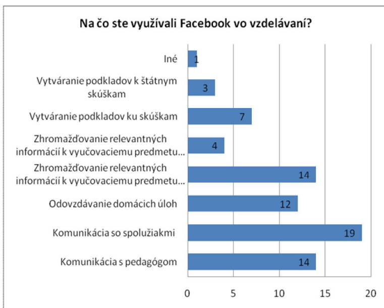
Graf č. 2.

Graf č. 2 zobrazuje odpovede študentov na položku „Na čo by ste využívali Facebook vo vzdelávaní?“ Študenti mali možnosť vybrať všetky preddefinované odpovede, ale aj doplniť vlastnú odpoveď. Najviac študenti využívajú vo vzdelávaní Facebook na komunikáciu so spolužiakmi 95%, odovzdávanie domácich úloh 60%, komunikácia s pedagógom 70% a zhromažďovanie relevantných informácií k vyučovaciemu predmetu študentmi 70%. Viac ako tretina 35% používa Facebook na vytváranie podkladov ku skúškam a len 15%