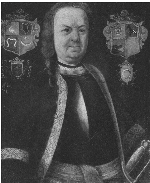
Fot. 1. Franciszek Pstrokoński syn Piotra (obraz nieznanego autorstwa z ok. 1730 r.)

że w Muzeum wiszą portrety dwóch różnych Franciszków Budzisz-Pstrokońskich. Jeden z tych portretów był wizerunkiem starosty szadkowskiego, ale nie tego ze wspomnianej wystawy ani z publikacji Polaków portret własny .