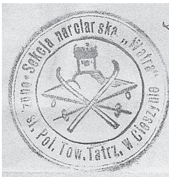
Fot. 1. Stempel SN „Watra”

właśnie partnerskie podejście do organizacji społecznych, nieco skażone konfliktem na linii PZN – PTT w latach trzydziestych ubiegłego wieku, przyczyniło się do rozwoju turystyki narciarskiej i narciarstwa sportowego. Taki przykład wspieranej przez państwo działalności obywatelskiej godny jest i zapamiętania, i powielania.