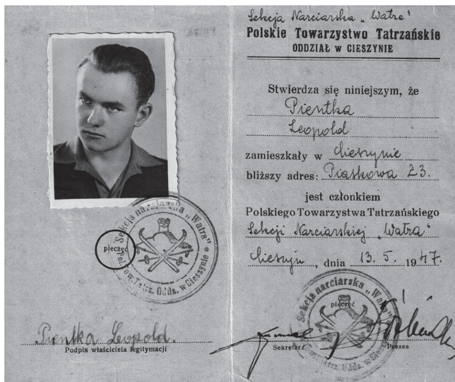
Fot. 5. Legitymacja członkowska SN „Watra”

Planowano również budowę skoczni w Malince, zaniechaną z powodu wcześniejszego oddania do użytku przez Śląski Klub Narciarski skoczni w Łabajowie 32 . W dniach 30 listopada i 1 grudnia 1946 roku SN „Watra” uroczyście obchodziła 25-lecie istnienia. W dniach 1 grudnia 1946 do 12 stycznia 1947 w Muzeum Miejskim w Cieszynie zorganizowano wystawę pt. „Dorobek 25 lat na polu narciarstwa”.