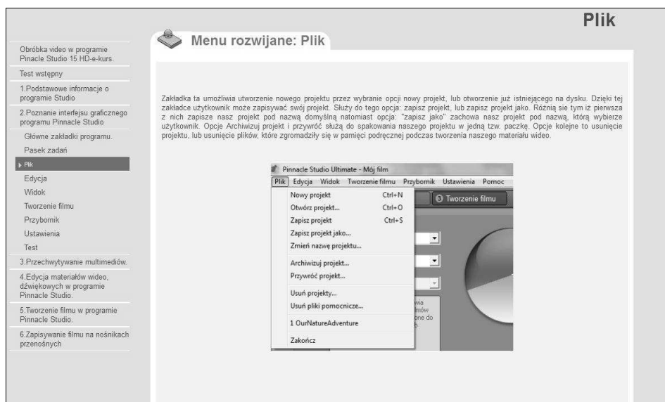
Rys. 3. Przykładowe wyselekcjonowanie materiału

Cały materiał został tak wyselekcjonowany, aby kursant zdobywał tylko właściwe informacje i jego uwaga skupiona była na danym wycinku materiału (rys. 3).