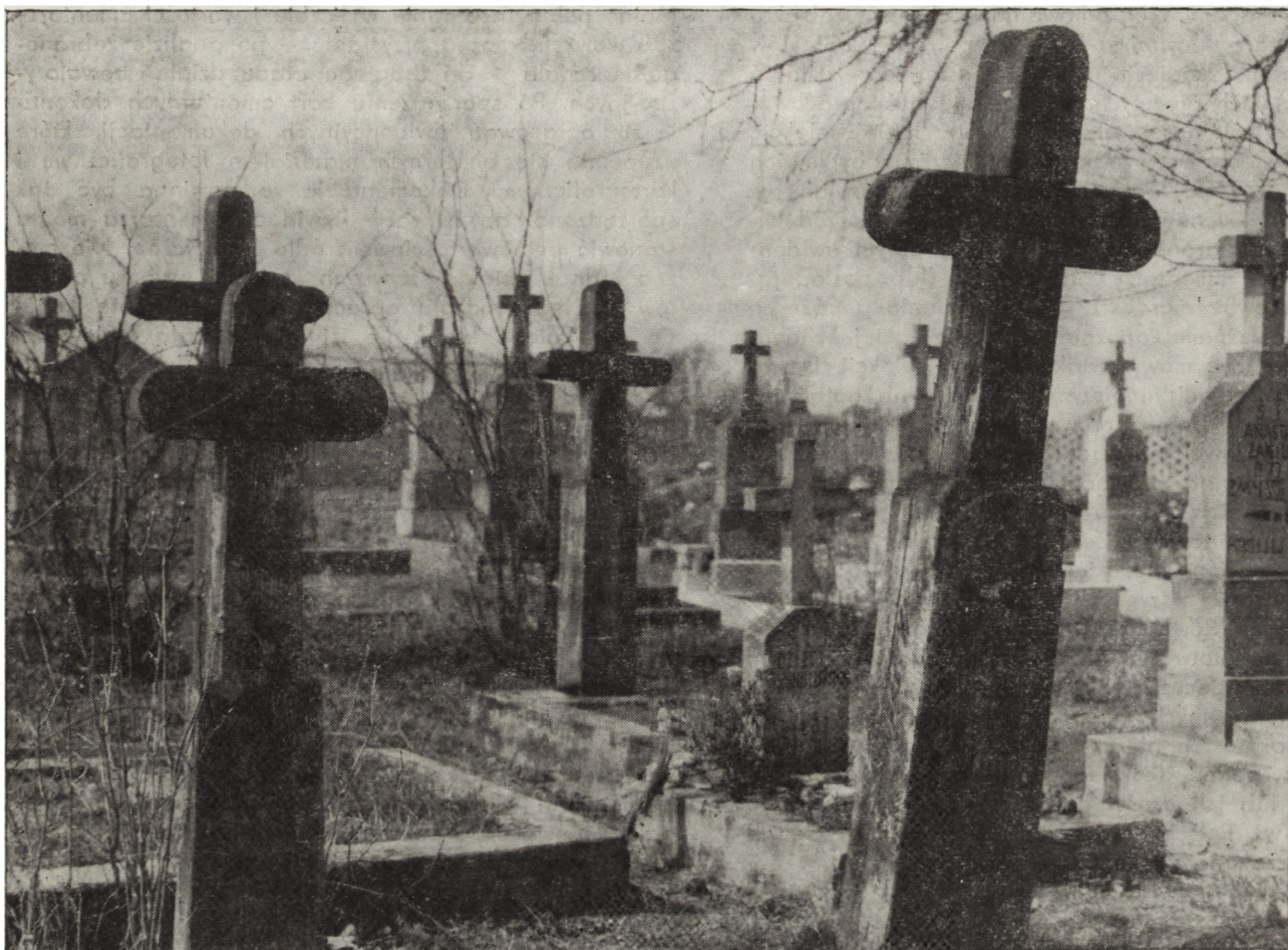
4. Hanna (woj. bielskopodlaskie). Cmentarz unicko-katolicki