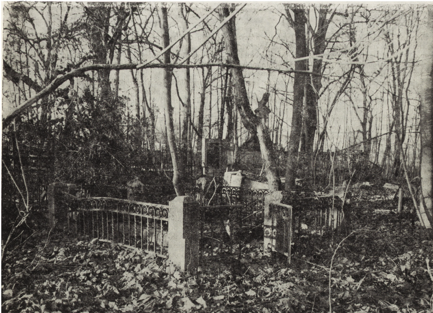
1. Bągart (Elbląg voivodship). Evangelic cemetery