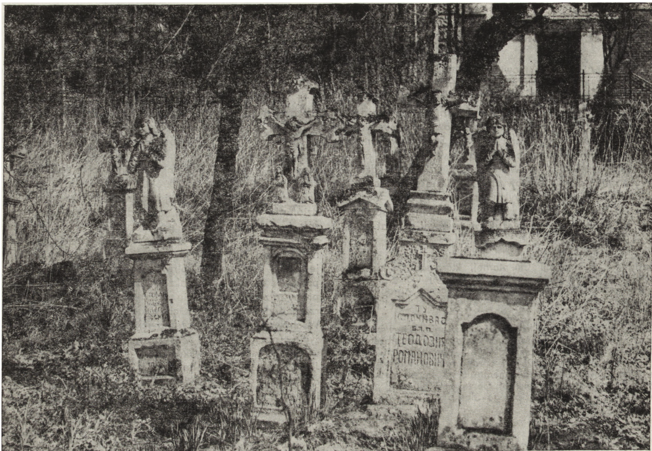
2. Myców (woj. zamojskie). Cmentarz grecko-katolicki

i chowaniu zmarłych z 31 stycznia 1959 r., nie precyzują nawet ogólnikowo zasad utrzymywania, pielęgnowania i konserwowania cmentarzy zabytkowych, to stanie się zrozumiałe indywidualne poszukiwanie najwłaściwszych rozwiązań zarówno przez służby konserwatorskie, jak i powstające coraz liczniej społeczne komitety opieki nad poszczególnymi cmentarzami.