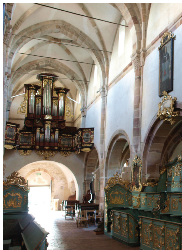
Il. 3. Sklepienie nawy głównej z nadwieszonymi słupkami, kościół opactwa w Sulejowie

Kompozycja sklepienia – postrzeganego jako obraz nieba [21, s. 278] – „wspartego” na obecnych w stallach zakonnikach i w ten sposób z nimi zjednoczonego wyrażała także jedność liturgii klasztornej z liturgią niebiańską. Modlitwę chórową – sacrificium laudis be-