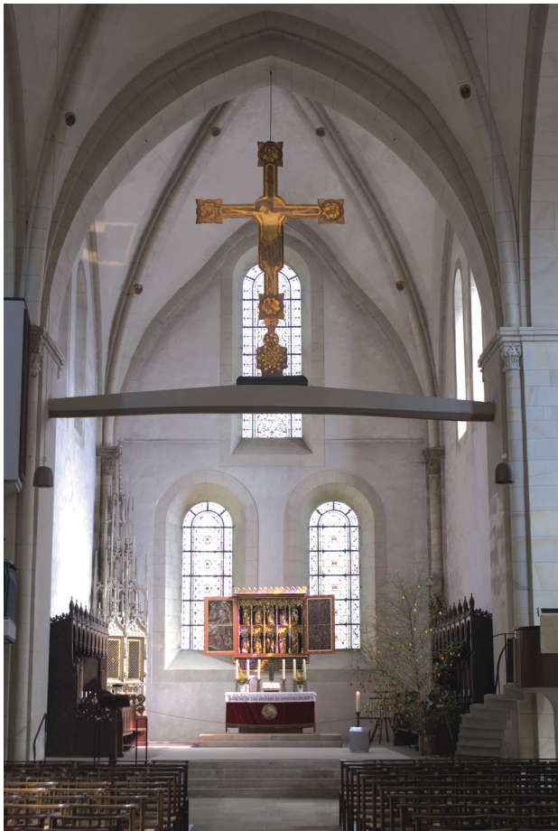
Il. 1. Prezbiterium kościoła opactwa Loccum, po 1240. Krucyfik na belce tęczowej umieszczony w latach 30. XX w. Fig. 1. Presbytery of the church in the Loccum abbey, after 1240. The crucifix on the rood-screen beam was placed there in the 1930s

do malowideł czy kamiennych wież – za przejaw zbyt-ku naruszający simplicitas ordinis . Ta okoliczność wraz z szeroką popularnością motywu triady okien z rozetą wskazują, że taka kompozycja była także postrzegana jako istotny w aranżacji sanctuarium cysterskiego kościoła nośnik znaczeń symbolicznych [4, s. 668–669].