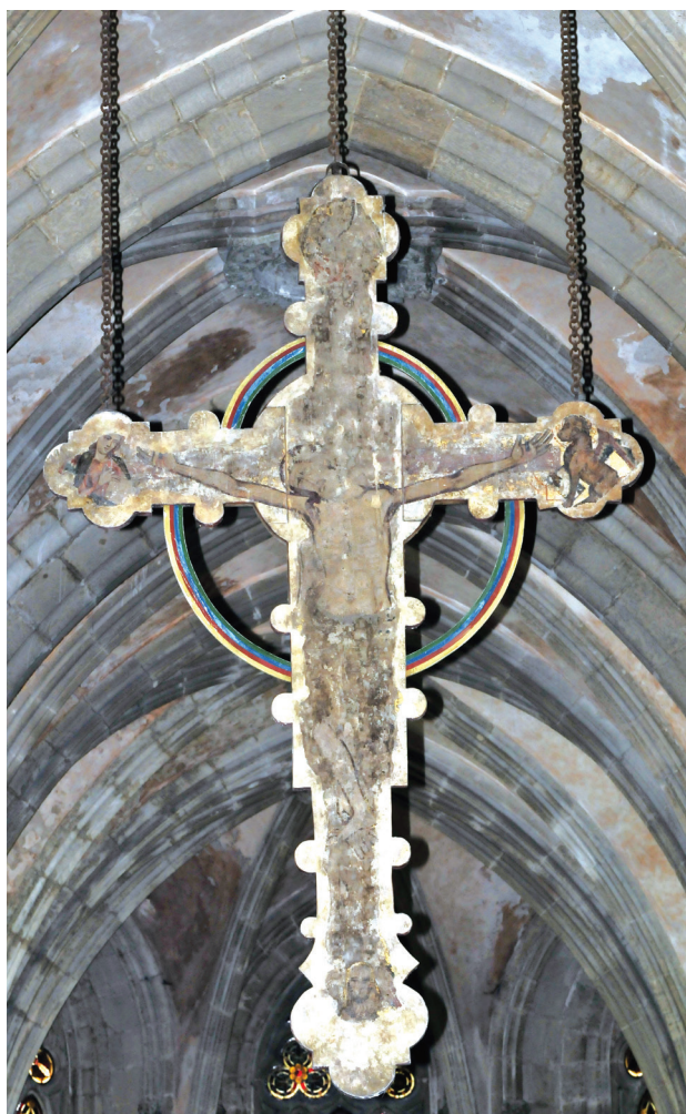
Il. 4. Polichromowany krucyfiks-Drzewo Życia z kościoła opactwa Pforta, ok. 1250 r.