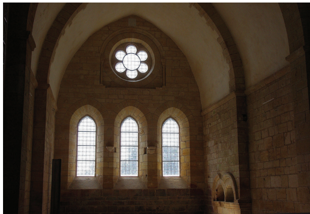
Il. 2. Ściana szczytowa prezbiterium kościoła opactwa Noirlac, około 1140 Fig. 2. Presbytery gable wall of the church in Noirlac abbey, about 1140

Od połowy XII w. rozwiązaniem charakteryzującym cysterskie kościoły jest oryginalne wyprowadzenie konstrukcji sklepienia nawy głównej. Gurty międzyprzęsłowe, i czasami także żebra i służki wspierające sklepienie,