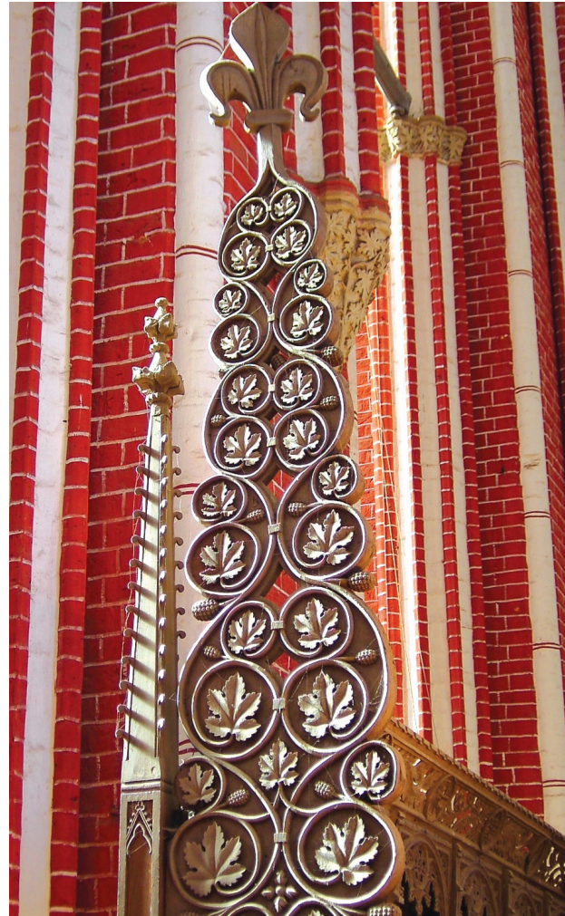
Il. 6. Fragment stalli mnichów w kościele opactwa w Doberanie, około 1300 r.