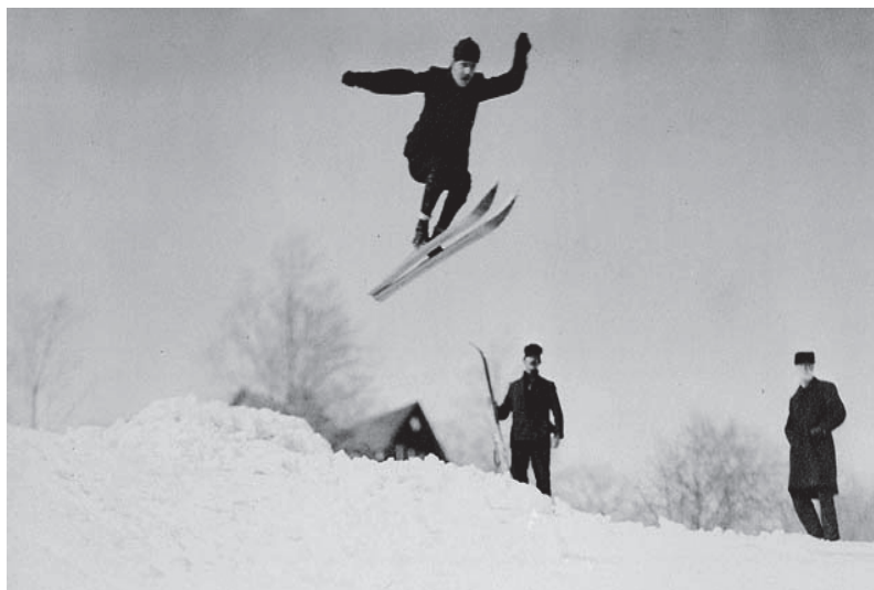
Fot. 4. Początki skoków na ziemiach polskich, na terenowej skoczni ze śniegu