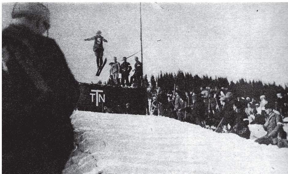
Fot. 5. 1911 r. skoki na skoczni narciarskiej TTN na Kalatówkach; źródło: J. Kapeniak, Tatrzańskie diabły, W starym obiektywie (serwis fotograficzny) , Warszawa 1971.

Po powołaniu w 1919 r. Polskiego Związku Narciarskiego (PZN) pierwsze dwa lata zarząd poświęcił na działania związane z budową wewnętrznych struktur związku oraz na upowszechnianie narciarstwa wśród społeczeństwa polskiego. Osiągnięciem PZN było opracowanie i nowelizacja statutu, zorganizowanie Związkowych Narciarskich Mistrzostw Polski oraz udostępnienie skoczni narciarskich w Zakopanem na Jaworzynce, w Sławsku, Krakowie i Bielsku. W pierwszych pięciu latach istnienia PZN swoją działalność prowadził w oparciu o składki członkowskie, dochody z imprez narciarskich oraz z subwencji państwowych. Wraz z rozwojem biegów narciarskich niezależnie rozwijały się skoki narciarskie. Wcześniej, bo już w 1920 r., z inicjatywy działaczy SNPTT w Zakopanem oddano do użytku większą skocznię narciarską w Dolinie Jaworzynki pod Zakopanem, a w następnych latach skocznie powstawały w Krakowie, Lwowie, Sławsku i w Worochcie.