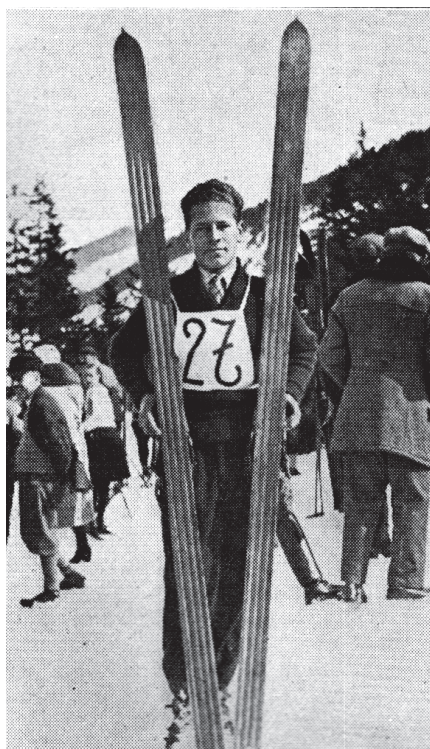
Fot. 7. Stanisław Marusarz najlepszy polski skoczek narciarski w okresie 20-lecia międzywojennego; źródło: „Tygodnik Ilustrowany” 1932, nr 12, s. 195.

Za najlepszego skoczka w okresie 20-lecia międzywojennego należy uznać Stanisława Marusarza (1913–1993). Przemawiają za tym jego sukcesy, m.in. mistrzostwo Polski w: 1932 r., 1933 r., 1935 r. 1936 r., 1937 r. i 1939 r. Czterokrotnie ustanawiał rekord Polski w skokach (w 1931 r. w Ponte di Legano – 74 m, w 1935 r. w Planicy – 87,5, 93 i 97 m), a także pięciokrotnie ustanowił rekord odległości skoczni na Krokwi, m.in. w: 1932 r. – 72 m, 1934 r. – 74 m, 1938 r. – 76,5 m. W omawianym czasie Stanisław Marusarz był wicemistrzem świata w skokach w 1938 r. i dwukrotnie uczestniczył w Igrzyskach Olimpijskich w Lake Placid 1932 r. oraz w Garmisch Partenkirchen w 1936 r. Za swoje sukcesy w 1938 r. został laureatem Wielkiej Honorowej Nagrody Sportowej, a także, w tym samym roku, zwyciężył w Plebiscycie Przeglądu Sportowego.