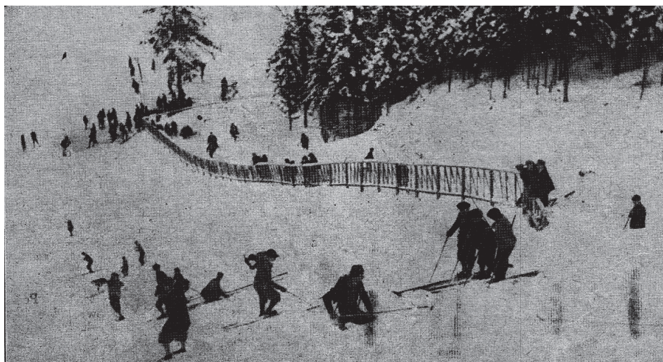
Fot. 3. Lipki k. Zakopanego, na niewielkiej skoczni śniegowej leży jeden z uczestników amatorskich skoków na nartach; źródło: „Stadjon” 1927, nr 3, s. 10.