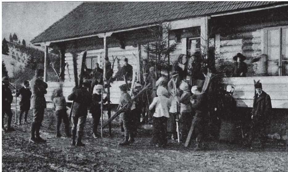
Fot. 2. 1913 r. uczestnicy kursu narciarskiego w Sławsku przed wyjściem na zajęcia; źródło: „Tygodnik Ilustrowany” 1913, nr 4, s. 76.