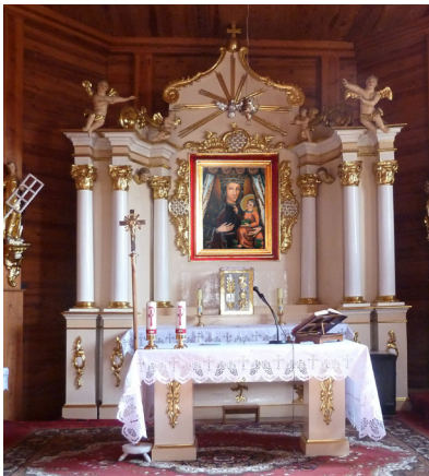
Fot. 2. Ołtarz główny kościoła w Umieniu.

Jezus odziany jest w pomarańczowoczerwoną suknię, na rewersie zieloną, dekorowaną srebrnymi motywami kwiatowymi. Prawe ramię, zapewne jako pograżone w cieniu, malarz przedstawił w kolorze ciemnobrunatnym. Suknię pod szyją, na krawędziach rękawów oraz na dolnym krańcu zdobią – podobnie jak u Marii – pasy z podwójnym rzędem pereł i złotym ornamentem pośrodku. Głowa Jezusa, o dziecięcej twarzy oddanej z lirycznym wdziękiem, jest odkryta. Otacza ją gładki nimb złocistych promieni ukazanych na kolistym, seledynowym tle. Jezus lewą dłonią przytrzymuje księgę oprawioną w zielone okładki spięte dwiema klamrami.