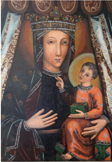
Fot. 1. Obraz Matki Boskiej Częstochowskiej w Umieniu. Fot. D. Zemła.

symetrycznie kamieni ujętych w proste cargc lub ozdobne oprawy – w centrum kamień prostokątny, ujęty przez dwa kwadratowe, następnie dwa okrągłe oraz grupa pereł. Na otoku osadzone są sterzcyny dekorowane klejnotami. Centrum korony wyróżnia trójdzielny kwiaton zwieńczony motywem lilii, w jego centrum osadzony jest duży, owalny kamień. Centralny kwiaton ujmują symetrycznie owalne, wywinięte ku dołowi sterzcyny ozdobione kwadratowymi kamieniami w prostych cargcach. W dalszej kolejności pojawiają się symetrycznie dwa kwiatony zawinięte szczytami ku dołowi dekorowane okrągłymi kamieniami w filigranowej oprawie. Wypełnienie otwartej korony wykonane jest zapewne z czerwonego aksamitu, którego krawędzie połyskują w jej głębi. Głowę Matki Bożej otacza nimb skomponowany z trzech promienistych kręgów: złocistego, cynobrowego i jasnobrązowego, ten ostatni przechodzi w ciemnobrązowe tło za postacią.