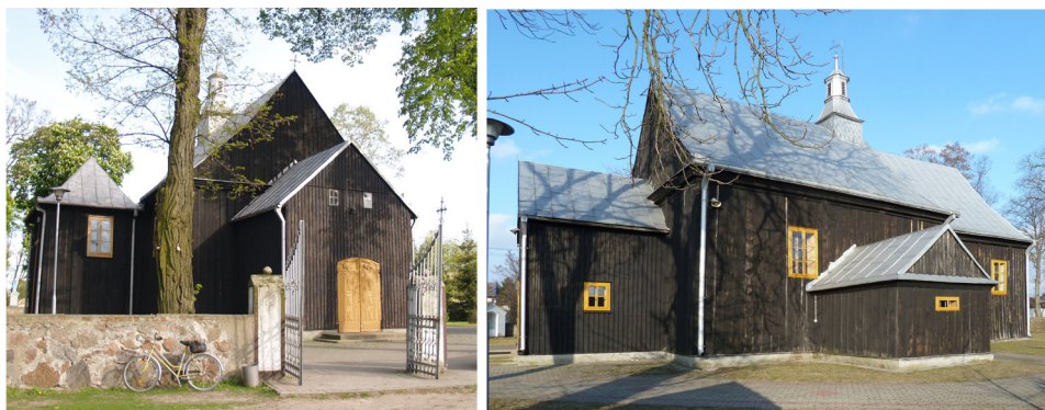
Fot. 7. Kościół pw. Św. Michała Archanioła w Umieniu, widok od zachodu i południa.