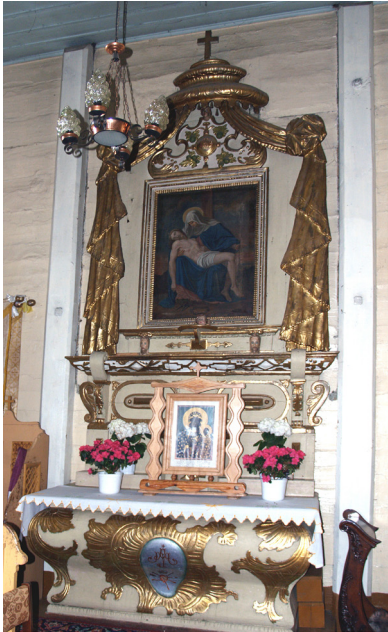
Fot. 8. Ołtarz w bocznej kaplicy kościoła w Umieniu, fotografia z 2008 r.

większość wyposażenia kościoła z XVII w. Powodem takiego stanu rzeczy był pożar świątyni ok. 1755 r., po którym została odbudowana i na nowo wyposażona w roku 1756 25 . Żywiół, tak przypuszczam, musiał strawić część prezbiterialną kościoła, gdyż w bocznej kaplicy zachowały się w fragmenty XVII-wiecznej nastawy ołtarza, uzupełnione późnobarokowymi elementami – mensą i baldachimem (il. 8) 26 . Z XVII-wiecznej kompozycji nastawy zachowała się predella, dekorowana ornamentem okuciowym, fragment partii centralnej (?) w formie profilowanej listwy wspartej na konsolach w kształcie męskich główek zwieńczonych jońską ślimacznicą oraz profilowana rama, nad którą umieszczony jest okuciowy kartusz z wypukłym medalionem z monogramem IHS w centrum i bocznych polach wypełnionych pęczkami owoców, zwieńczony główką aniołka. Jestem przekonany, że boczna kaplica umieńskiego kościoła i jej