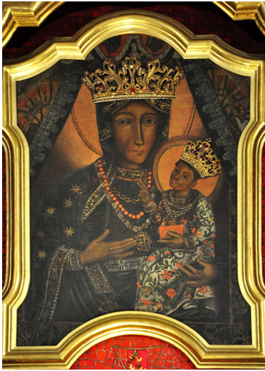
Fot. 4. Franciszek Śmiadecki, obraz Matki Boskiej Częstochowskiej w Wielkich Oczach.

interpretowana inwencją warsztatową, jednak sposób opracowania złocistego ornamentu na powierzchni tkaniny, który przypomina dekoracje szablony, różni go z rozbudowaną kolorystycznie i ornamentalnie dekoracją baldachimów na obrazach Śmiadeckiego (np. w Wielkich Oczach i Zamartem).