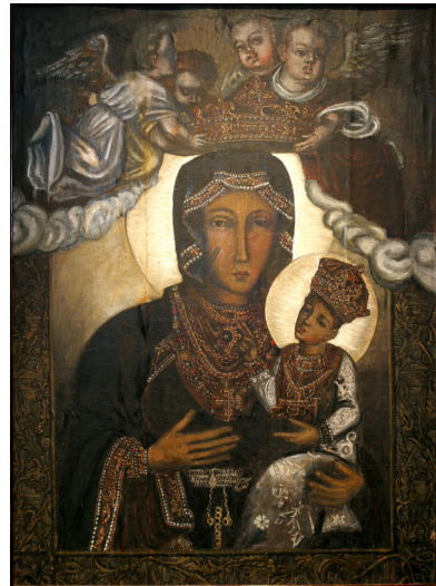
Fot. 3. Franciszek Śmiadecki, obraz Matki Boskiej Częstochowskiej w Starej Wsi.

Moim zdaniem, powstanie obrazu z Umienia należy przesunąć na pierwsze dwa dziesięciolecia XVII w. Analiza jego kompozycji o wyraźnie dekoracyjnym charakterze, prezentującej Matkę Bożą pod baldachimem zwieńczonym lambrekinem, w wysadzanej klejnotami gotyckiej, otwartej koronie i w stroju dekorowanym klejnotami, a także charakterystyczna fizjonomia twarzy Matki Bożej i Jezusa, wskazują na bliskie podobieństwo z grupą kopii obrazu Matki Boskiej Częstochowskiej wykonanych przez krakowskiego malarza Franciszka Śmiadeckiego (Śniadeckiego) czynnego między 1596 a 1615 rokiem 4 . Śmiadecki, jak podaje Jerzy Żmudziński, pozostawał w trwałych relacjach z Jasną Górą, wykonując, również na zlecenie paulinów, szereg kopii cudownego obrazu, które docierały także do odległych prowincjonalnych ośrodków 5 . Na sygnowanych przez malarza i datowanych na 1613 r. kopiach jasnogórskiej Madonny z kościołów w Starej Wsi koło Brzozowa (il. 3) oraz w Wielkich Oczach koło Lubaczowa (il. 4) 6 , a także w atrybuowanych mu wizerunkach, np. w Miejsu koło Namysłowa, czy Zamartem koło Chojnic, nad głową Matki Bożej widnieje otwarta, gotycka korona wysadzana klejnotami, a także – z wyjątkiem obrazu w Starej Wsi – wzorzysty baldachim z lambrekinem obszyty srebrną koronką 7 . Szata Matki Bożej i Jezusa ozdobiona jest pasem klejnotów obramionym sznurami pereł. Twarze Matki Bożej i Jezusa posiadają zawsze takie same