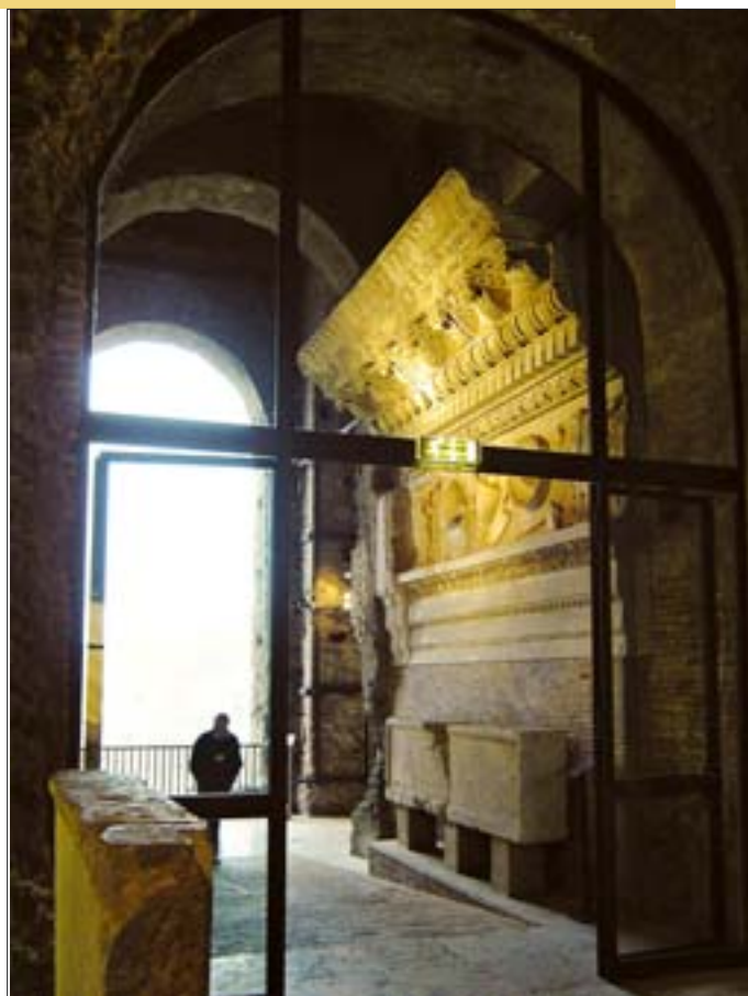
21. Kapitol, galeria Tabularium z ekspozycją fragmentu belkowania z jednej ze świątyni na Forum Romanum. 21. Capitol, the Tabularium gallery with an exposition of a fragment of the entablature in one of the temples in the Forum Romanum.