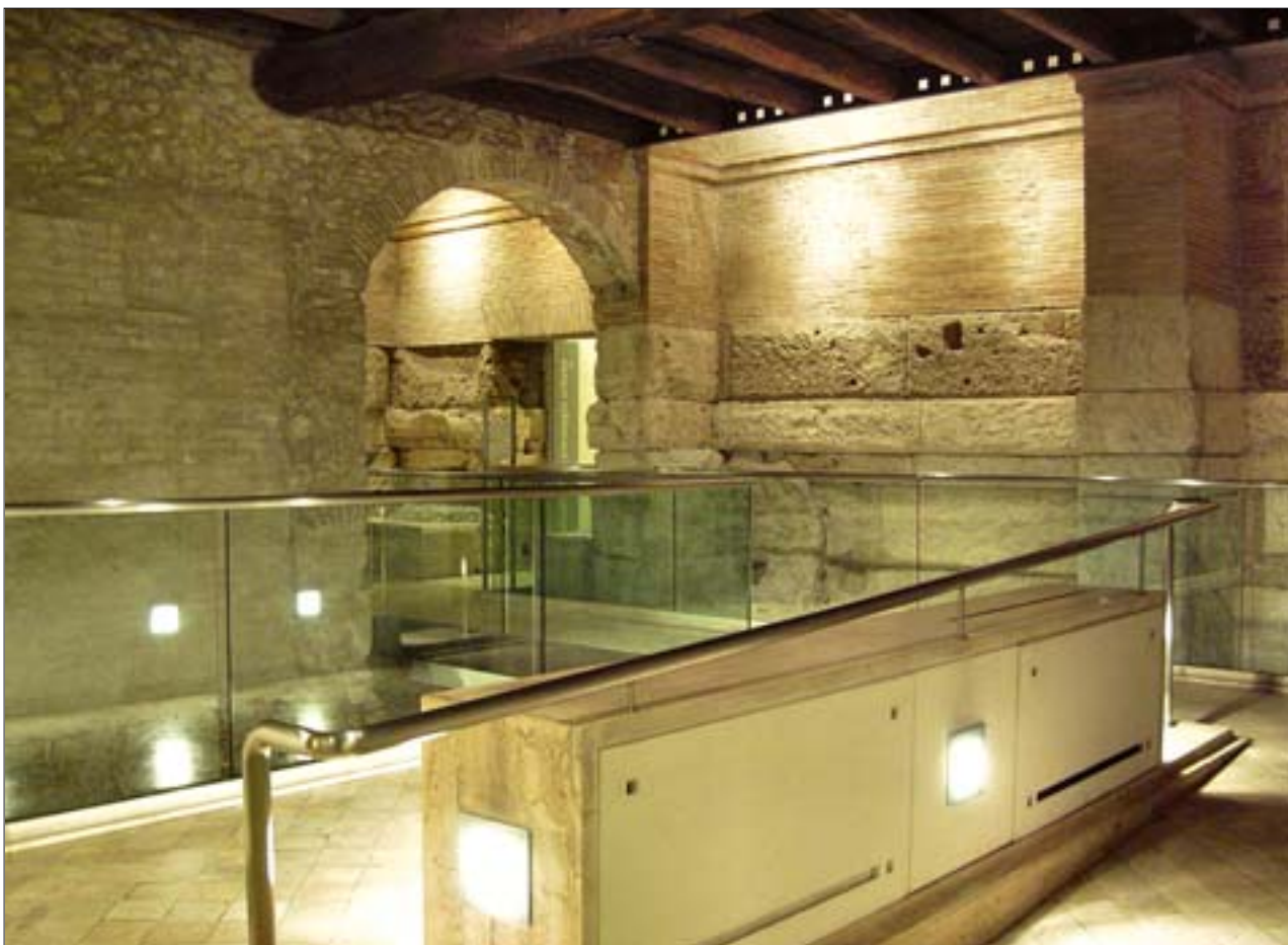
32. Museo Nazionale Romano, oddział Crypta Balbi, relikty antycznych i średniowiecznych budowli włączone w nowoczesną ekspozycję muzealną.

Realizacja ta miała cel propagandowo-polityczny: zabytki Rzymu antycznego miały być symbolami nowego faszystowskiego imperium, dlatego