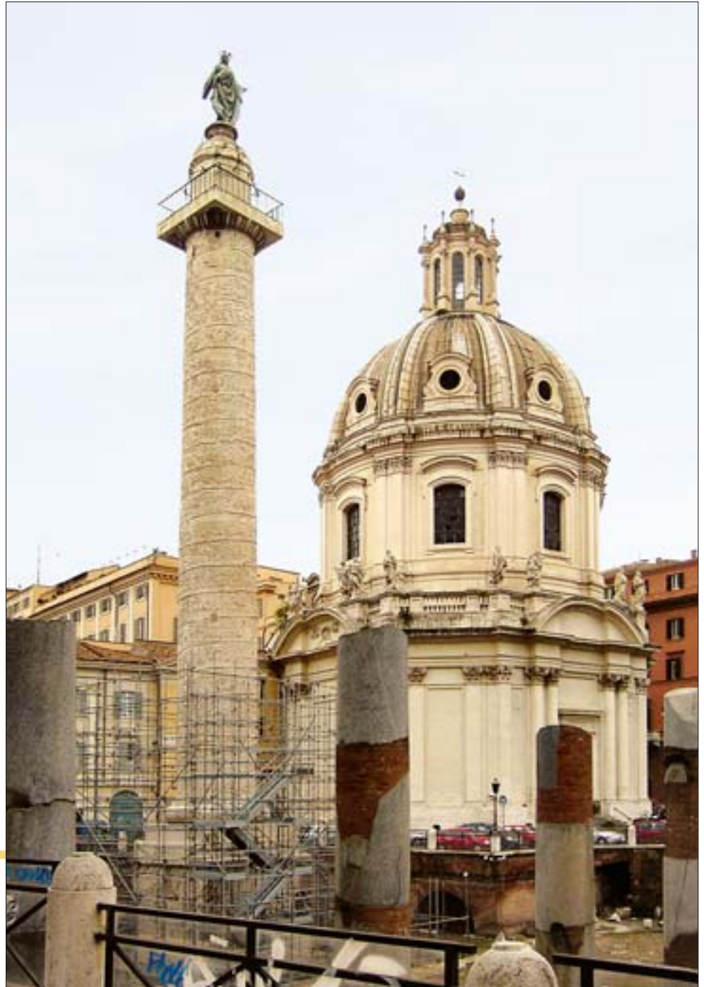
1. Kolumna Trajana, widok od strony Via dei Fori Imperiali.

Fellini, jak to zwykle czynił w swoich filmach, poprzez przerysowanie sytuacji wydobyl jej głębszy sens i wymiar. Rzym współczesny przenika się z Rzymem antycznym w sposób szczególny, nieporównywalny z innymi miastami europejskimi o antycznym rodowodzie. Skala Rzymu starożytnego była tak wielka, że niemal na całym obszarze współczesnej stolicy Włoch znajdziemy antyczne budowle, ich fragmenty wkomponowane w późniejsze struktury lub relikty czekające pod ziemią na odkrywcę.