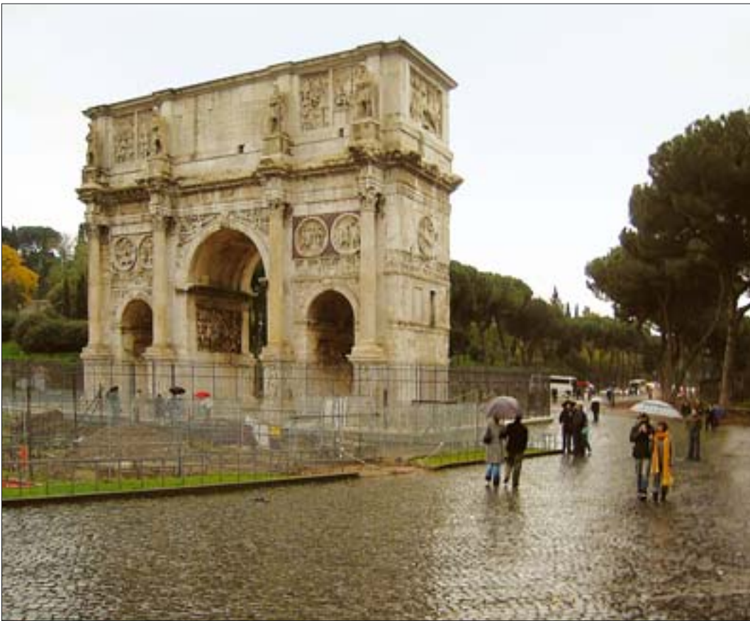
6. Łuk Konstantyna, widok od strony Koloseum. 6. Arch of Constantine, view from the Colosseum.