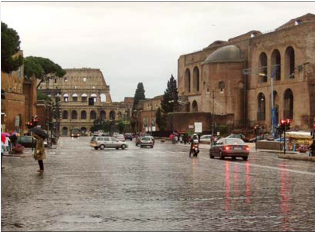
17. Via dei Fori Imperiali. Widok w stronę Kolozeum, po prawej Bazylika Maksencjusza i Konstantyna. Projekt restrukturyzacji przewiduje zasadnicze ograniczenie ruchu samochodowego i urządzenie pod ulicą zespołu ekspozycyjnego.