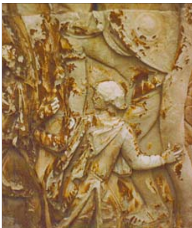
2. Fragment dekoracji rzeźbiarskiej kolumny Trajana w trakcie prac konserwatorskich w 1984 r., widoczne fragmenty starych powłok ochronnych.

Oba te antyczne monumenty zostały poddane konserwacji w 2. poł. lat 80. XX w. Przypomnijmy, że obie kolumny wykonane są z bloków białego marmuru i mają bogatą płaskorzeźbioną dekorację w formie spiralnej wstęgi z przedstawieniami najważniejszych wydarzeń – przeważnie wojennych – z okresu