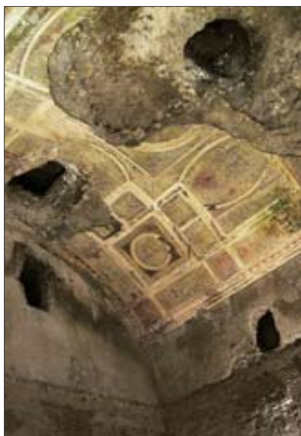
24. Domus Aurea, Sala Złoczonego Sklepienia (Sala della Volta Dorata) z resztkami antycznej dekoracji stiukowej.