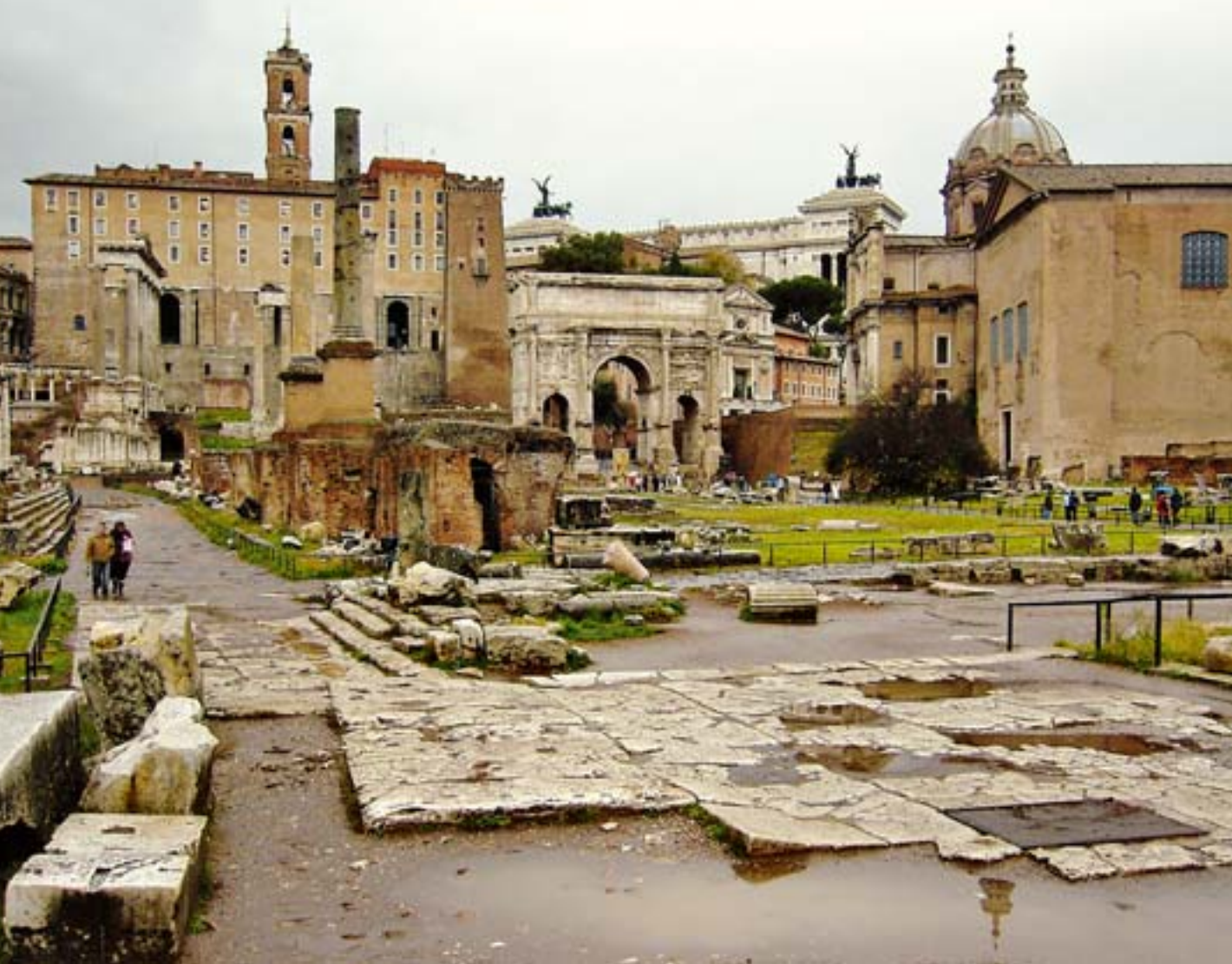
10. Północna część Forum Romanum, w tle Pałac Senatorów z relikwiami Tabularium. 10. Northern part of the Forum Romanum, in the background: the Senators' Palace with relics of the Tabularium.

zacieków. Pozostawiono także bez naprawy uszkodzenia powierzchni (ubytki). Dzięki temu odczyszczony fragment kolumnady zachował ślady mijającego czasu, pozwalając nadal na odczucie „dawności” zabytku. To poszanowanie patyny, a głębiej ujmując, autentyzmu zabytku obejmującego także „wartość dawności” 6 jest charakterystyczne dla włoskiej szkoły konserwatorskiej, zwłaszcza w odniesieniu do zabytków antycznych.