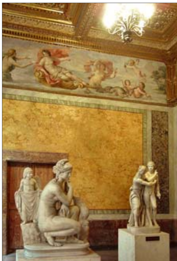
30. Museo Nazionale Romano, department in Palazzo Altemps, exposition of classical sculpture in the Duchess Room.