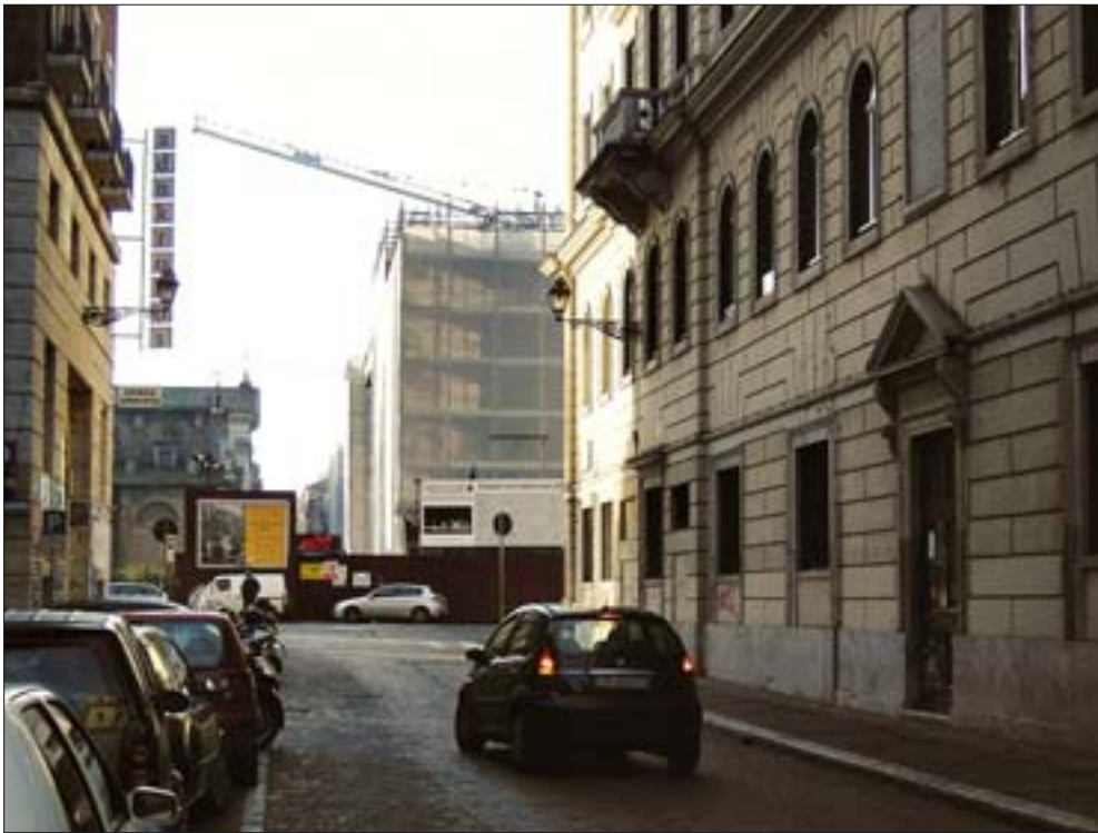
34. Via di Ripetta, nowy budynek Muzeum Ara Pacis wypełnia przerwę w pierzei, powstałą w wyniku wyburzeń w latach 30. XX w. 34. Via di Ripetta – the new building of the Ara Pacis Museum fills a gap produced in the row of houses by the demolitions conducted in the 1930s.

została połączona schodami i rampami z przestrzenią miejską. Tarasy umożliwiają widokowe powiązanie zarówno z otoczeniem Mauzoleum Augusta, jak i Tybrem.