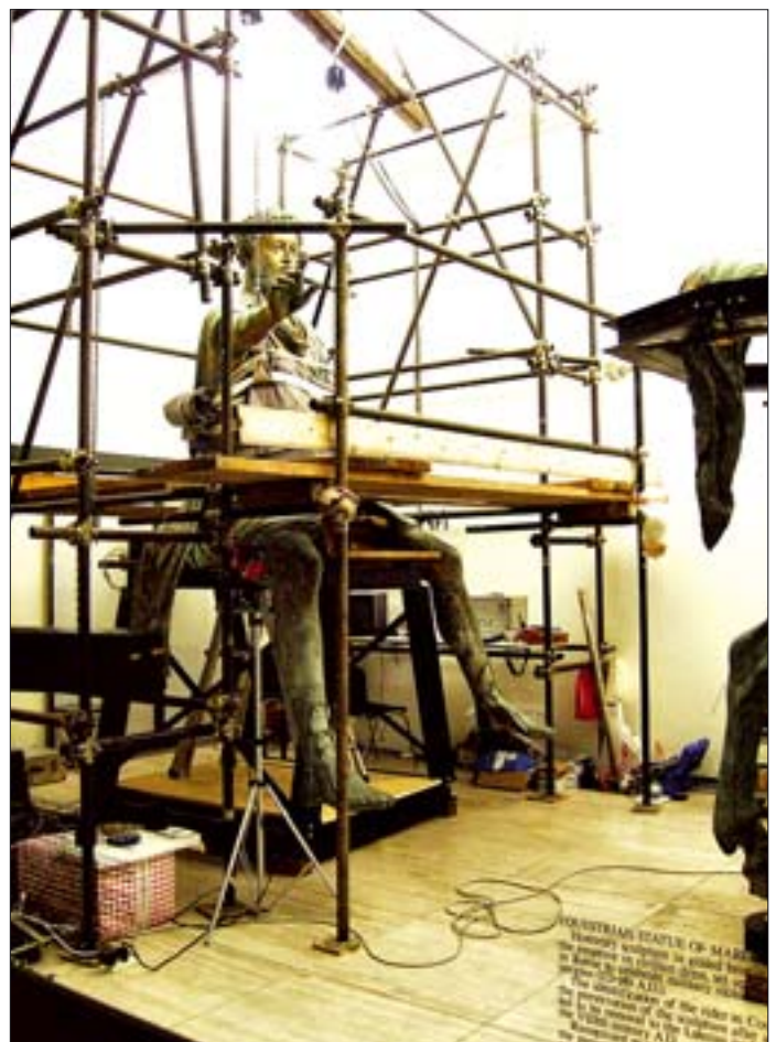
18. Posąg Marka Aureliusza w tymczasowej ekspozycji połączonej z pracami konserwatorskimi, stan w grudniu 2005 r.

Po długotrwałych pracach udostępniono dla zwiedzających pozostałości Tabularium – budowli mieszczącej w starożytności archiwum Rzymu, a włączonej w okresie nowożytnym do Pałacu Senatorów. Pozostałości te obejmują monumentalną galerię, otwartą arkadami ku Forum Romanum. Podstawowym materiałem użytym do budowy tej galerii są wielkie bloki wulkanicznego tufu. W galerii już w XIX w. umieszczono fragmenty belkowania ze świątyń znajdujących się pierwotnie na Forum, zestawione z autentycznych fragmentów. Umożliwia to podziwianie finezyjnej dekoracji tych antycznych elementów architektonicznych, a jednocześnie ich ochronę przed czynnikami atmosferycznymi. Wobec wielkich wymiarów tych elementów galeria Tabularium jest optymalnym miejscem ekspozycji – zwykle sale