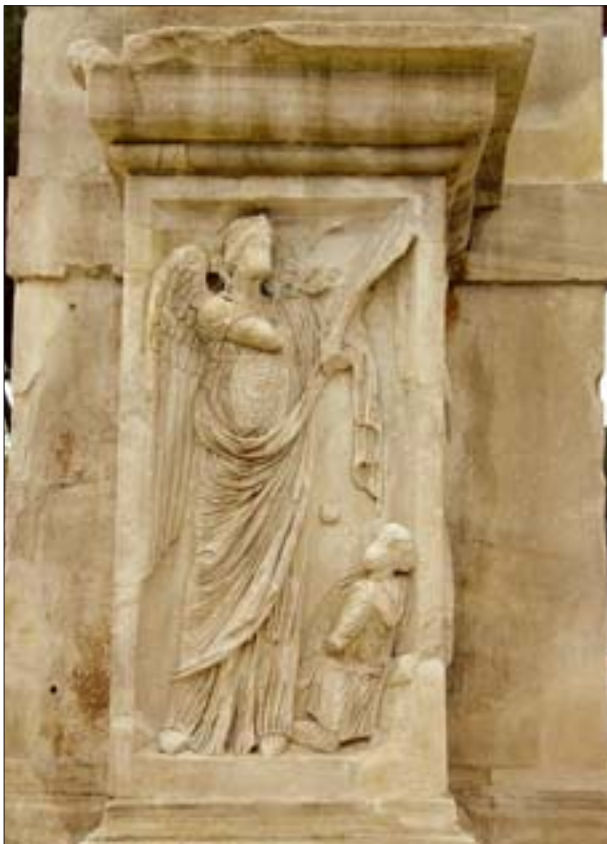
7. Płaskorzeźba w partii cokołowej Łuku Konstantyna, dobry stan zachowania po kilkunastu latach od konserwacji. 7. Bas relief in the socle of the Arch of Constantine, satisfactory state of preservation more than ten years after the conservation.