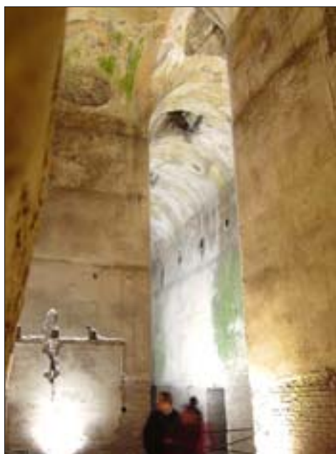
25. Domus Aurea, kryptoportyk, widoczne objawy korozji biologicznej (glony), wysolenia i zacieki związane z penetrującą do wnętrza wodą opadową.