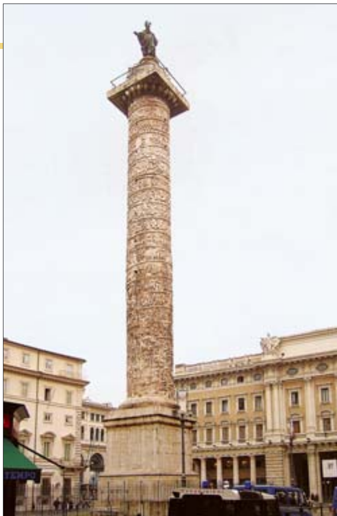
3. Piazza della Colona, kolumna Marka Aureliusza.

2. Fragment of the carved decoration of Trajan's Column in the course of conservation in 1984, with visible fragments of the old protective covers.