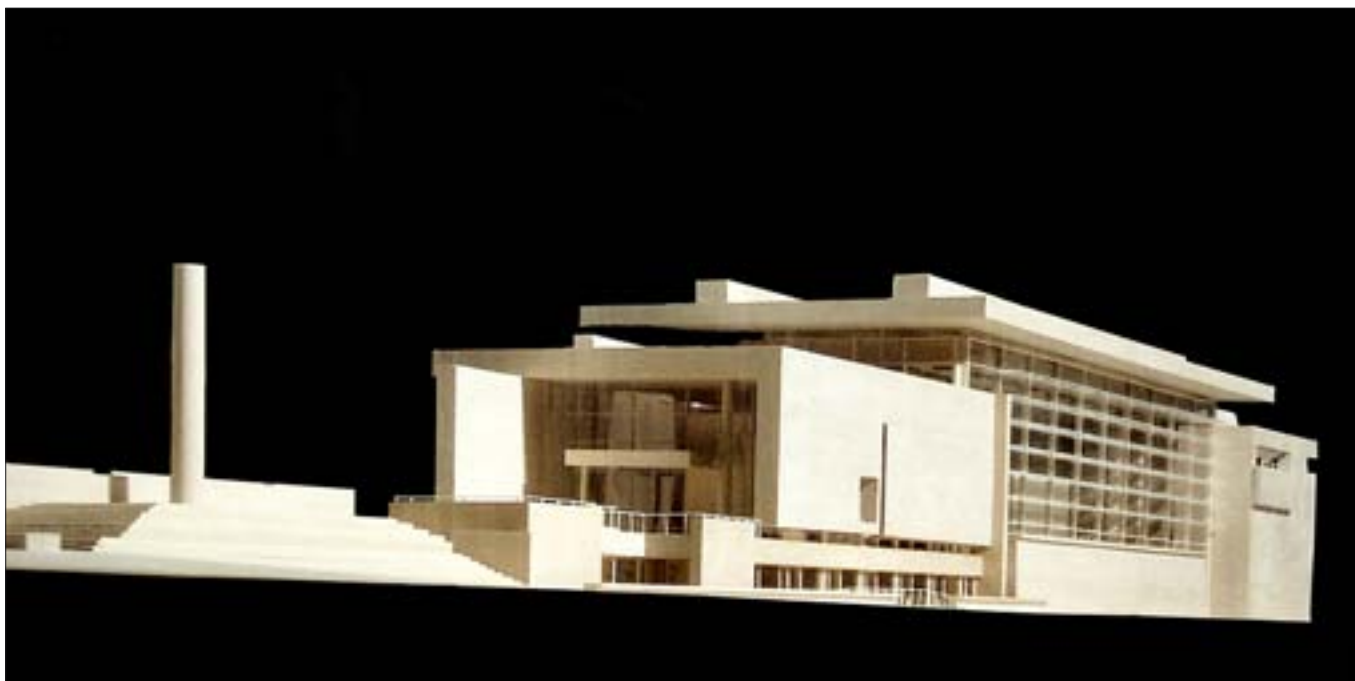
36. Wizualizacja projektu nowego Muzeum Ara Pacis, prezentowana na miejscu realizacji budynku.