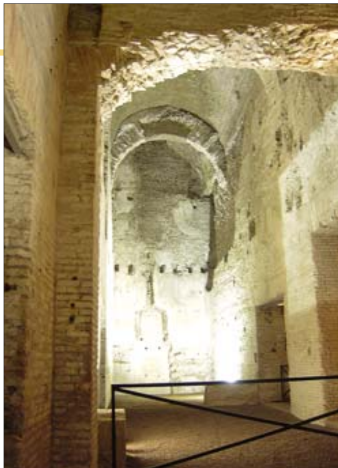
23. Domus Aurea, podziemne wnętrza oświetlone w sposób wydobywający monumentalne proporcje architektury i fakturę materiału.

Dzięki bogatej ikonografii „grot”, znanych obecnie jako Domus Aurea, możemy ocenić zmiany stanu zachowania dekoracji. Porównanie ikonografii ze stanem obecnym wskazuje, że we wnętrzach Domus Aurea nastąpił proces destrukcji podobny do tego, jaki pokazał w swoim filmie Fellini, tyle że rozłożony na pięć wieków. Część dekoracji w ciągu tego czasu po prostu odpadła ze ścian, inne zmieniły kolor, zbladły, kolejne zostały uszkodzone przez wysolenia i rozwój mikroorganizmów.