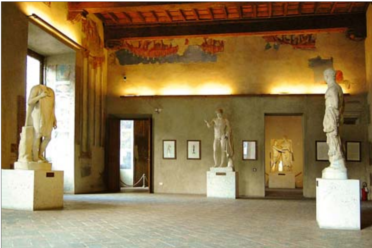
29. Museo Nazionale Romano, oddział w Palazzo Altemps, ekspozycja rzeźby antycznej w renesansowych wnętrzach pałacowych (Sala delle Prospettive).