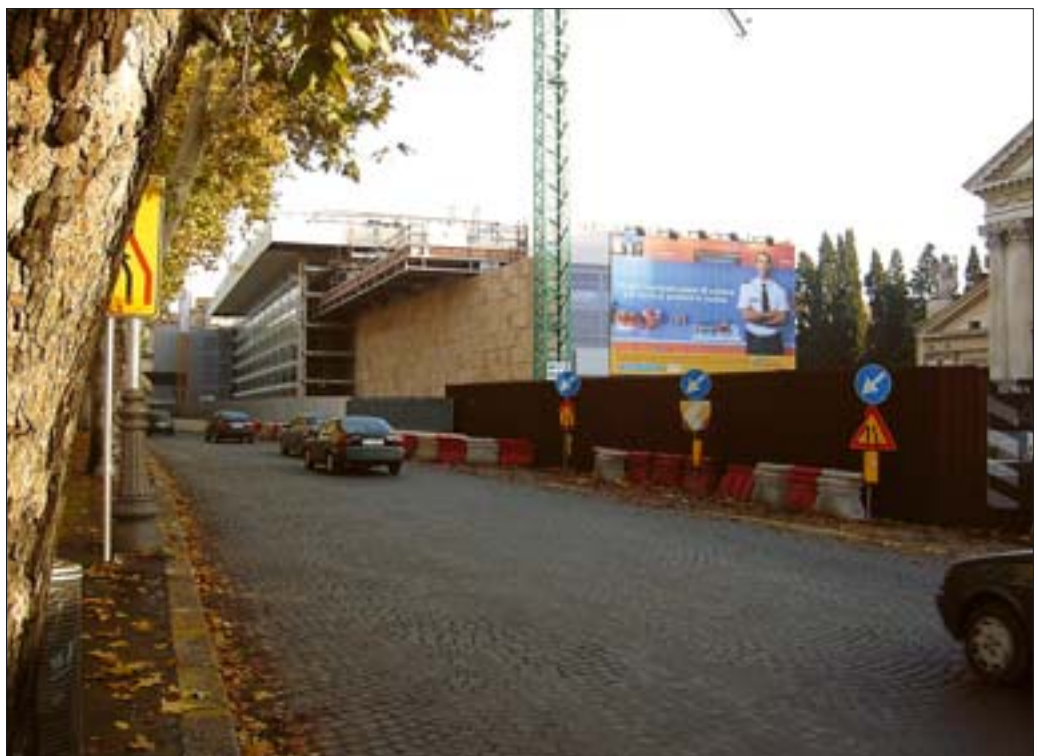
35. Nowy budynek Muzeum Ara Pacis od strony Tybru, w trakcie realizacji, stan w grudniu 2005 r. 35. New building of the Ara Pacis Museum seen from the Tiber, in the course of realisation, state in December 2005.

właśnie dlatego z dużą konsekwencją i rozmachem rozbudowywana jest w Rzymie sieć muzealnych ekspozycji archeologicznych, traktowanych jako istotny składnik współczesnej struktury miasta. Ekspozycje te prezentują elementy architektoniczne i dzieła sztuki w sposób atrakcyjny i zrozumiały dla zwiedzającego; w pobliżu miejsc, z których pochodzą; w powiązaniu z prezentacją relikwów budowli. W przeciwieństwie do tendencji wywodzącej się z lat 30. XX w., a polegającej na wyizolowaniu zabytków antycznych, „oczyszczeniu” z późniejszych nawarstwień, obecnie dąży się do prezentacji tych zabytków