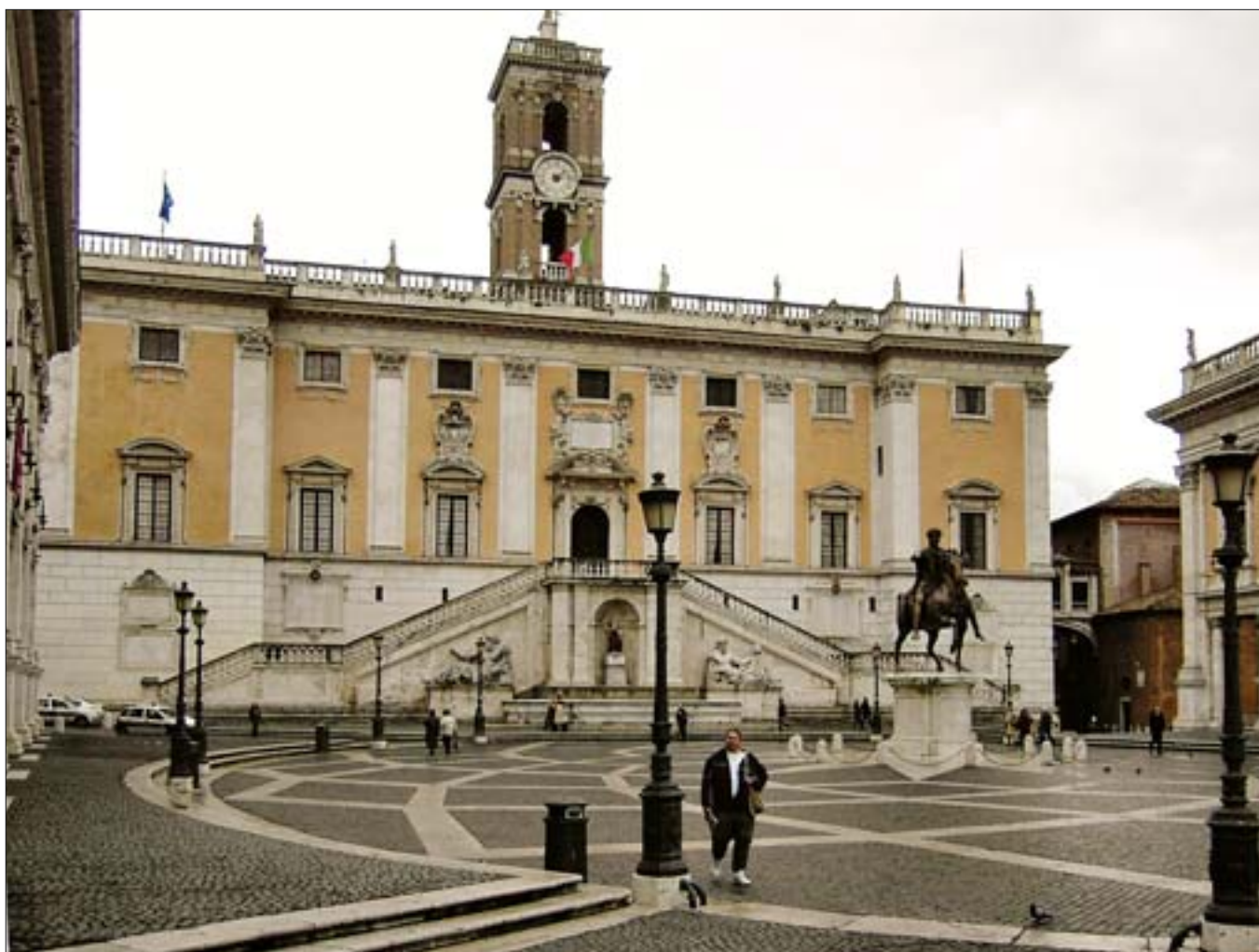
19. Plac Kapitoński z kopią pomnika konnego Marka Aureliusza, w tle Pałac Senatorów. 19. Capitoline Square with a copy of the equestrian statue of Marcus Aurelius. In the background: the Senators Palace.

muzealne byłyby dla nich zbyt ciasne. Z galerii można też zobaczyć zachowane in situ na Forum pozostałości świątyni, z których pochodzą.