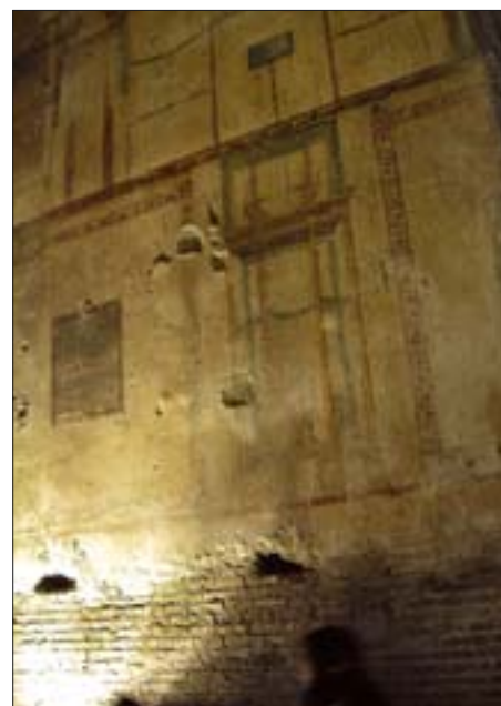
26. Domus Aurea, relikty dekoracji malarskiej w pomieszczeniu nr 78 (kryptoportyk).