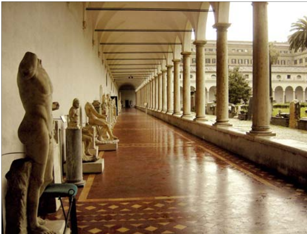
27. Museo Nazionale Romano, oddział w Termach Dioklecjana, krużganek w dziedzińcu Michała Anioła, ekspozycja rzeźb antycznych pochodząca z końca XIX w.

Założone w 1889 r. Rzymskie Muzeum Narodowe jest instytucją muzealną o profilu archeologicznym, dlatego podlega wspomnianemu już urzędowi konserwatorskiemu ds. archeologii (Soprintendenza Archeologica di Roma), a nie urzędowi nadzorującemu większość muzeów rzymskich (Soprintendenza Speciale per il Polo Museale Romano). W mieście tak szczególnym, jak Rzym, na zbiory archeologiczne składają się w pierwszym rzędzie kolekcje rzeźb o wyjątkowej wartości artystycznej, m.in. znane z podręczników historii sztuki.