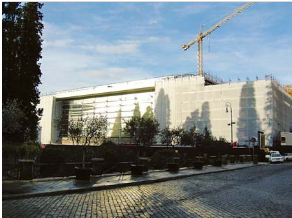
33. Nowe Muzeum Ara Pacis, widok od strony wschodniej, w trakcie realizacji, stan w grudniu 2005 r. 33. New Ara Pacis Museum – view from the east, in the course of realisation, state in December 2005.

względy konserwatorskie znalazły się na drugim planie. Pawilon, mający chronić Ara Pacis, od początku stwarzał problemy konserwatorom. Przeszkłona konstrukcja pawilonu Morpurgo powodowała duże różnice temperatury i wilgotności we wnętrzu niekorzystnie oddziałujące na zabytek. Z tych właśnie względów władze Rzymu podjęły decyzję o budowie nowego obiektu muzealnego przeznaczonego na ekspozycję Ołtarza Pokoju. Założenia projektu były jednak szersze: nowa budowla miała jednocześnie być głównym elementem rewitalizacji całego placu i otoczenia. W 1995 r. opracowanie projektu powierzono amerykańskiemu architektowi Richardowi Meierowi, twórcy wielu znanych obiektów muzealnych 15 . W 2001 r. wykonano specjalną osłonę dla ołtarza i wyburzono pawilon Morpurgo, co było przygotowaniem do realizacji projektu Meiera.