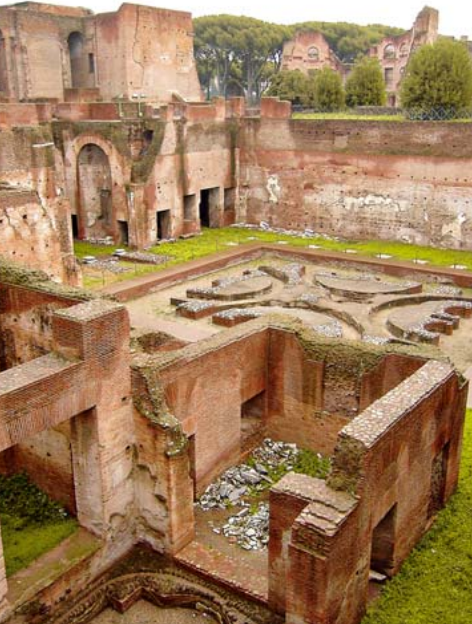
13. Palatyn, ruiny jednego z pałaców cesarskich (Domus Augustana). 13. Palatine, ruins of one of the imperial palaces (Domus Augustana).