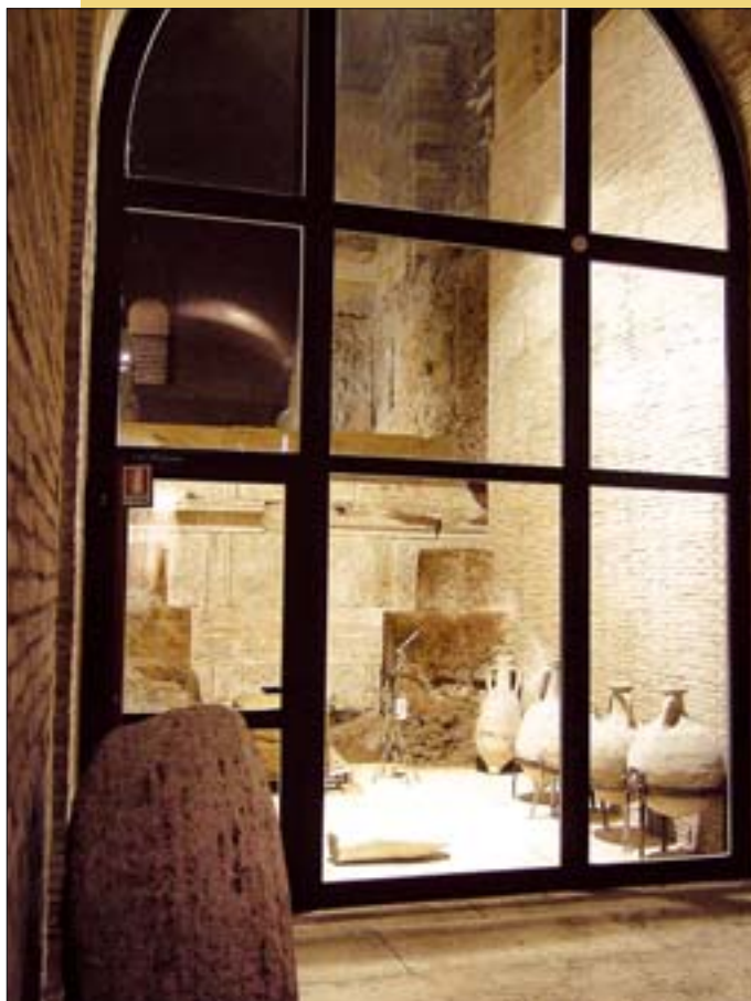
20. Kapitol, nowa ekspozycja relikwii Templum Veiovi (świątyni młodego Jowisza). 20. Capitol, new exposition of the relics of Templum Veiovi (temple of young Jove).