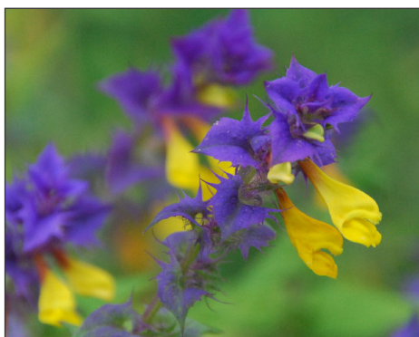
Fot. 1. Pszeniec gajowy Melampyrum nemorosum