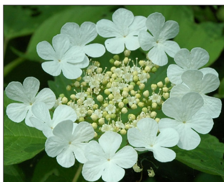
Fot. 6. Kalina koralowa Viburnum opulus