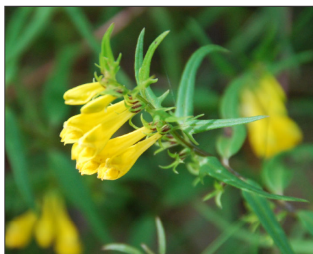
Fot. 2. Pszeniec zwyczajny Melampyrum pratense