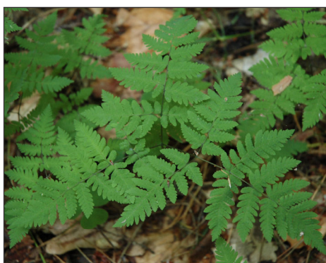
Fot. 5. Cienistka (zachyłka) trójkątna Gymnocarpium dryopteris