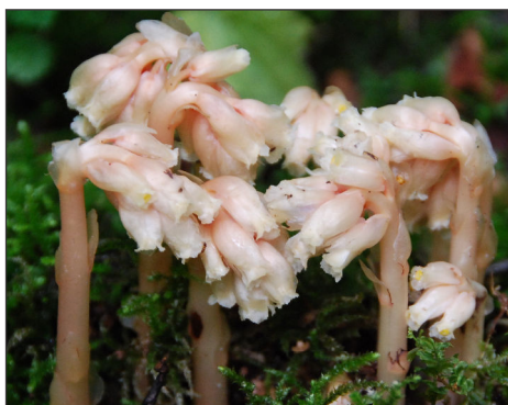
Fot. 3. Korzeniówka pospolita Monotropa hypopitys