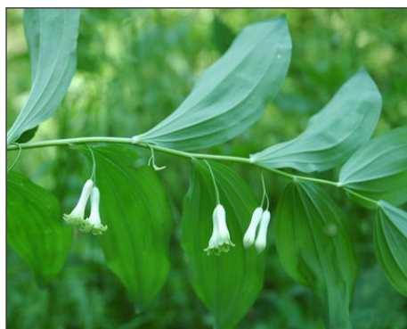
Fot. 4. Kokoryczka wielokwiatowa Polygonatum multiflorum