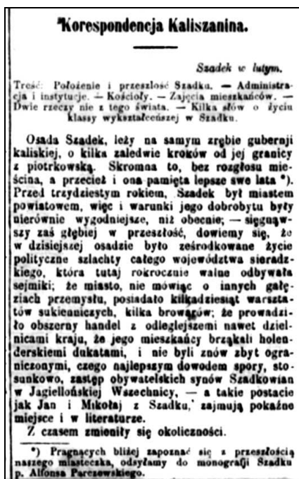
Fot. 2. Fragment korespondencji z Szadku, „Kaliszanin” 1875, nr 18

W skład zarządu gminnego wchodziło: wójt, podwójt, dwaj pisarze, trzech ławnicy, trzech podławnicy i jedenastu sołtysów. Na gminne fundusze składały się środki gminy i osobno osady Szadek. Kasę gminną tworzyły fundusze pochodzące ze spraw karnych oraz podatek płacony przez włościan na utrzymanie administracji gminnej. Z kolei kasę Szadku stanowiły dochody z dzierżawy ogrodów – stanowiących niegdyś własność kamery pruskiej – a także rzeźni, dochody od patentów szynkarskich, opłata za czynności rejentalne oraz procent od kapitału – stanowiącego własność osady – złożonego w Banku Polskim i kar z defraudacji leśnych. Dziwił się tylko Szadkowiec, iż posiadając fundusze, mieszkańcy Szadku nie pomyśleli o założeniu kasy pożyczkowej na wzór wielu innych, tworzonych w gminach posiadających mniejsze środki finansowe. Według korespondenta, takie postępowanie miało niekorzystny wpływ na opinię o szadkowiec.