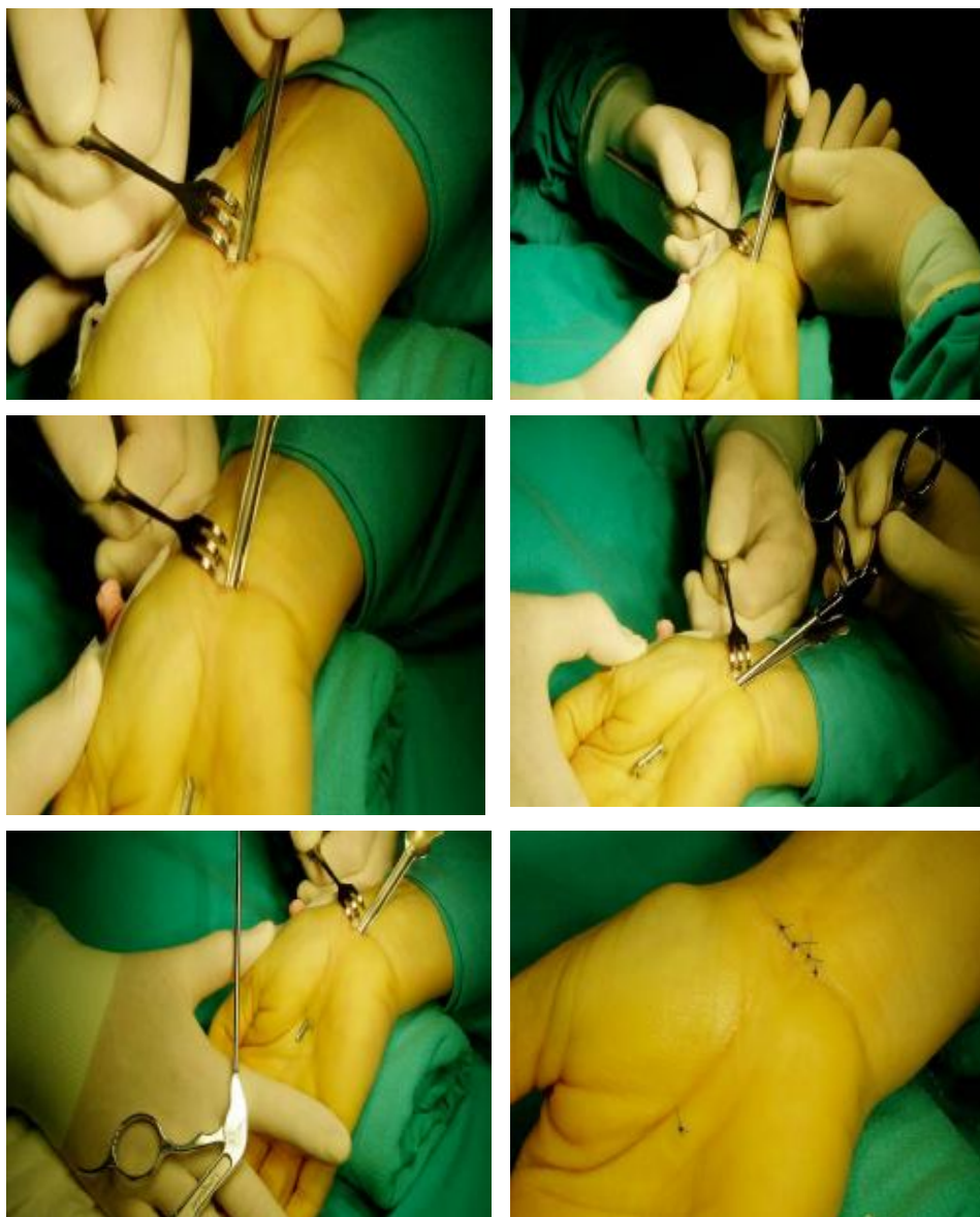
Ryc. 5, 6, 7, 8, 9, 10. Właściwa część przecięcia więzadła poprzecznego w metodzie endoskopowej odbarczenia ZCN