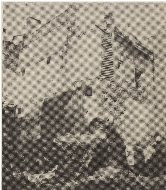
8. Lublin, oficyny budynków przy ul. Grodzkiej 3 i 5; prace budowlano-konserwatorskie prowadzone przez PP PKZ — Oddział w Lublinie, stan w marcu 1980 r.