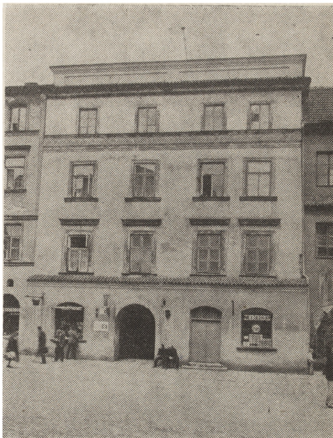
4. Lublin, Rynek 5, stan w kwietniu 1980 r.

3. Lublin, building at 3, Grodzka street; building and conservation works carried out by the State Enterprise for Monuments Conservation, Lublin section, condition in April 1980