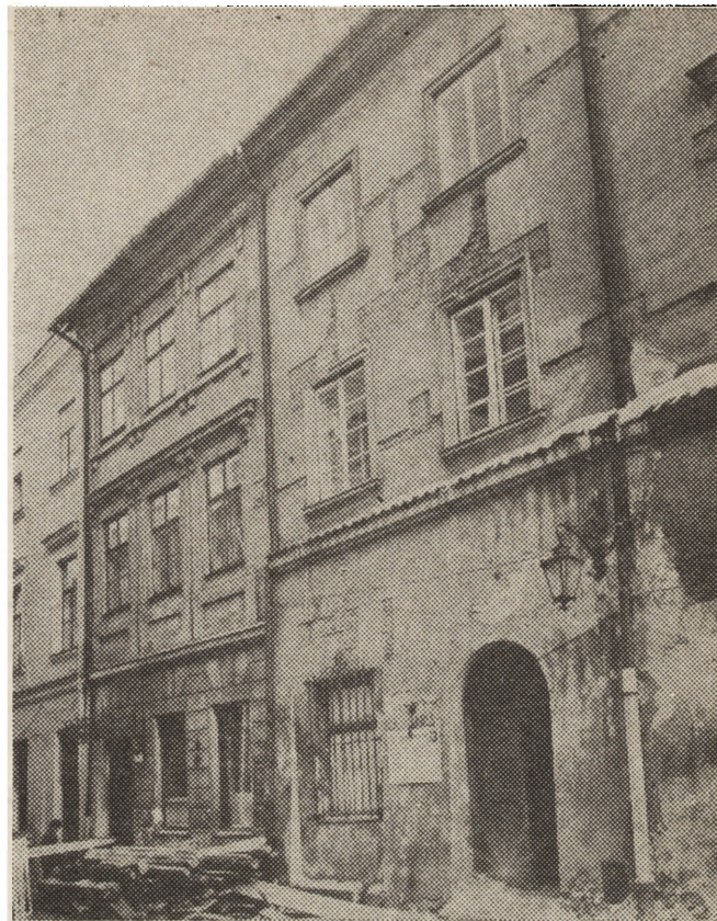
7. Lublin, budynki przy ul. Grodzkiej 3 i 5, stan w kwietniu 1980 r.

6. Lublin, Market Square no 8, condition in April 1980