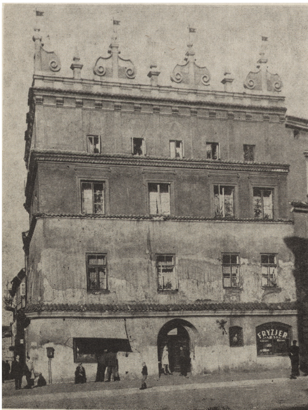
2. Lublin, Rynek 6, stan w kwietniu 1980 r.

W dniu 8 lutego 1979 r. odbyło się w Urzędzie Wojewódzkim w Lublinie posiedzenie Międzyresortowej Komisji ds. Rewaloryzacji Miast i Zespołów Staro-