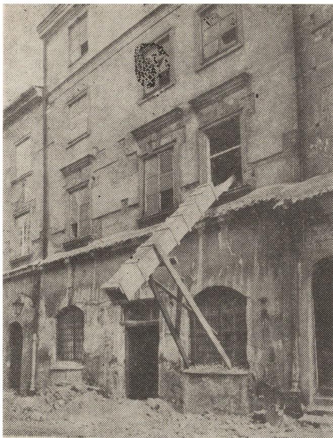
3. Lublin, budynek przy ul. Grodzkiej 3; prace budowlano-konserwatorskie prowadzone przez PP PKZ — Oddział w Lublinie, stan w kwietniu 1980 r.

3. Lublin, building at 3, Grodzka street; building and conservation works carried out by the State Enterprise for Monuments Conservation, Lublin section, condition in April 1980