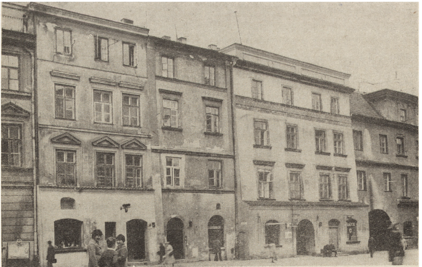
5. Lublin, pierzeja rynkowa, stan w kwietniu 1980 r.

Rada opiniuje i zatwierdza konserwatorskie problemy stawiane przez generalnego projektanta Starego Miasta w Lublinie oraz przedkłada wnioski prezydentowi miasta w sprawach wymagających decyzji administracyjnych.